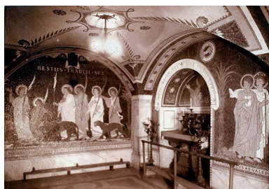
Antiquaille. Mosaïque du caveau de Saint-Pothin [chapelle souterraine, vue de l'angle où se trouve l'autel], ca 1910-1920 IVR82_20026900635XAB