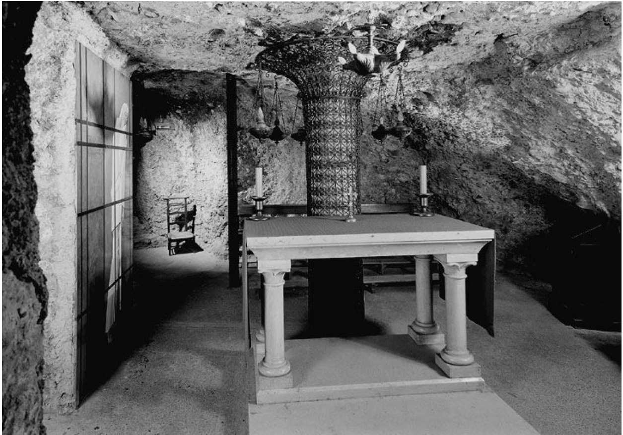
Autel du caveau