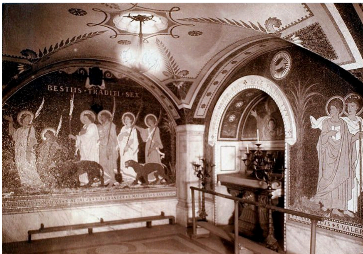
Antiquaille. Mosaique du caveau de Saint-Pothin [chapelle souterraine, vue de l'angle où se trouve l'autel], ca 1910-1920