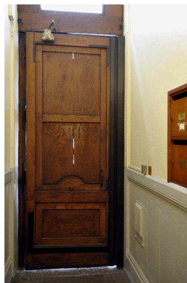
Vue intérieure : le revers de la porte d'entrée IVR82_20156901230NUCA