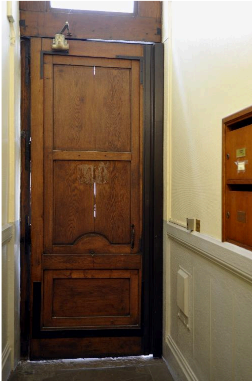
Vue intérieure : le revers de la porte d'entrée