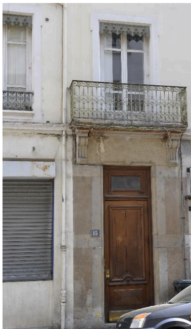
Porte piétonne surmontée d'un balcon central IVR82_20156901228NUCA