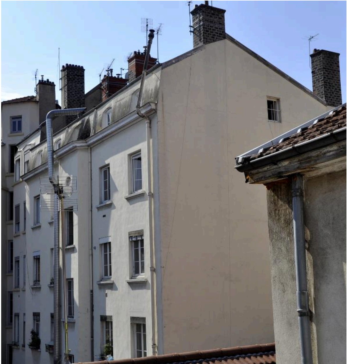
Vue latérale : mur pignon ouest, comble brisé sur cour uniquement