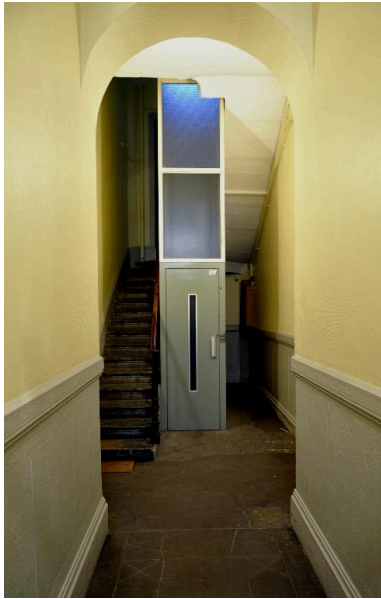
Vue intérieure : l'allée et le départ de l'escalier