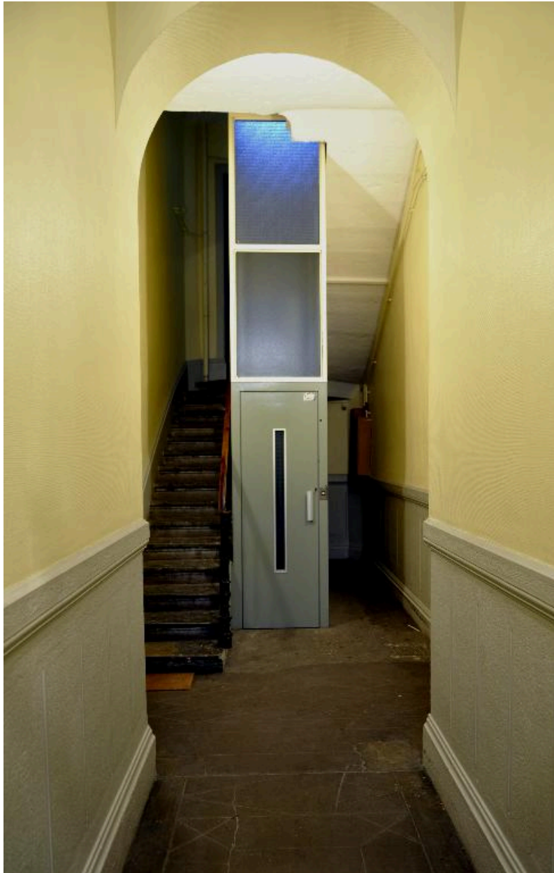
Vue intérieure : l'allée et le départ de l'escalier