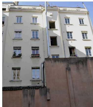
Elévation postérieure IVR82_20156901225NUCA