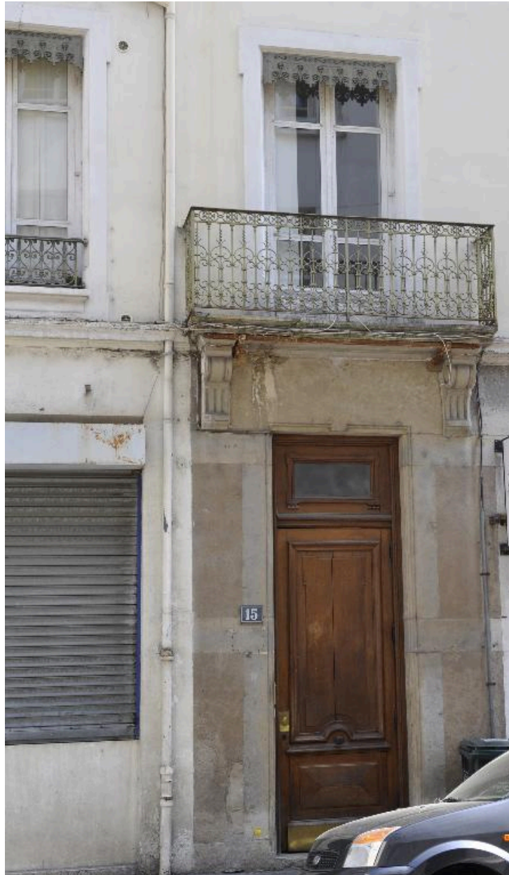
Porte piétonne surmontée d'un balcon central