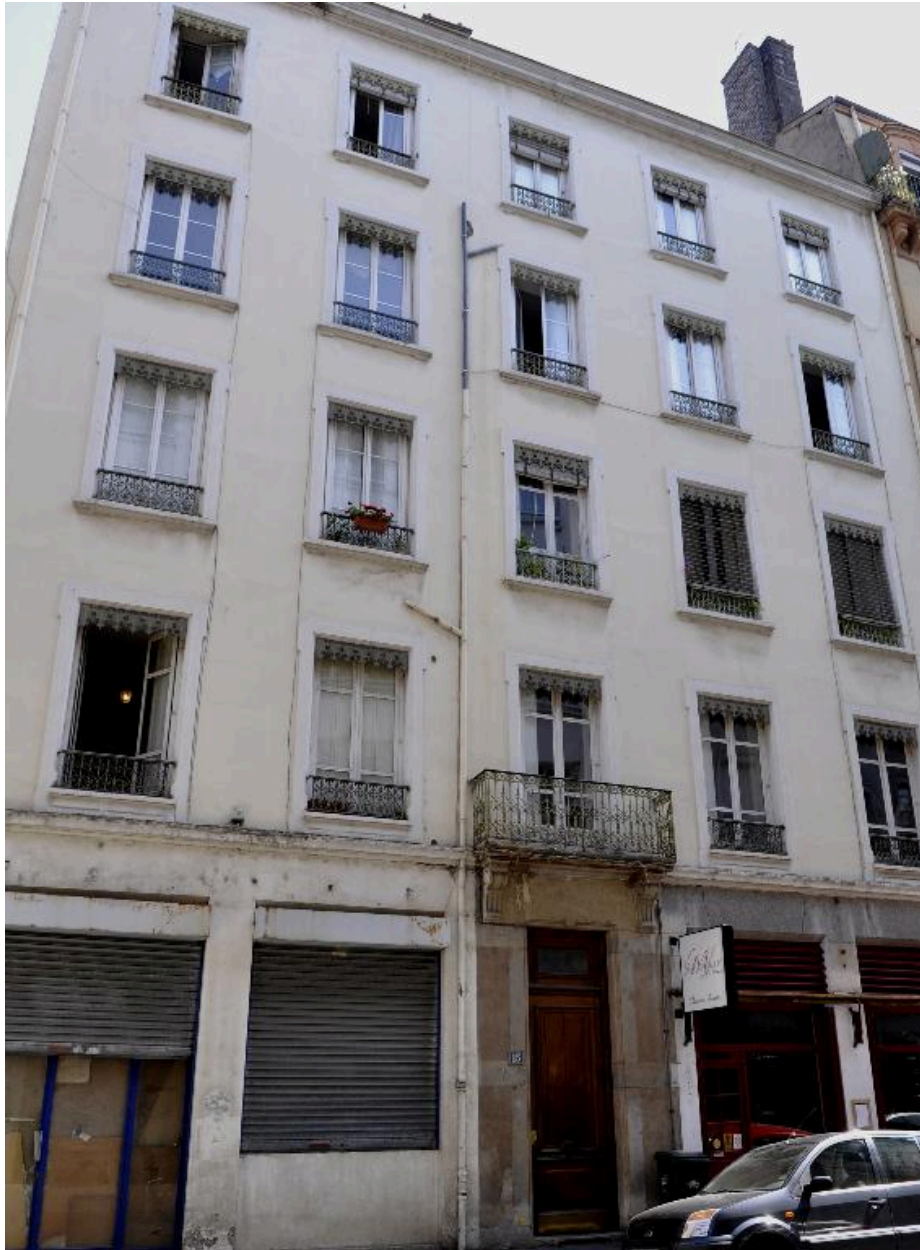
Vue générale de l'élévation sur rue