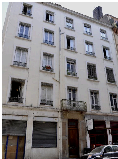
Vue générale de l'élévation sur rue