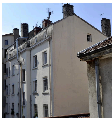
Vue latérale : mur pignon ouest, comble brisé sur cour uniquement IVR82_20156901226NUCA