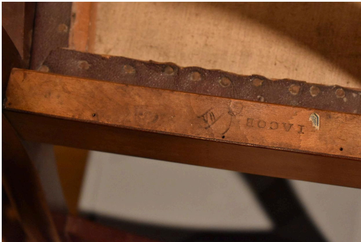
Vue de l'estampille