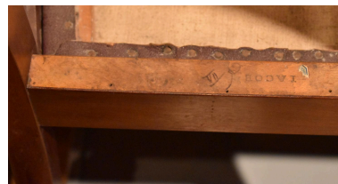
Vue de l'estampille IVR84_20216301417NUC4A