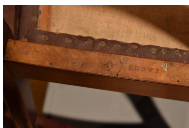
Vue de l'estampille IVR84_20216301418NUC4A