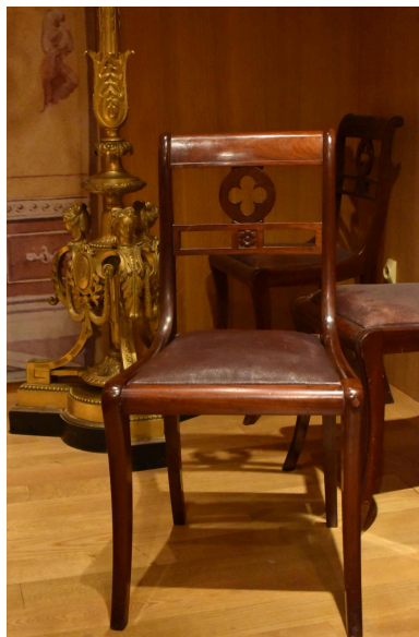
Vue générale d'une chaise IVR84_20216301415NUC4A