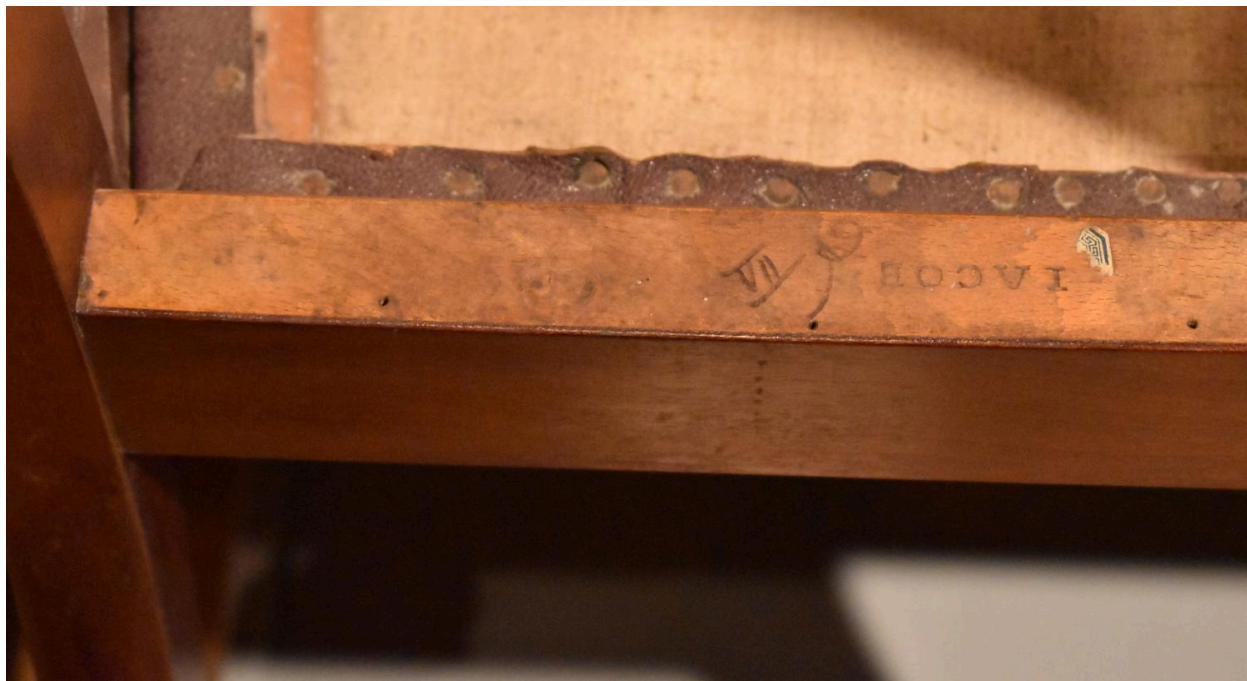
Vue de l'estampille