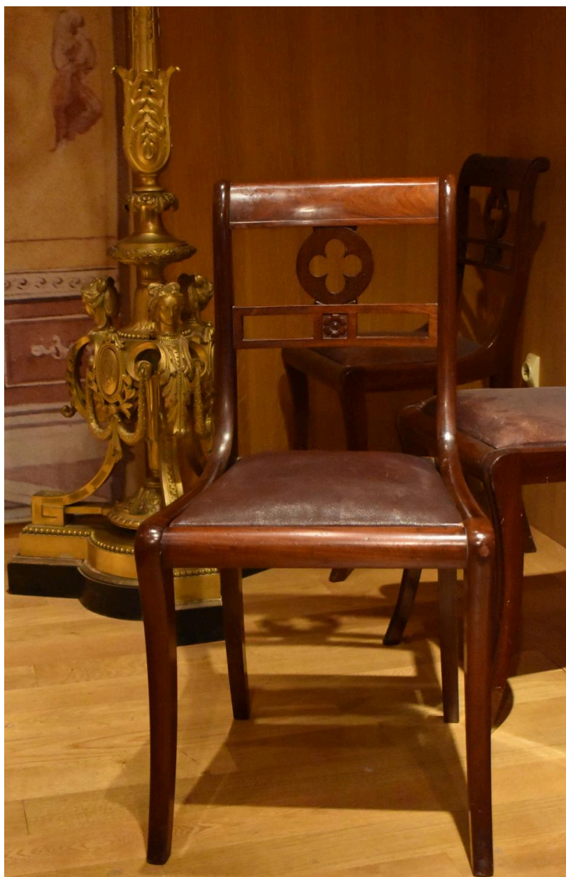
Vue générale d'une chaise