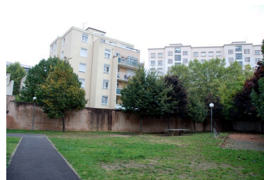
Vue de l'angle sud est de la parcelle, jardin IVR82_20116901560NUCA