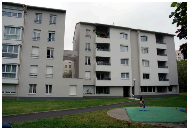
Vue générale IVR82_20116901557NUCA