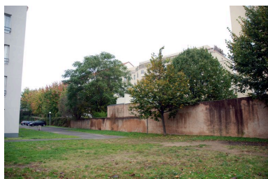
Vue nord de la parcelle, mur de clôture IVR82_20116901561NUCA