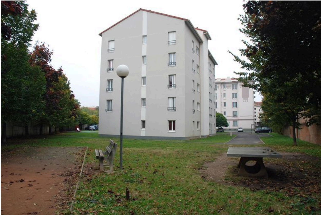
Vue de l'élévation depuis le sud est