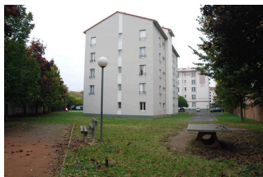
Vue de l'élévation depuis le sud est IVR82_20116901559NUCA