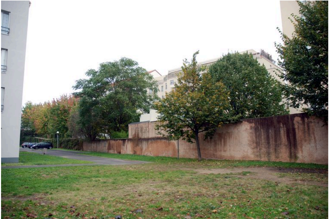
Vue nord de la parcelle, mur de clôture