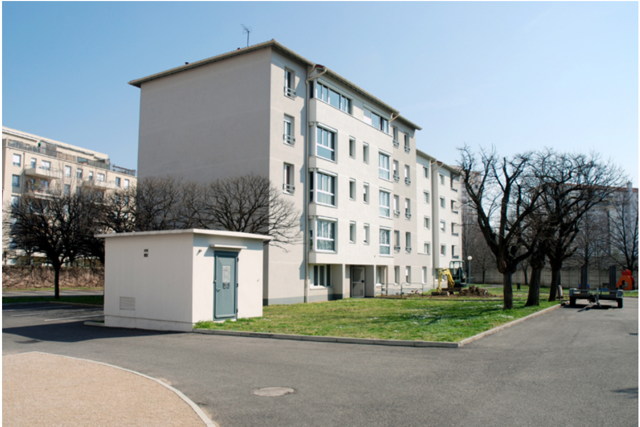
Vue générale depuis le nord