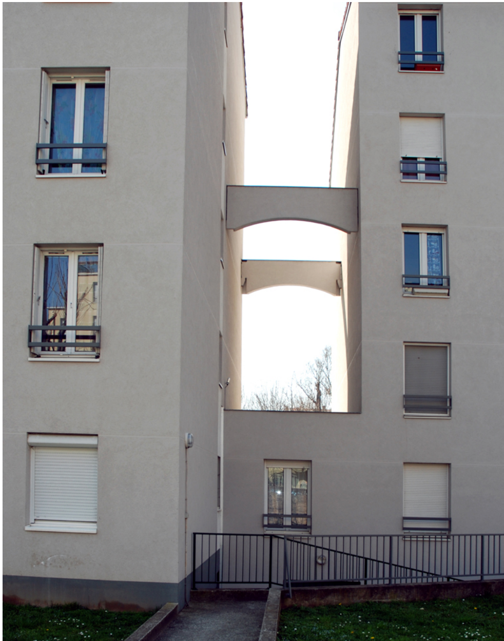
Vue de la liaison entre les deux immeubles