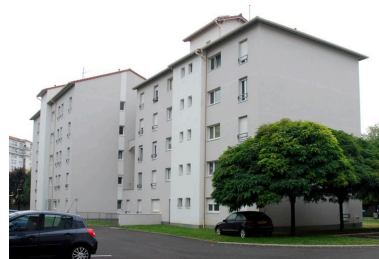
Vue d'ensemble depuis le sud IVR82_20116901558NUCA