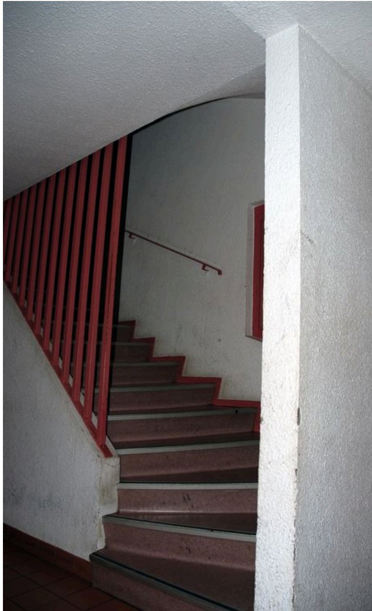
Départ de l'escalier