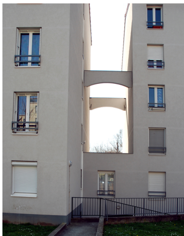
Vue de la liaison entre les deux immeubles