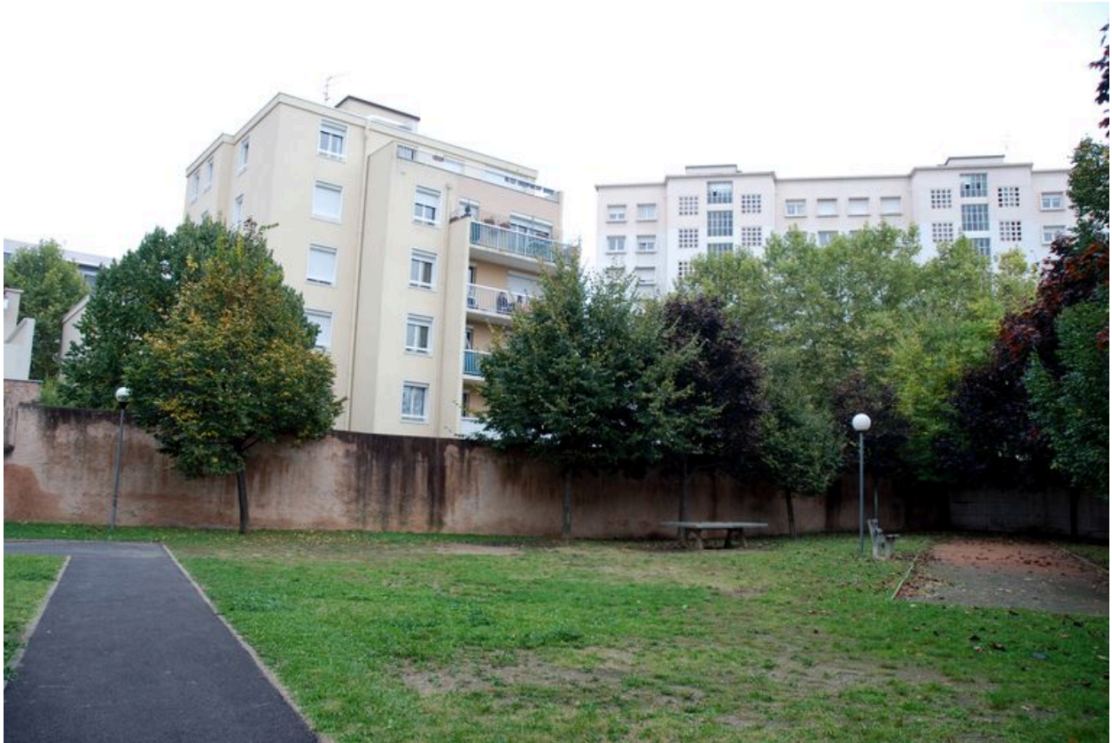
Vue de l'angle sud est de la parcelle, jardin