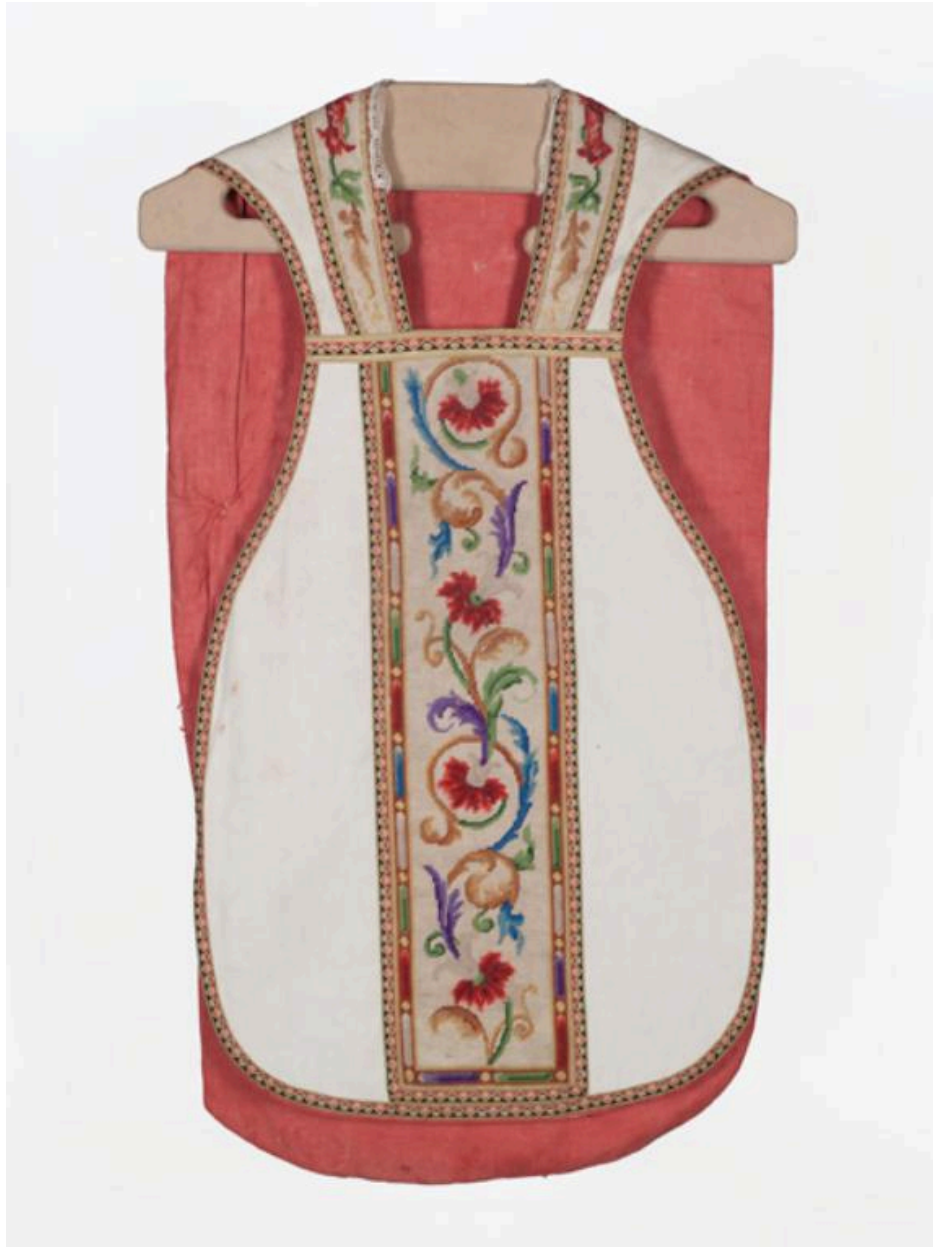
Vue générale du devant de la chasuble.