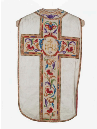
Vue générale du dos de la chasuble.