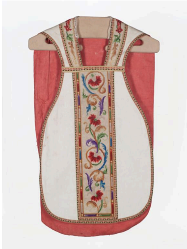
Vue générale du devant de la chasuble.