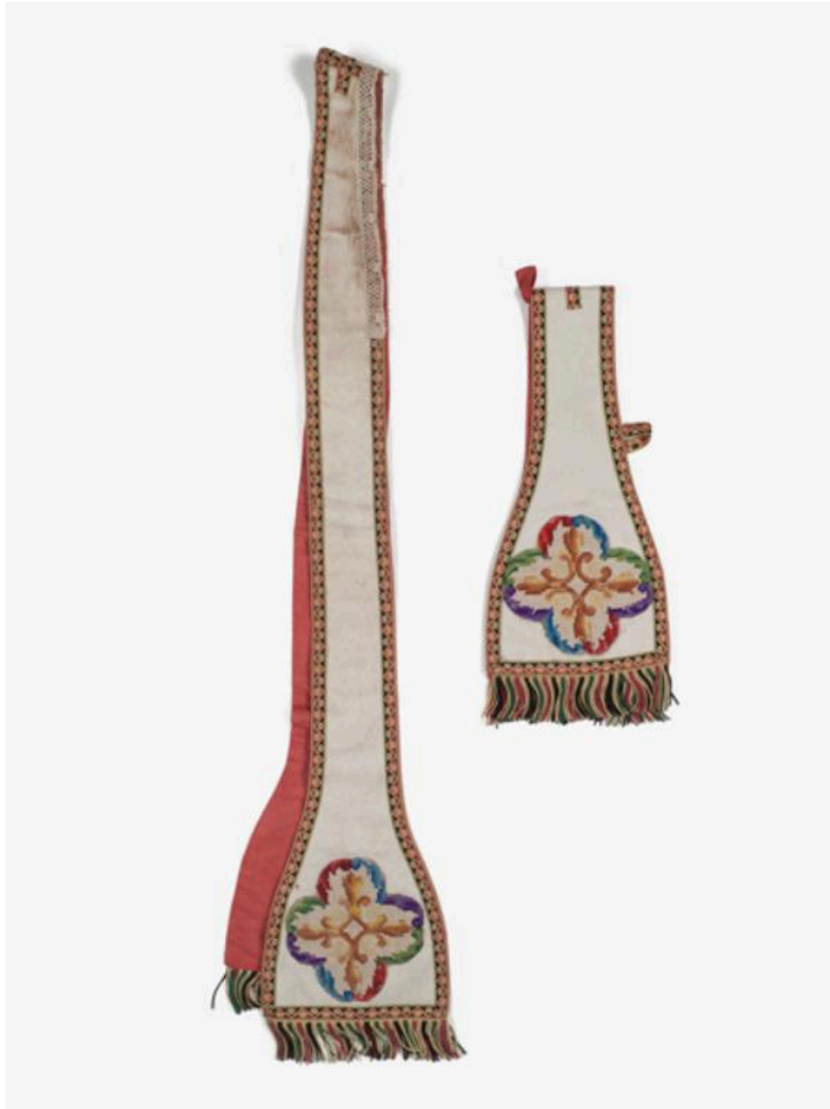
Vue générale de l'étole et du manipule.