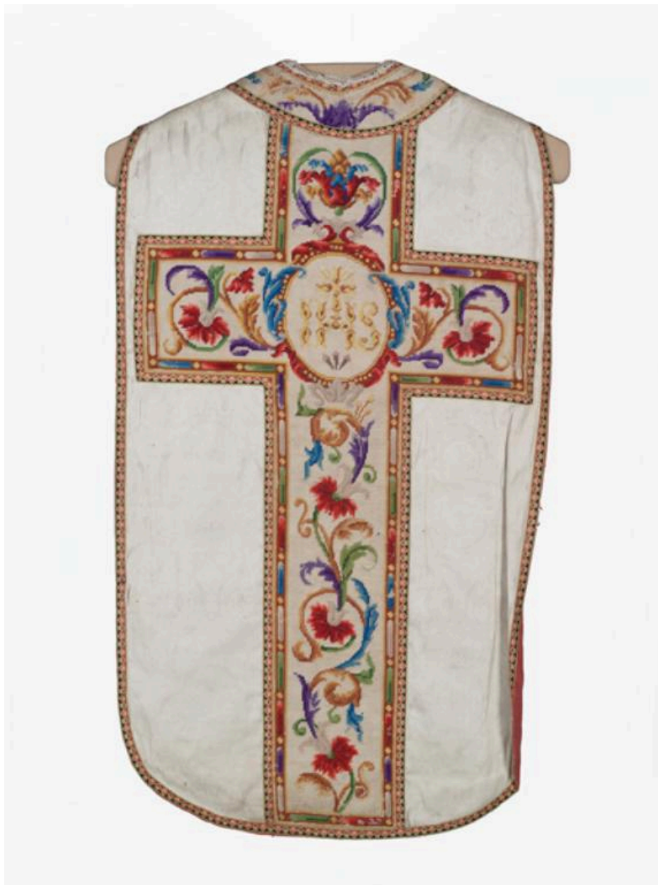
Vue générale du dos de la chasuble.