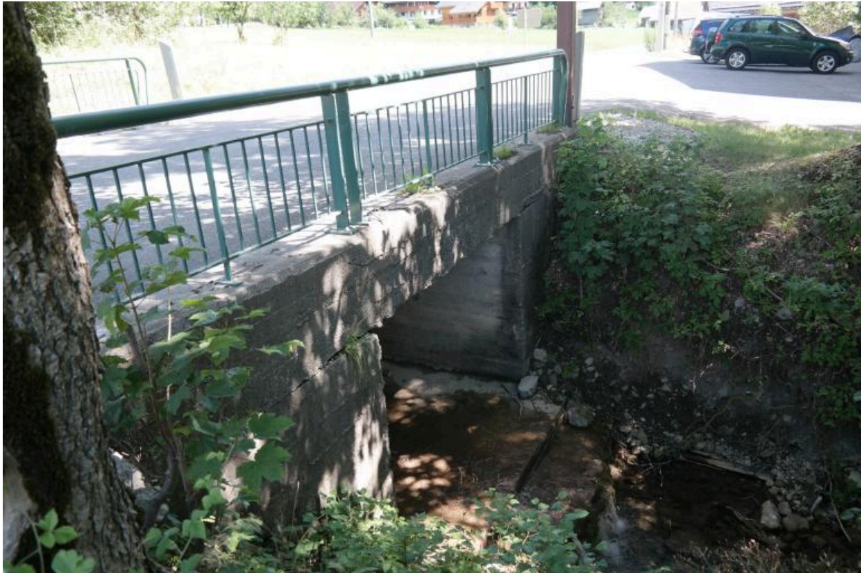
Ponceau de la Pesse, face aval