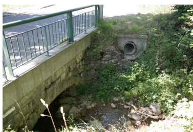
Ponceau de la Pesse, détail de la rambarde et d'une arrivée d'eau