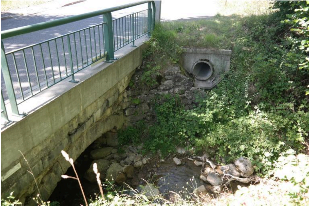
Ponceau de la Pesse, détail de la rambarde et d'une arrivée d'eau