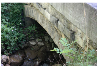
Ponceau de la Pesse, détail de la voûte IVR84_20207400911NUCA