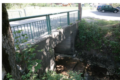
Ponceau de la Pesse, face aval IVR84_20207400910NUCA