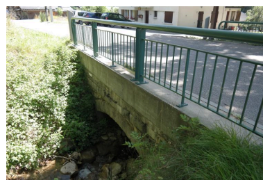
Vue générale du Ponceau de la Pesse IVR84_20197401196NUCA