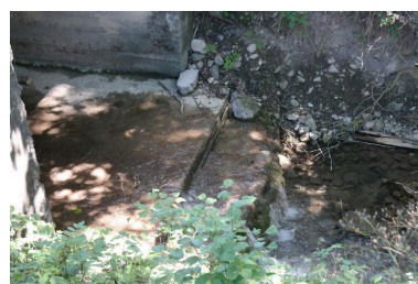
Ponceau de la Pesse, le seuil IVR84_20207400912NUCA