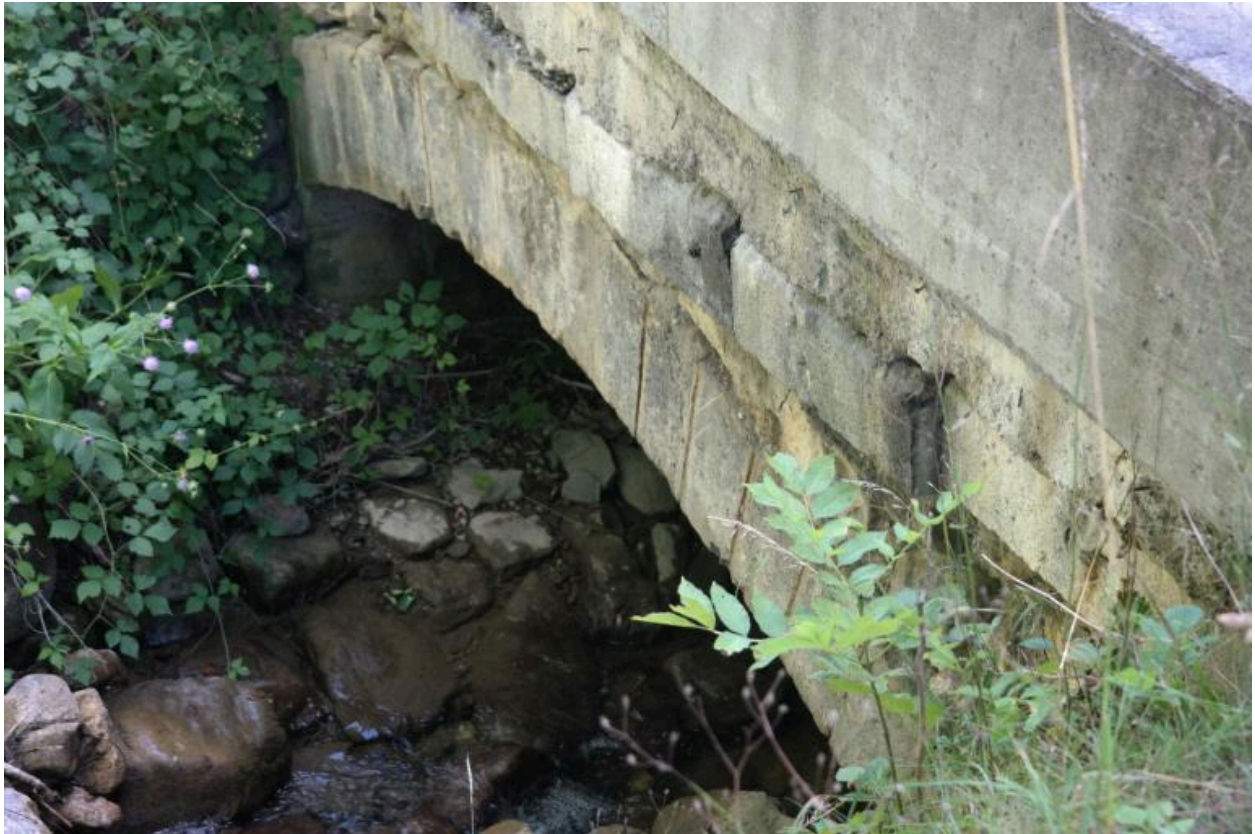
Ponceau de la Pesse, détail de la voûte