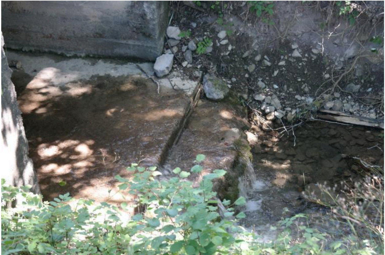
Ponceau de la Pesse, le seuil