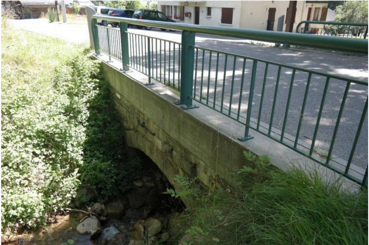
Vue générale du Ponceau de la Pesse