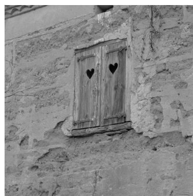
Détail de l'élévation sud : baie du 1er étage.