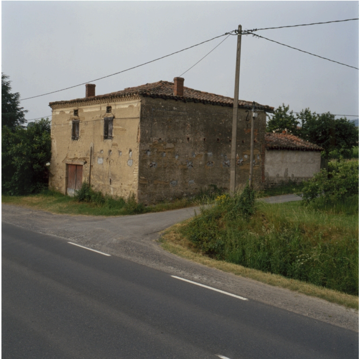
Vue d'ensemble de trois-quarts depuis le nord-est.