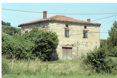
Vue d'ensemble de trois-quarts gauche. IVR82_20004201134ZE