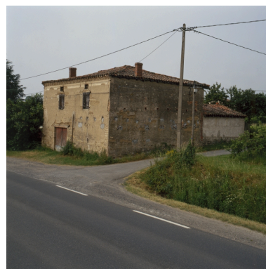
Vue d'ensemble de trois-quarts depuis le nord-est.