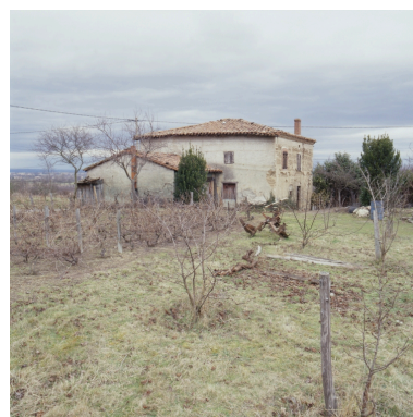
Vue générale de trois-quarts depuis le sud-ouest. IVR82_20024201460XA