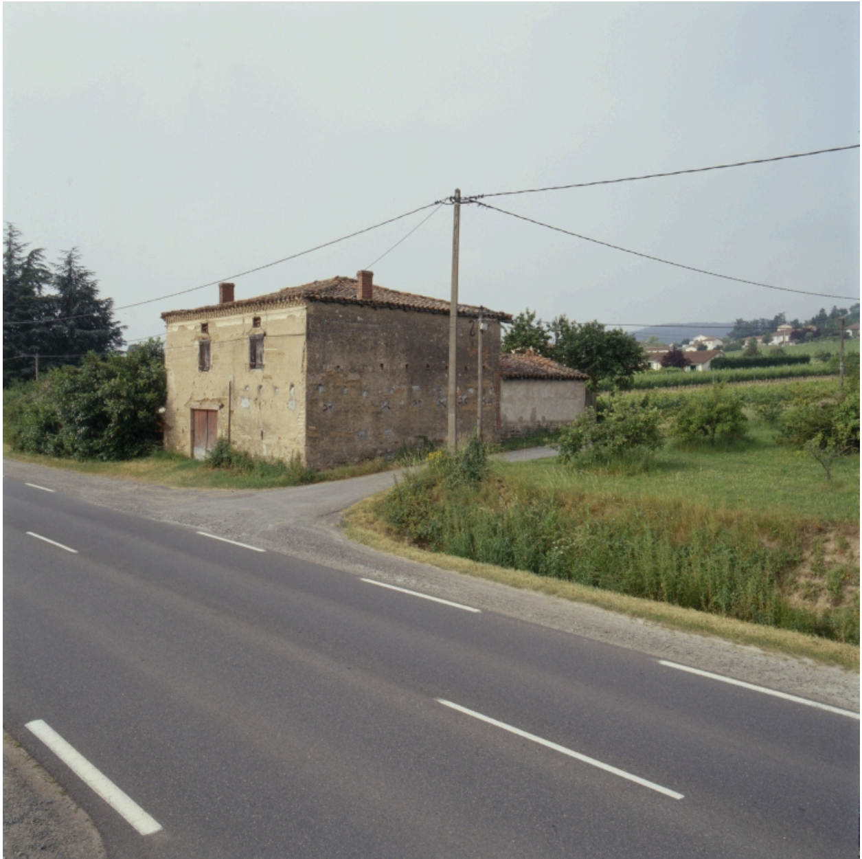
Vue générale de trois-quarts depuis le nord-est.