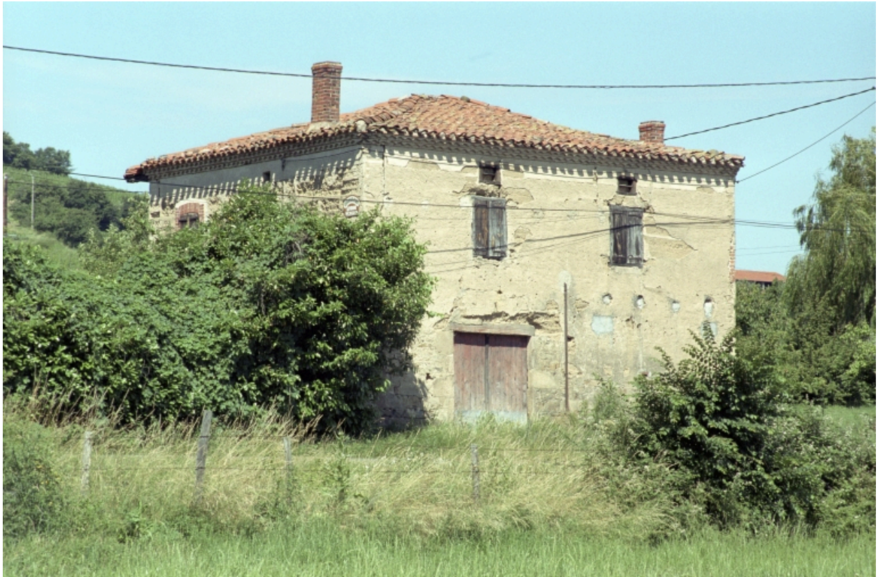
Vue d'ensemble de trois-quarts gauche.