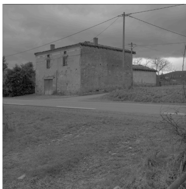
Vue générale de trois-quarts depuis le nord-est. IVR82_20024201458X