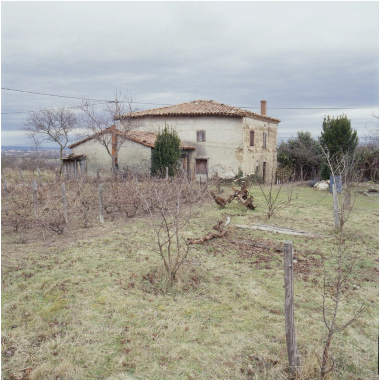
Vue générale de trois-quarts depuis le sud-ouest.