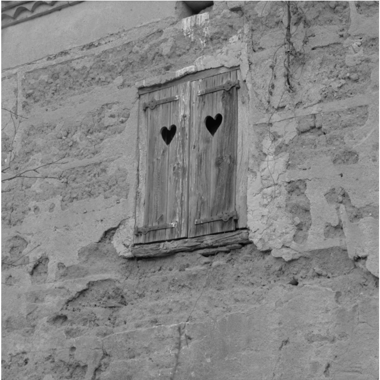
Détail de l'élévation sud : baie du 1er étage.