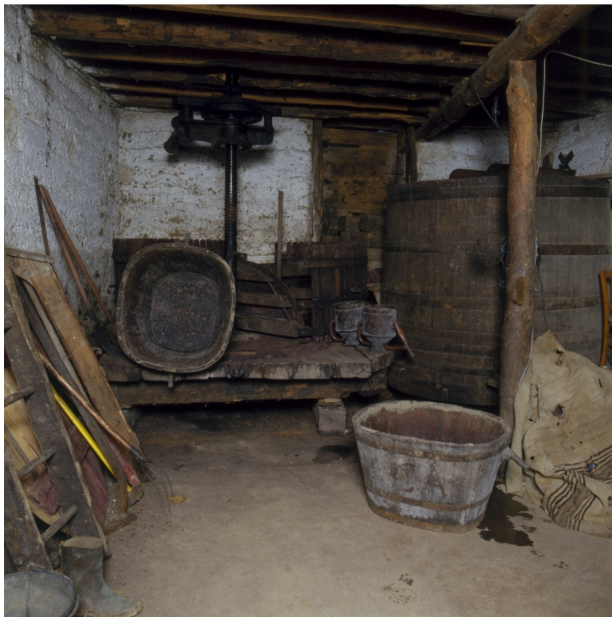
Vue intérieure du rez-de-chaussée : le cuvage.