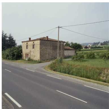
Vue générale de trois-quarts depuis le nord-est. IVR82_20024201594XA