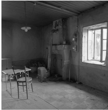
Vue intérieure du 1er étage : la cuisine. IVR82_20024201485X