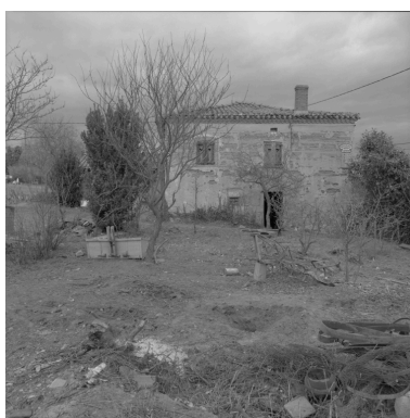
Vue d'ensemble de l'élévation sud.