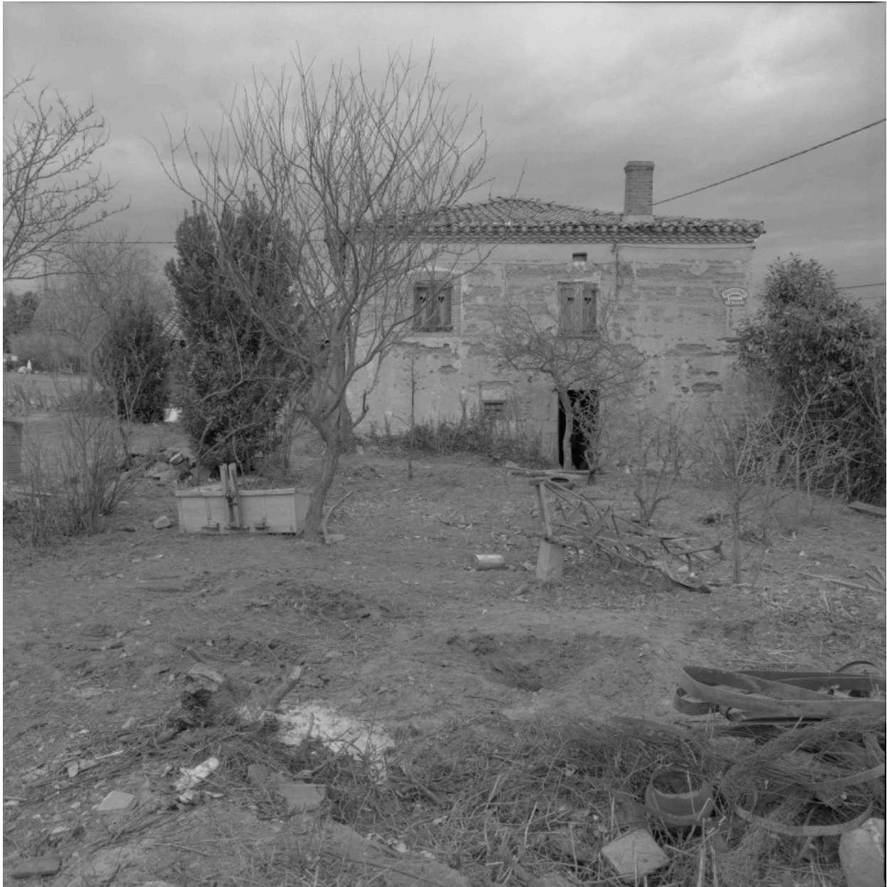
Vue d'ensemble de l'élévation sud.