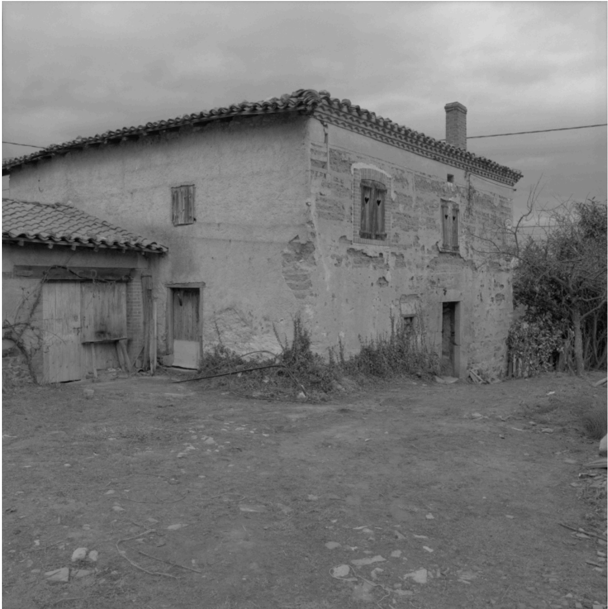
Vue d'ensemble de trois-quarts depuis le sud-ouest.