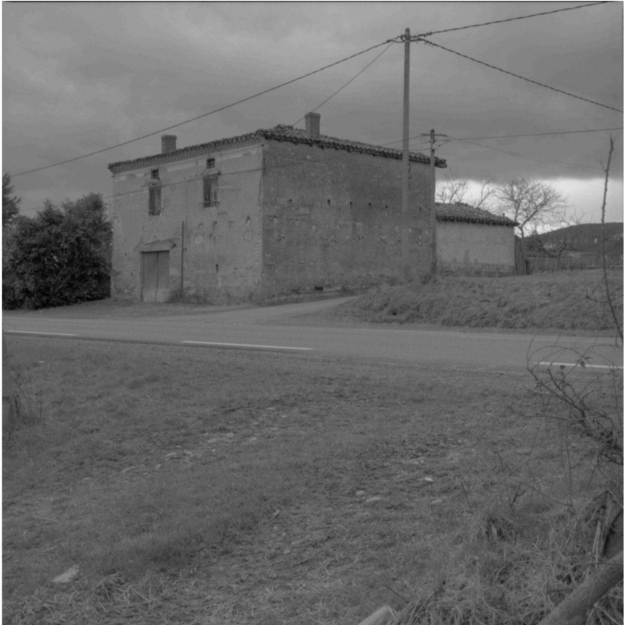
Vue générale de trois-quarts depuis le nord-est.