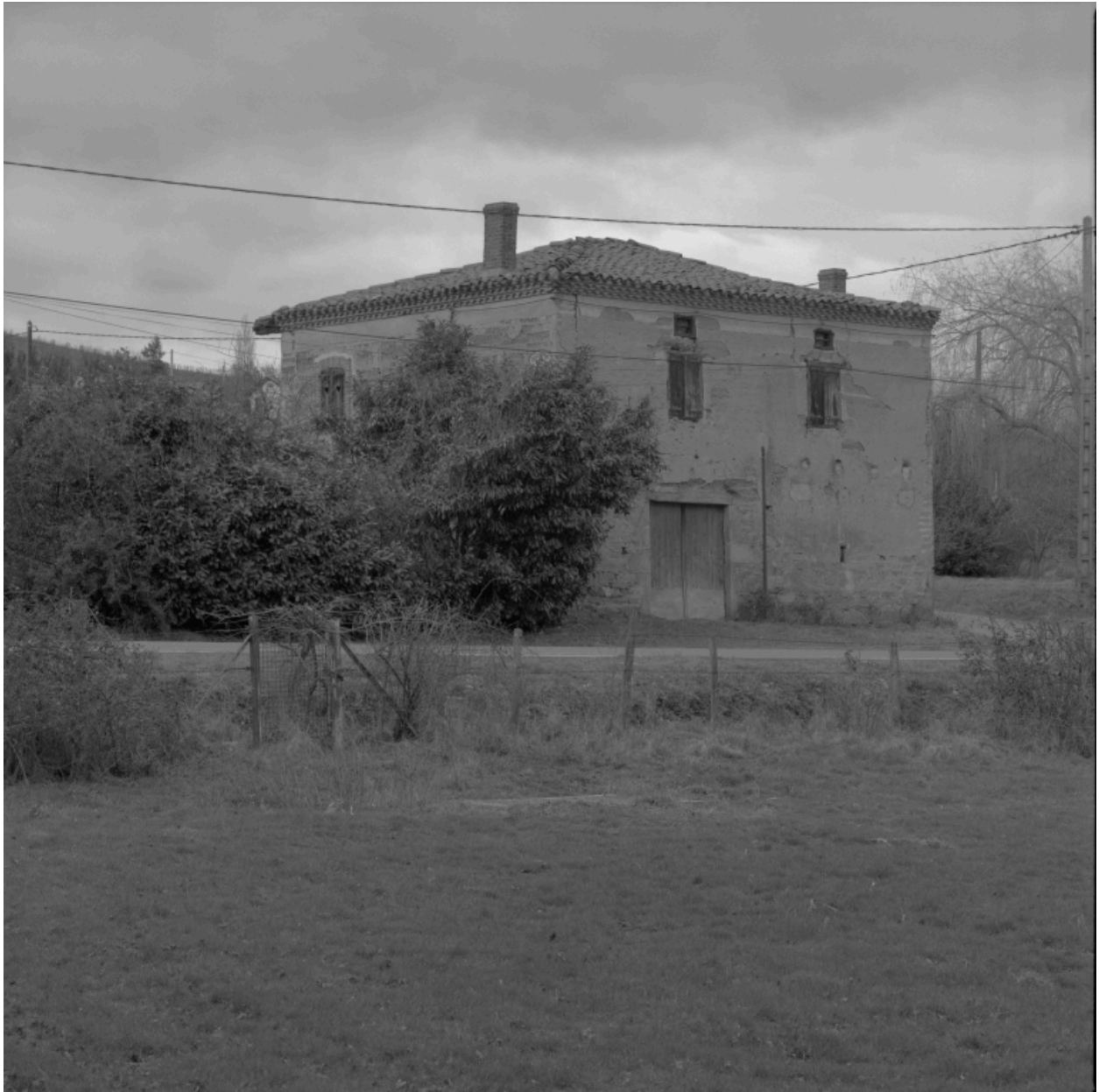
Vue générale de trois-quarts depuis le sud-est.