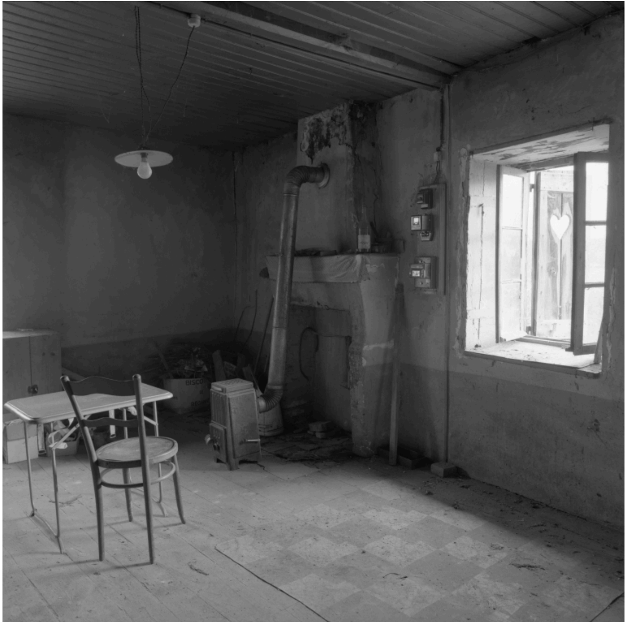
Vue intérieure du 1er étage : la cuisine.