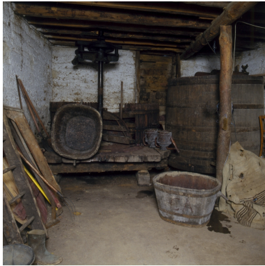
Vue intérieure du rez- de-chaussée : le cuvage.