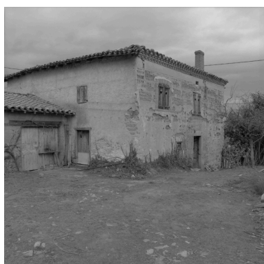
Vue d'ensemble de trois-quarts depuis le sud-ouest.