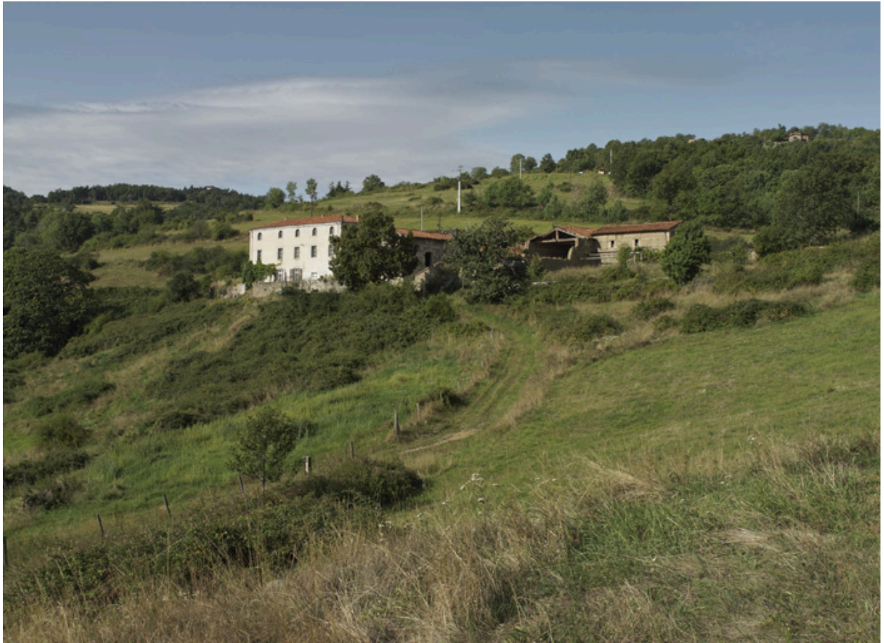
Vue générale depuis l'est.