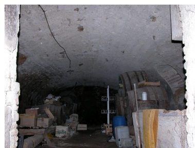
Vue intérieure de la cave. IVR82_20134200859NUCA