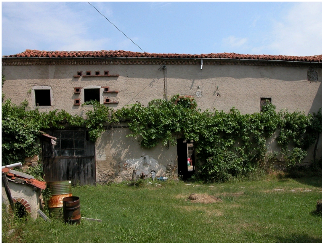
Vue de l'élévation sud du logis du fermier et de la remise-atelier (à l'étage, ouvertures du pigeonnier).