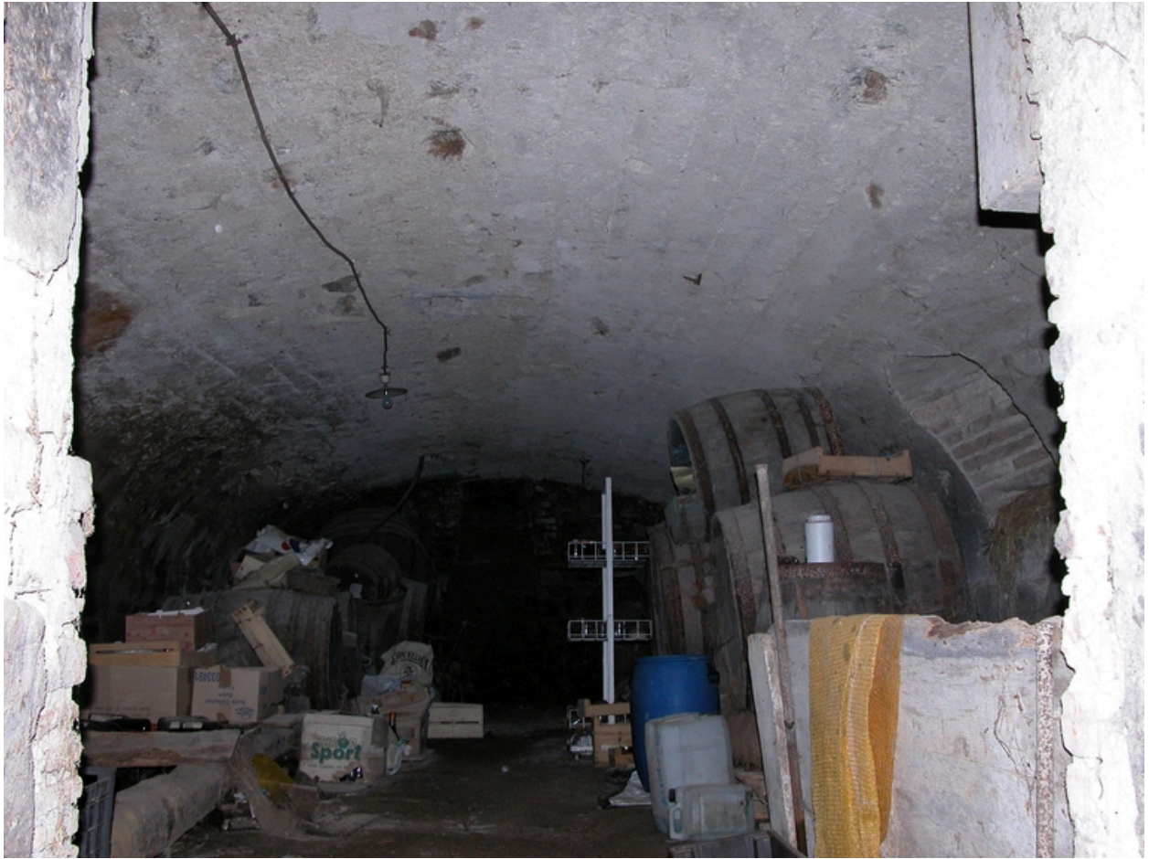
Vue intérieure de la cave.