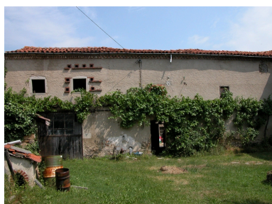
Vue de l'élévation sud du logis du fermier et de la remise-atelier (à l'étage, ouvertures du pigeonnier).