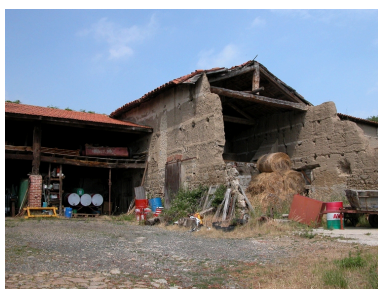
Vue de la remise ouverte et de la grange-étable, depuis le sud-est.