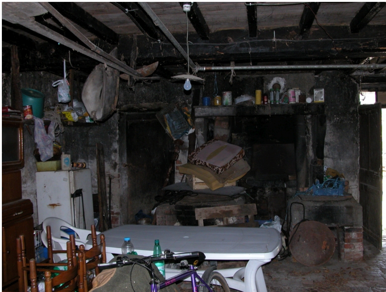
Vue intérieure de la cuisine : cheminée avec four à pain et chaudières.