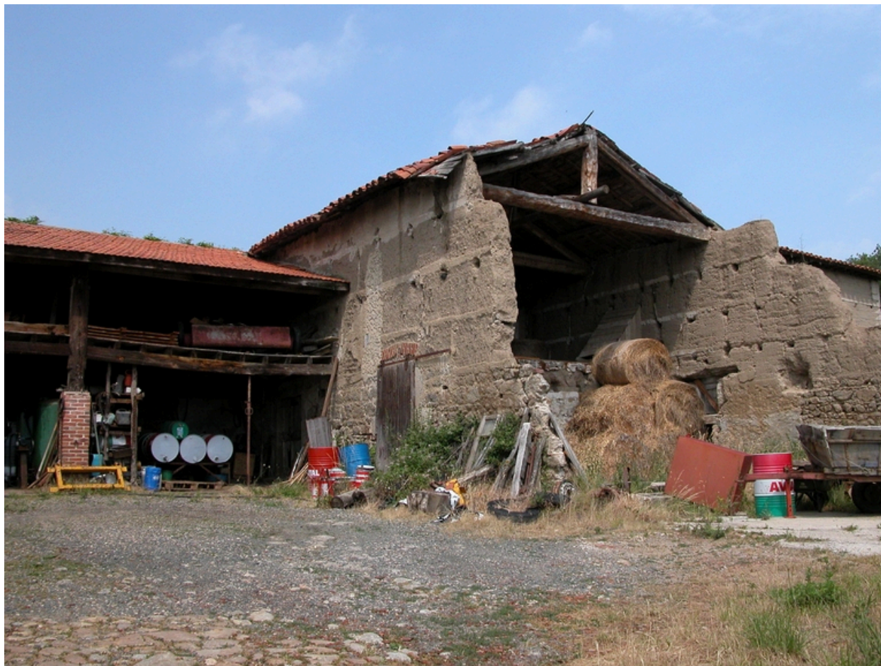
Vue de la remise ouverte et de la grange-étable, depuis le sud-est.