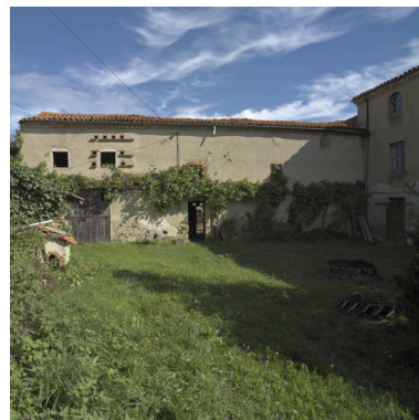
Vue de l'élévation sud du bâtiment sud, depuis la cour de la demeure.