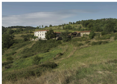
Vue générale depuis l'est.