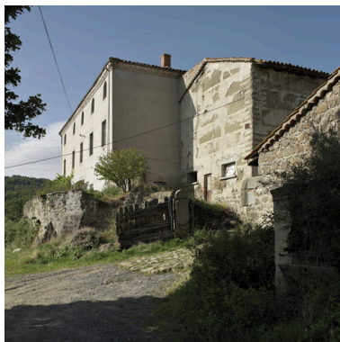
Vue depuis le nord-est (articulation avec la demeure). IVR82_20064202098NUCA