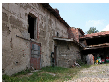
Vue de l'étable, du logis du fermier (édicule en moellon de granite en saillie : évier) et remise ouverte en retour, depuis le nord-est. IVR82_20134200861NUCA