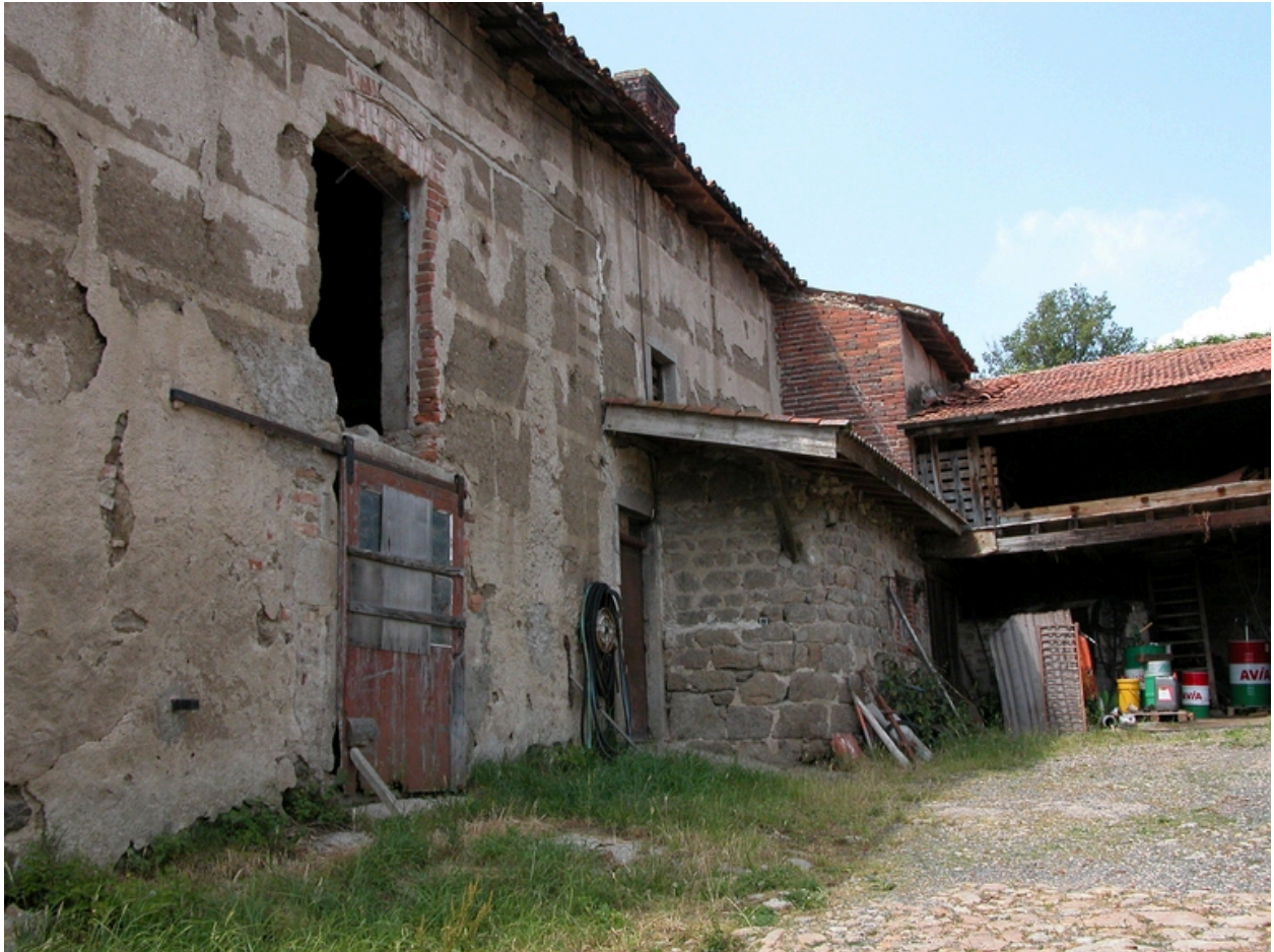
Vue de l'étable, du logis du fermier (édicule en moellon de granite en saillie : évier) et remise ouverte en retour, depuis le nord-est.