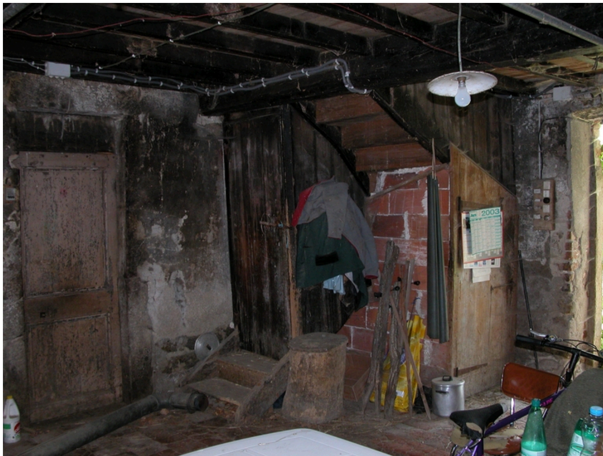
Vue intérieure de la cuisine : escalier, porte de communication avec l'étable.