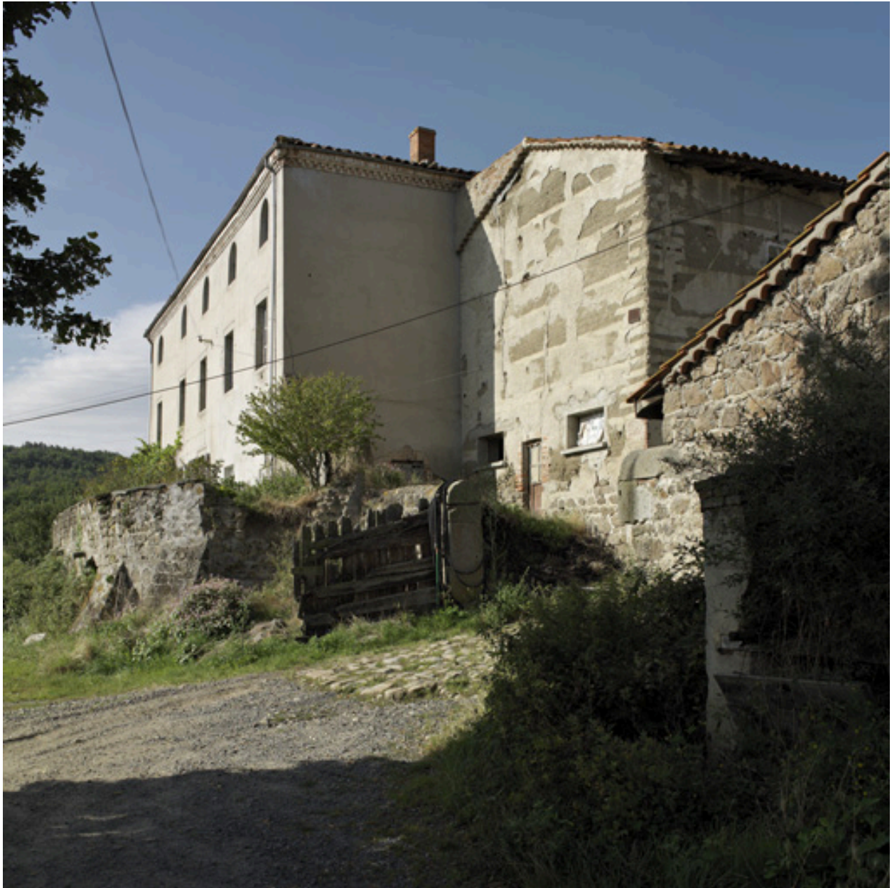
Vue depuis le nord-est (articulation avec la demeure).