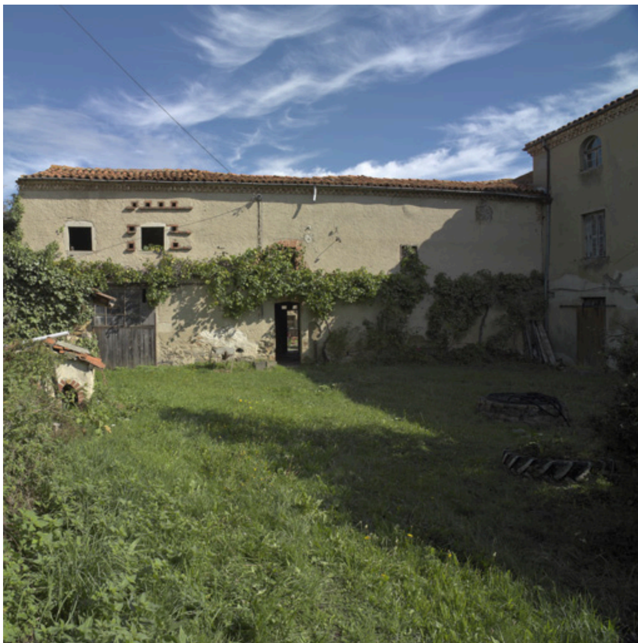
Vue de l'élévation sud du bâtiment sud, depuis la cour de la demeure.