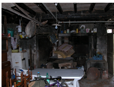
Vue intérieure de la cuisine : cheminée avec four à pain et chaudières.