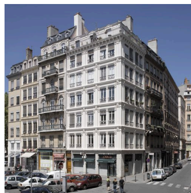
Vue générale des façades depuis la place d'Albon IVR82_20056901557NUCA