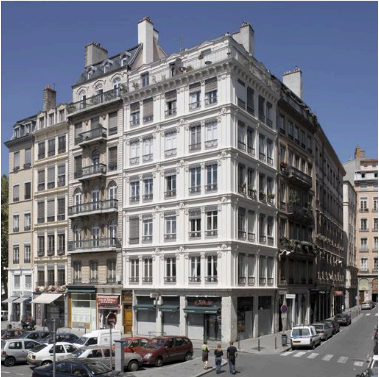
Vue générale des façades depuis la place d'Albon