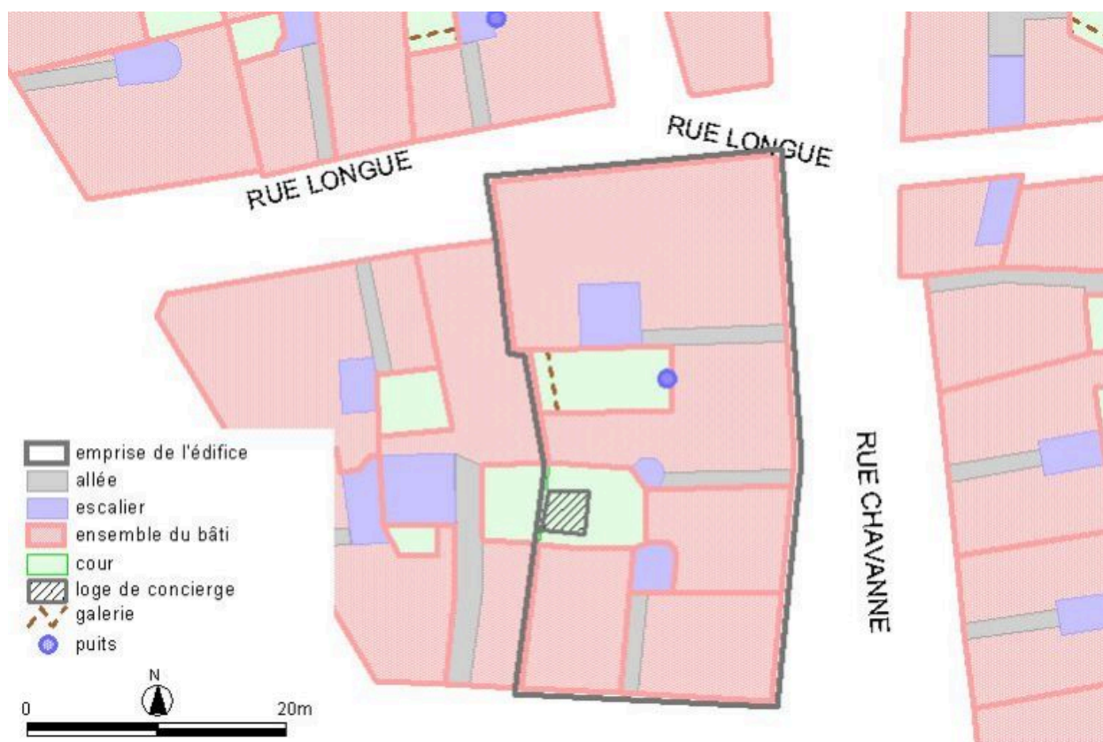
Plan-masse, d'après le système urbain de référence, version 1999