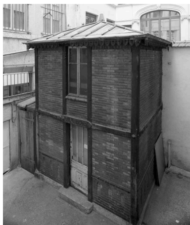
Cour commune, ancienne loge de conciergerie IVR82_20056901569NUC