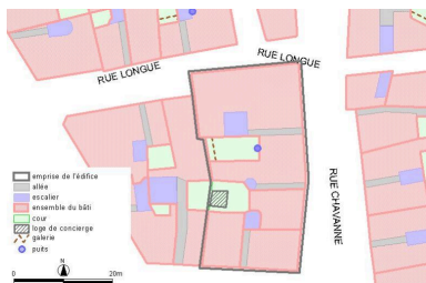
Plan-masse, d'après le système urbain de référence, version 1999 IVR82_20056902716NUDA