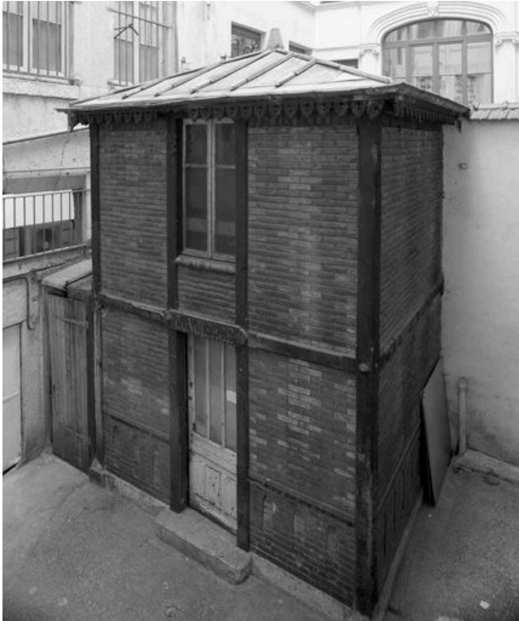
Cour commune, ancienne loge de concierge