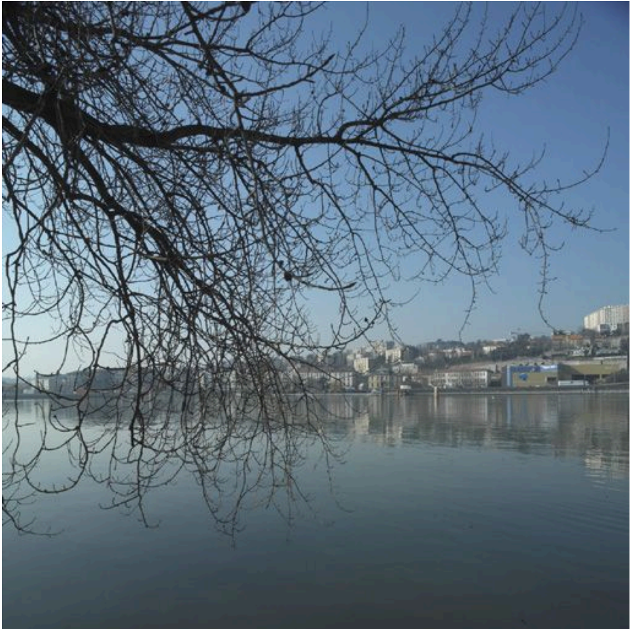
Vue du Rhône et de La Mulatière vers le sud, depuis la rive droite du fleuve