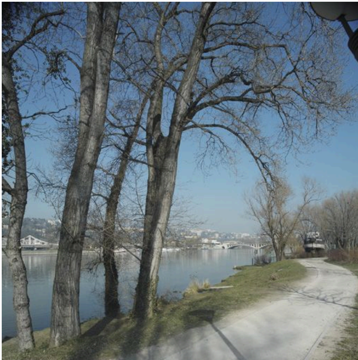
Vue du Rhône depuis Gerland, au sud, rive droite