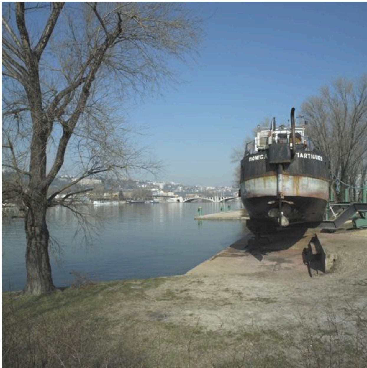
Rive droite du Rhône : cale à bateau à hauteur de Gerland