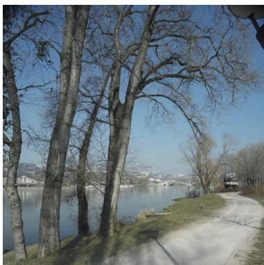
Vue du Rhône depuis Gerland, au sud, rive droite