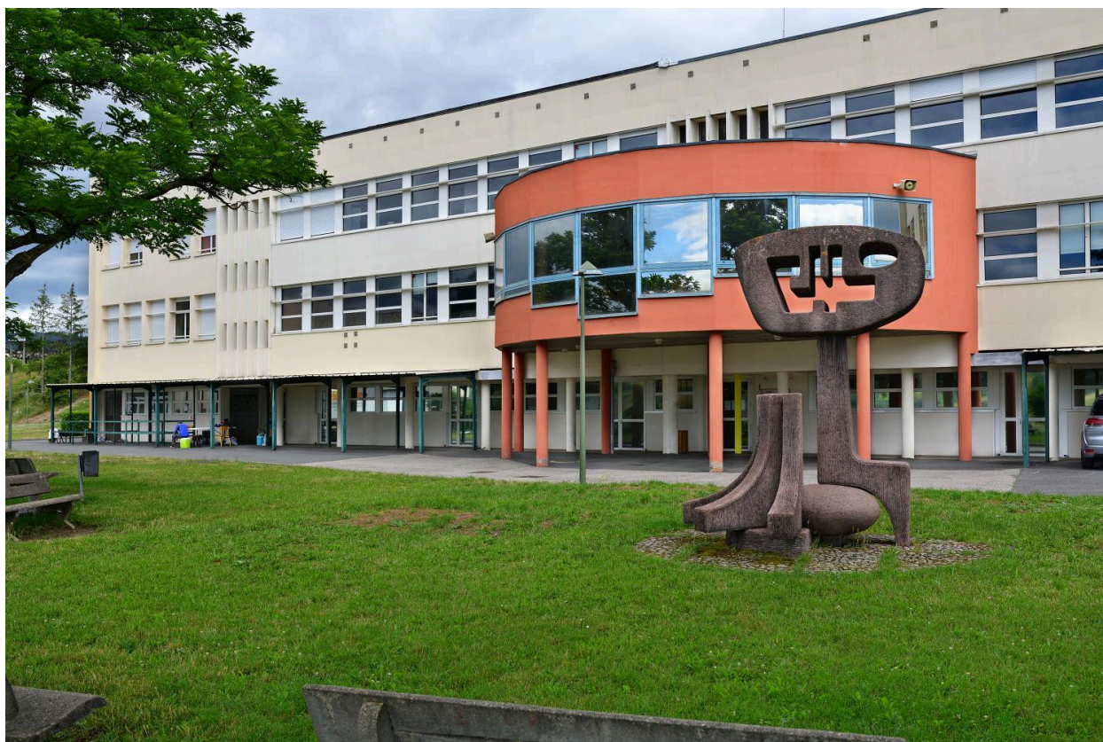
L'oeuvre dans son environnement proche