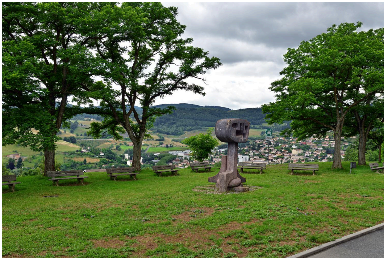
L'oeuvre dans son environnement