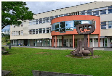
L'oeuvre dans son environnement proche IVR84_20216900728NUCAQ