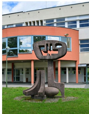
Vue de face IVR84_20216900725NUCAQ