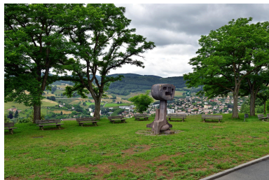
L'oeuvre dans son environnement IVR84_20216900737NUCAQ