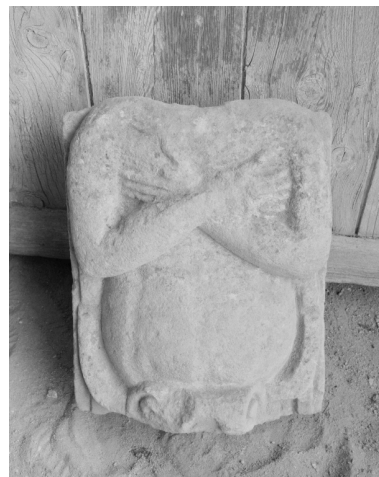
Fragment de cariatide engainée de provenance indéterminée. IVR82_19982600759X