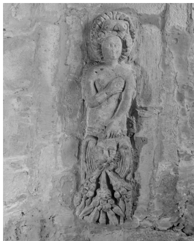
Poterne ouest. Cariatide engainée (n° 1) rapportée à la clé du passage voûté.