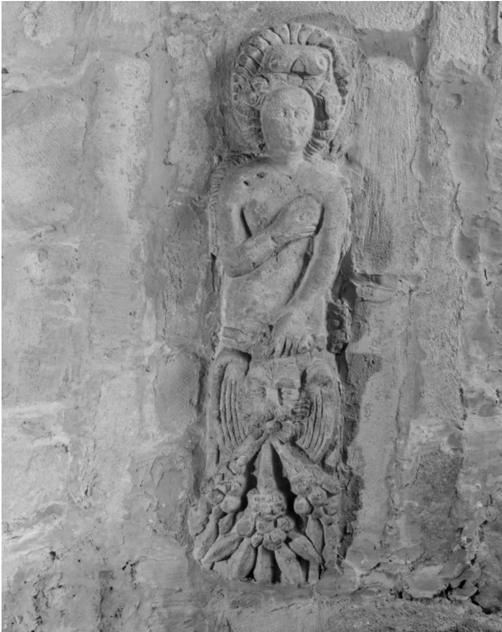
Poterne ouest. Cariatide engainée (n° 1) rapportée à la clé du passage voûté.