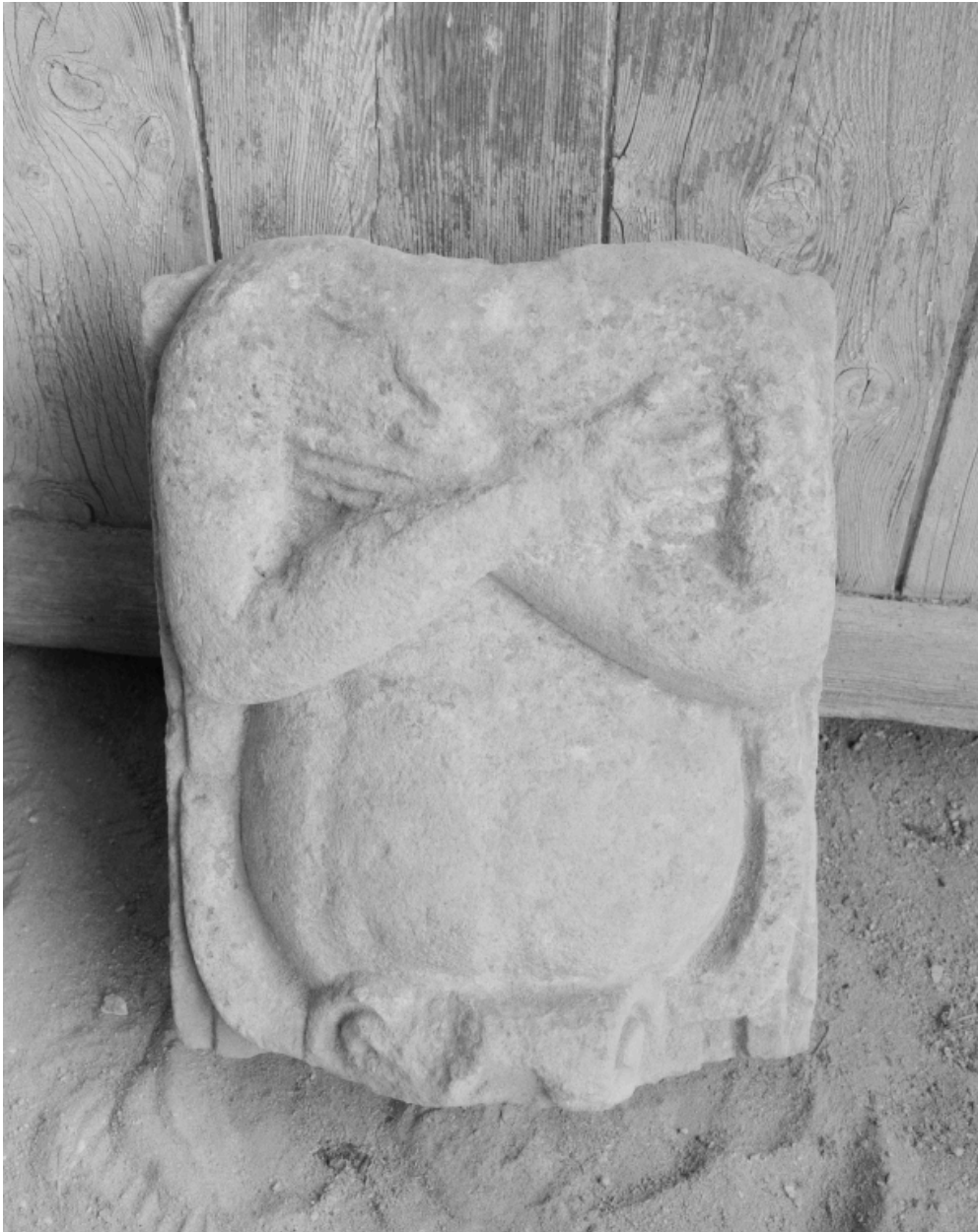
Fragment de cariatide engainée de provenance indéterminée.