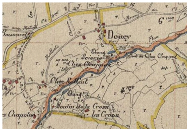
Tableau d'assemblage du cadastre de la commune de Thorens- les-Glières. Plan. Archives départementales de la Haute- Savoie 3P3/ 8697 IVR82_20107400253NUCA