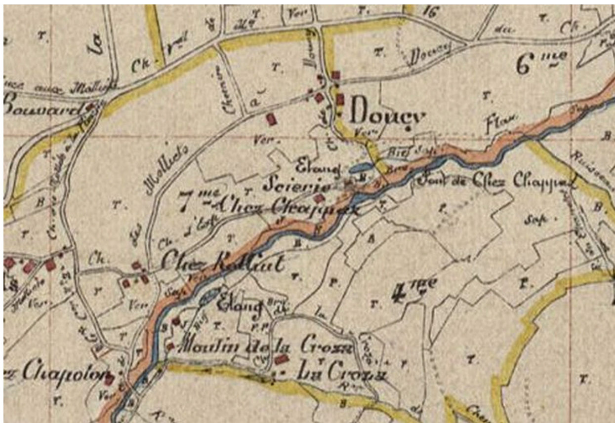
Tableau d'assemblage du cadastre de la commune de Thorens-les-Glières. Plan. 3P3/ 8697