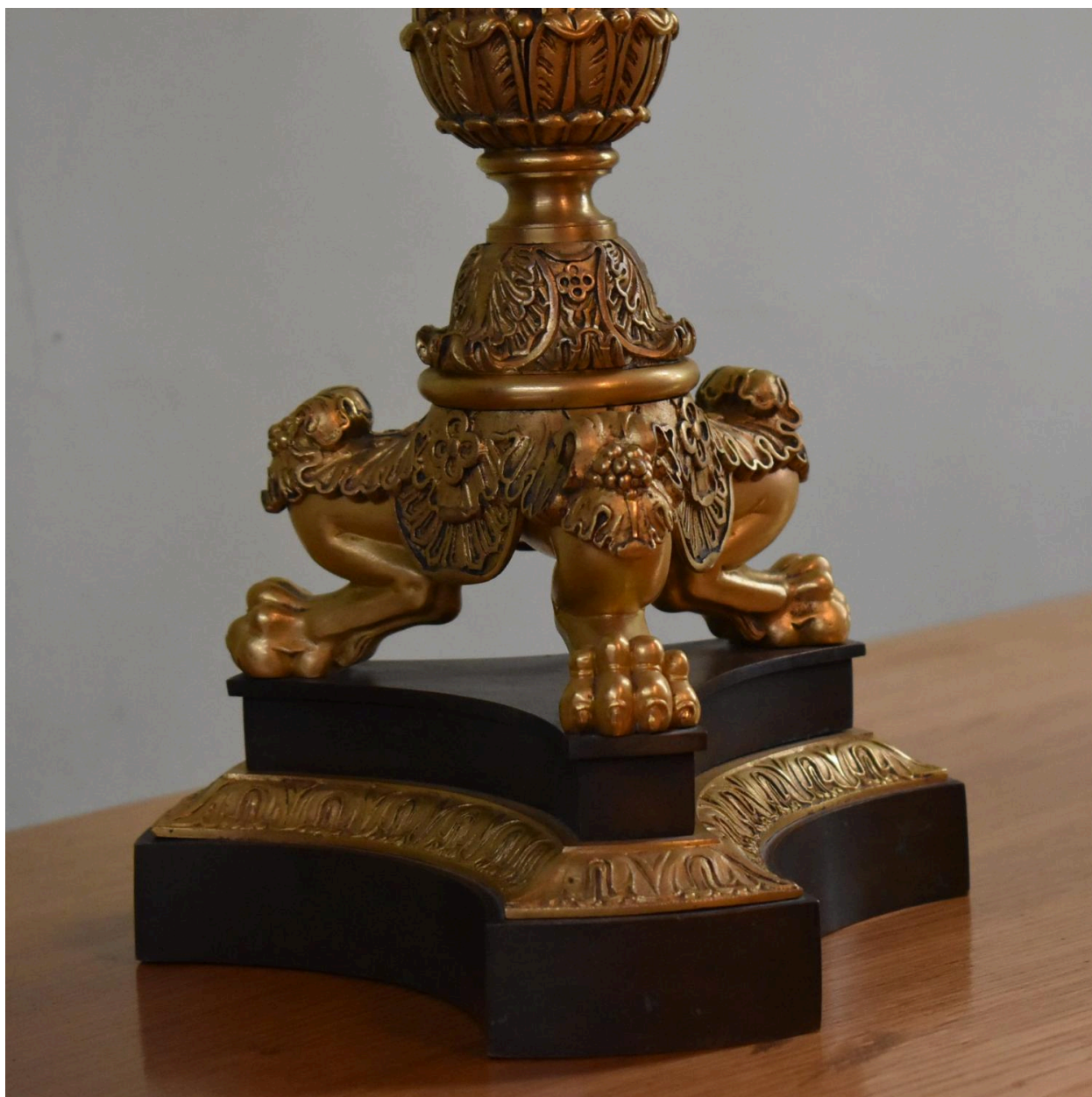
Détail - pied