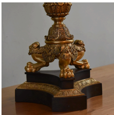
Détail - pied IVR84_20216301095NUCA