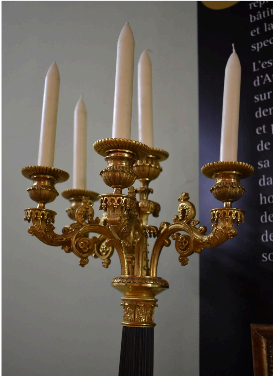
Détail - bras de lumière