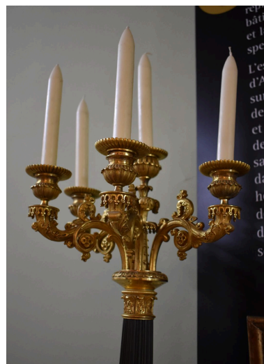
Détail - bras de lumière IVR84_20216301096NUCA