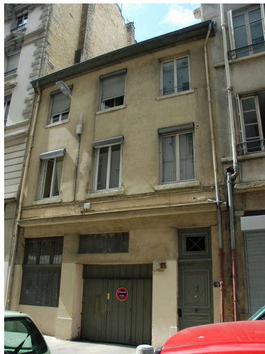
Maison, élévation sur rue IVR82_20126901046NUCA