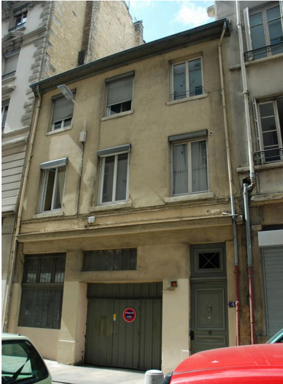
Maison, élévation sur rue