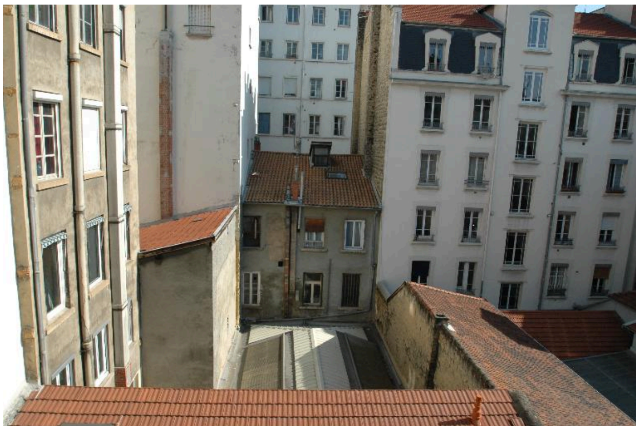
Maison et atelier, vue depuis l'arrière