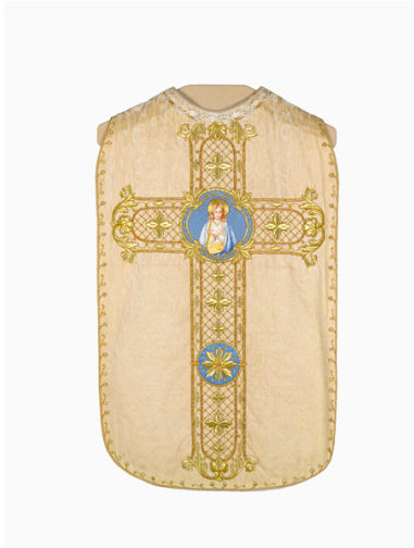
Vue générale du dos de la chasuble. IVR83_20126300204NUC4A