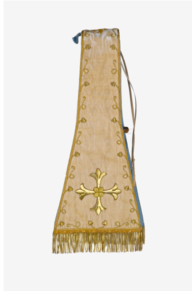
Vue générale. IVR83_20126300206NUC4A