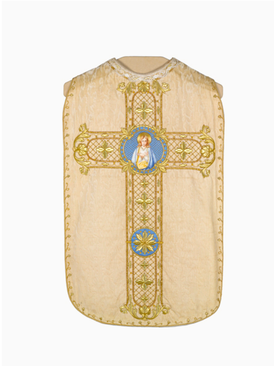
Vue générale du dos de la chasuble.