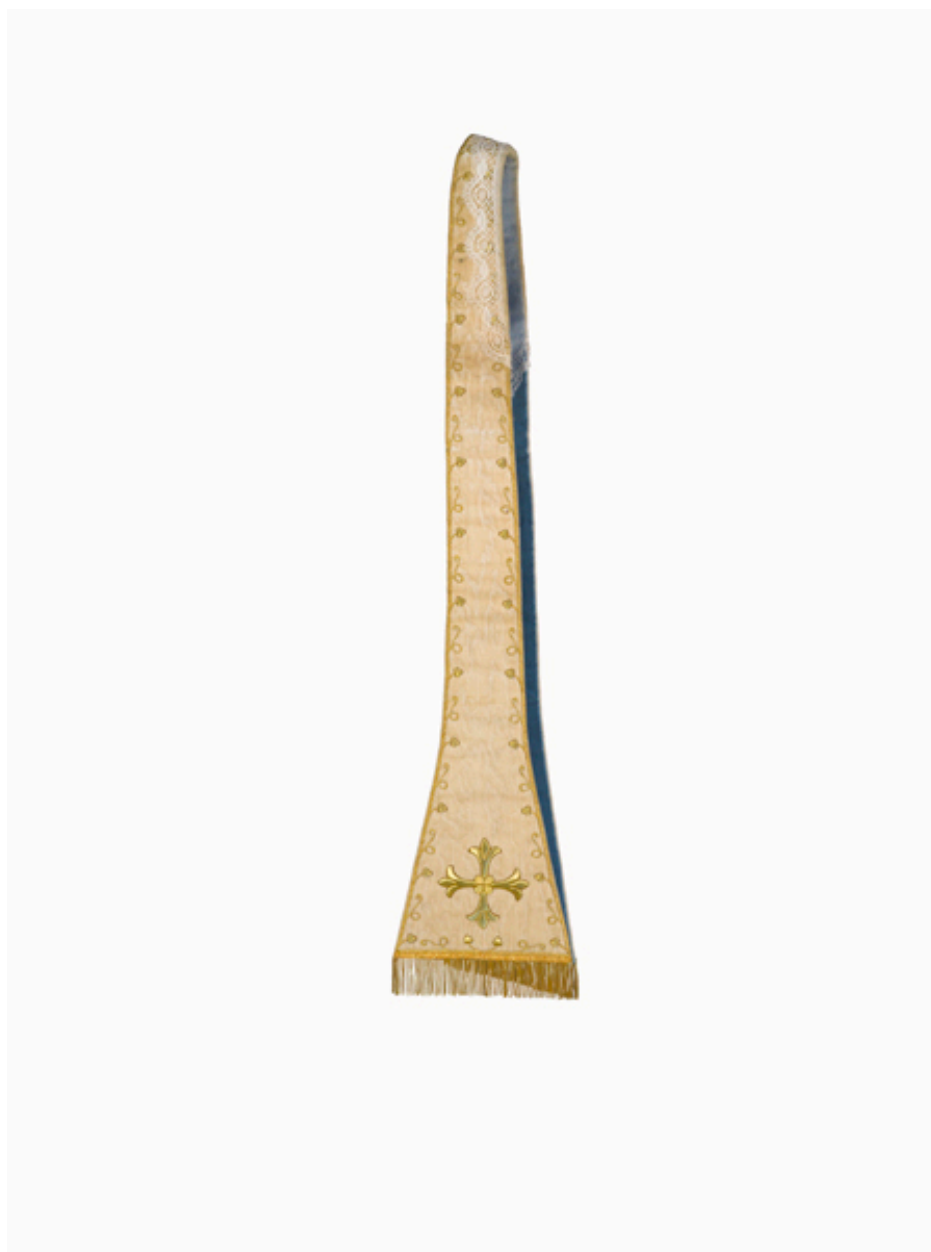
Vue générale de l'étole.