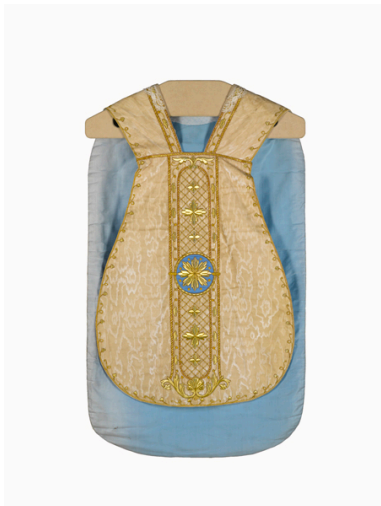
Vue générale de la chasuble : devant.