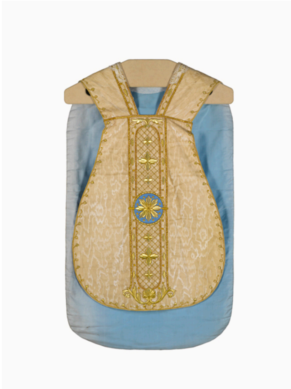
Vue générale de la chasuble : devant.