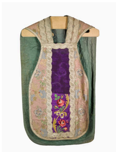
vue générale du devant de la chasuble