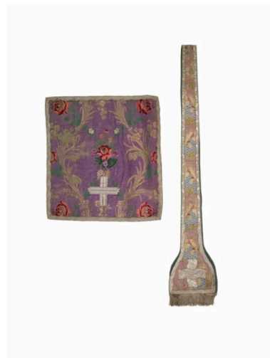
vue de l'étole et du voile de calice