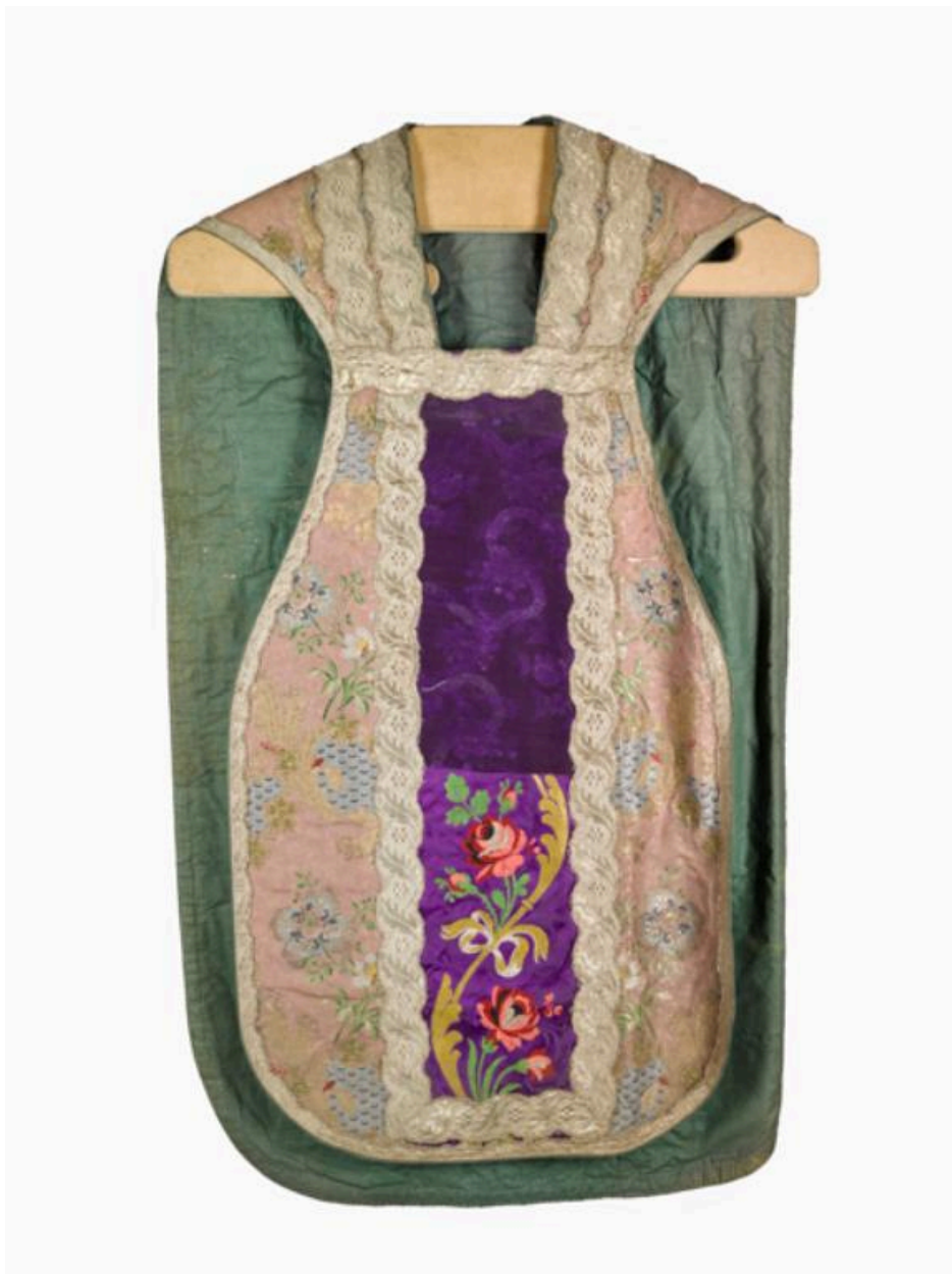
vue générale du devant de la chasuble