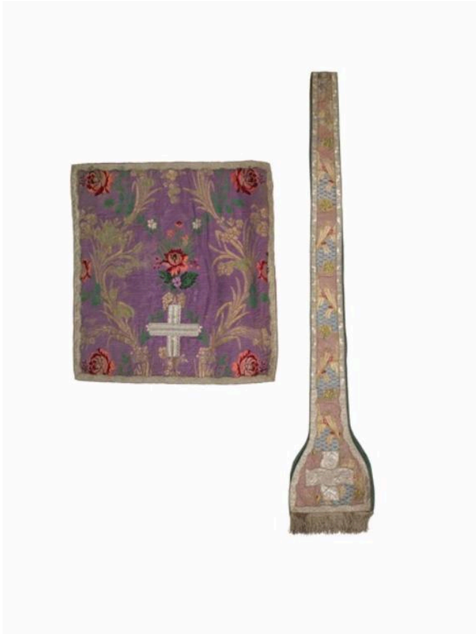
vue de l'étole et du voile de calice