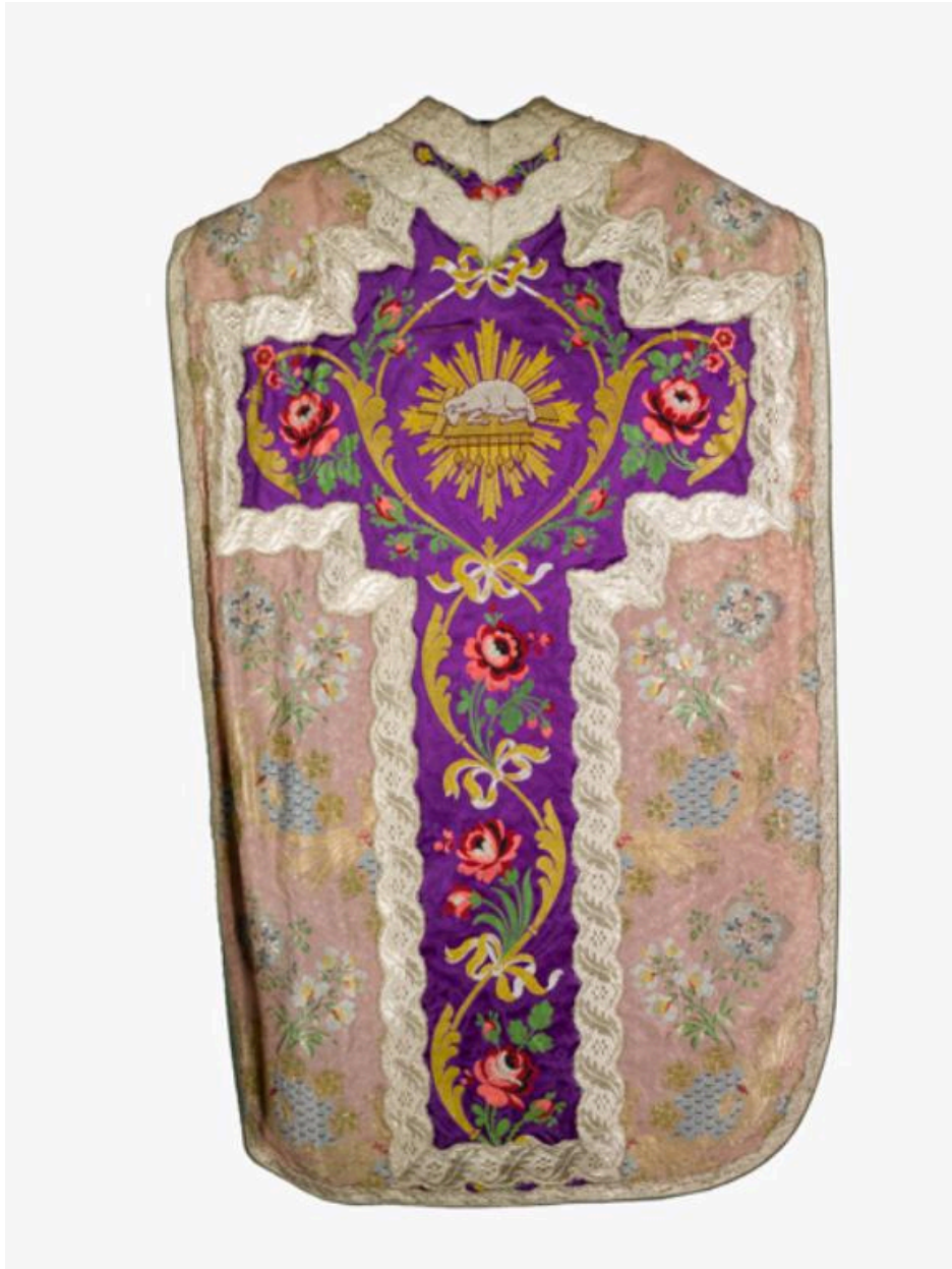
vue générale du dos de la chasuble