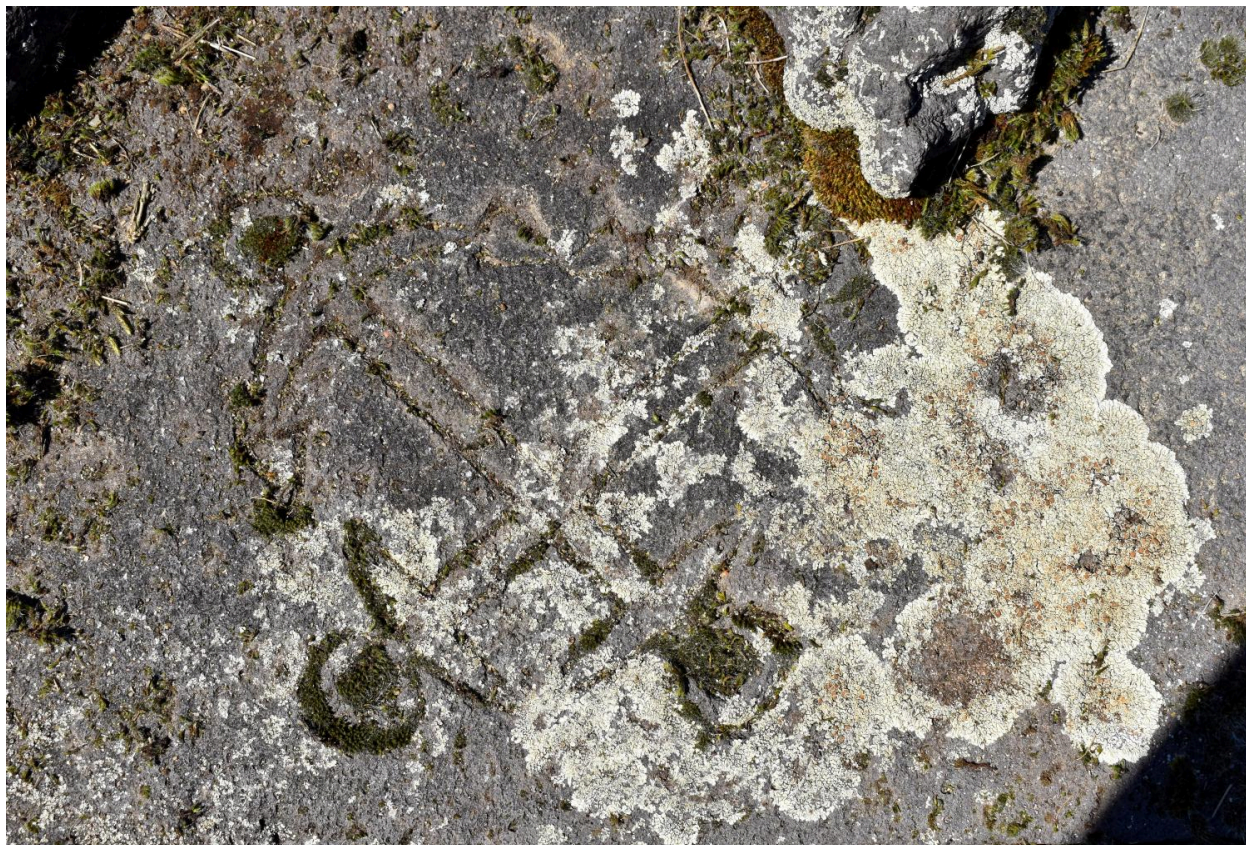
Vue de détail : ancres marines.