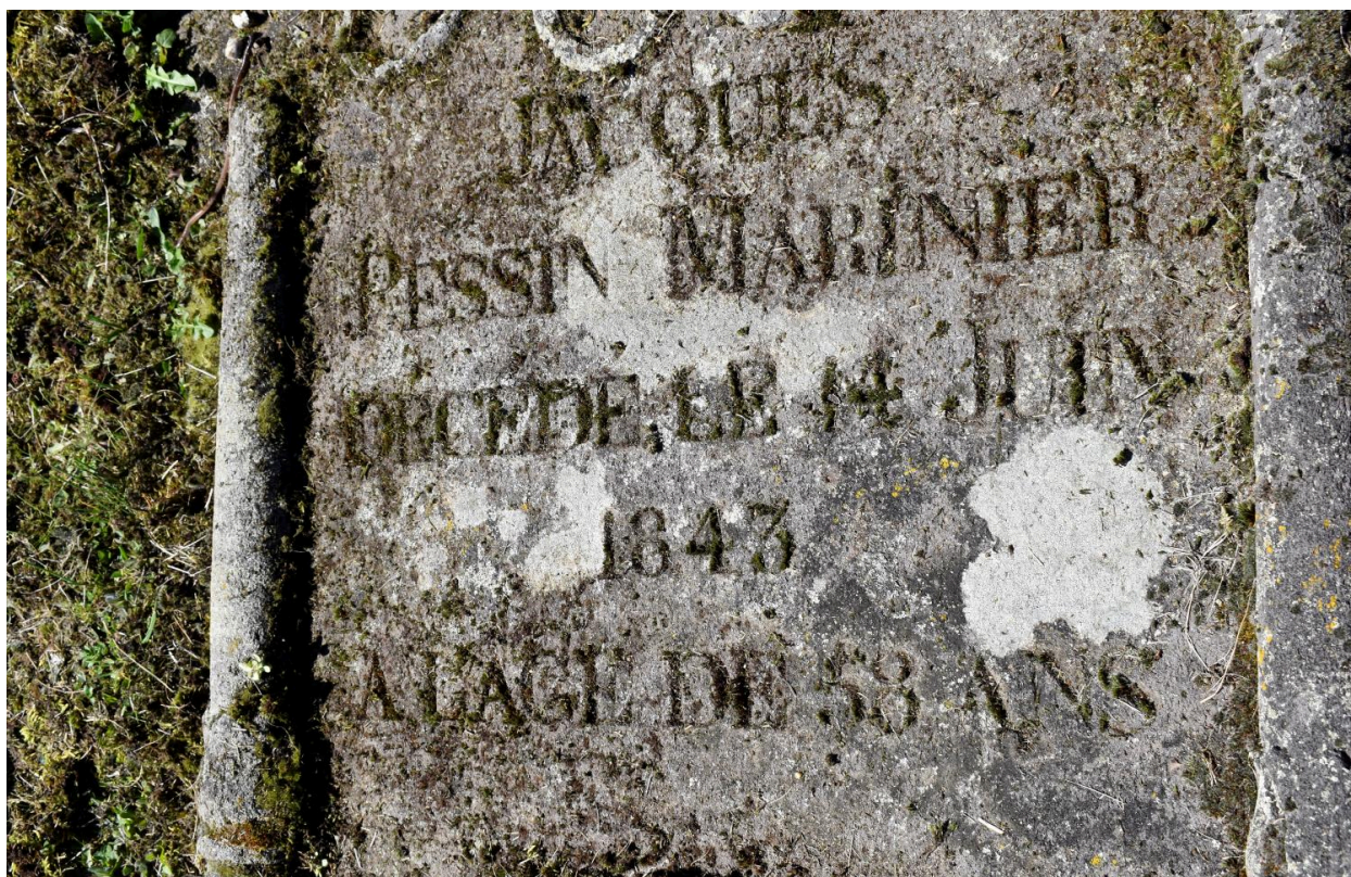
Détail de l'épithaphe.