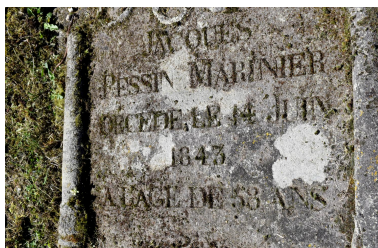
Détail de l'épithaphe. IVR84_20230300533NUC4A