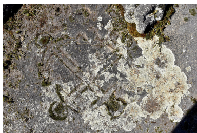
Vue de détail : ancres marines. IVR84_20230300531NUC4A