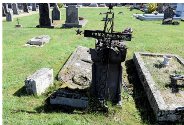
Détail de la croix de fer forgé et découpé.