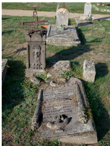
Vue générale de la tombe. IVR84_20230300383NUC4A