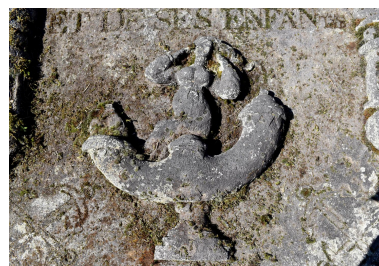
Vue de détail, sculpture de sirène sur une ancre. IVR84_20230300530NUC4A