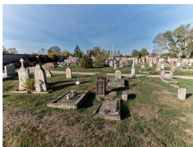
Vue générale de l'emplacement de la tombe dans le cimetière. IVR84_20230300384NUC4A