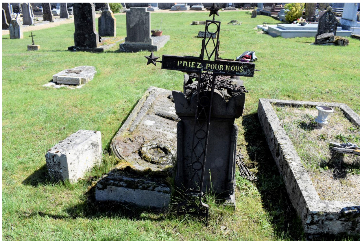
Détail de la croix de fer forgé et découpé.