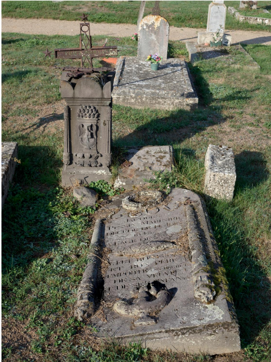
Vue générale de la tombe.