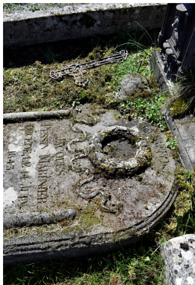
Détail de la couronne mortuaire.