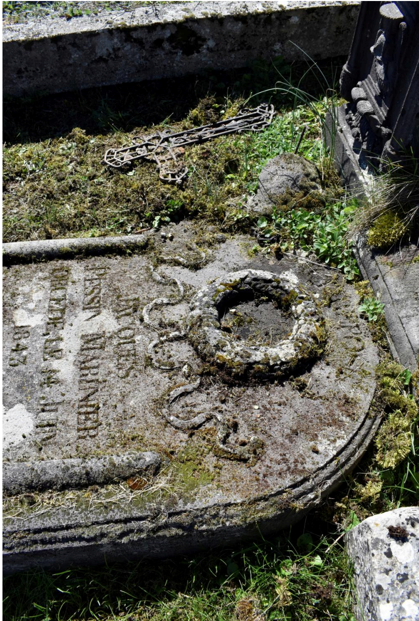
Détail de la couronne mortuaire.