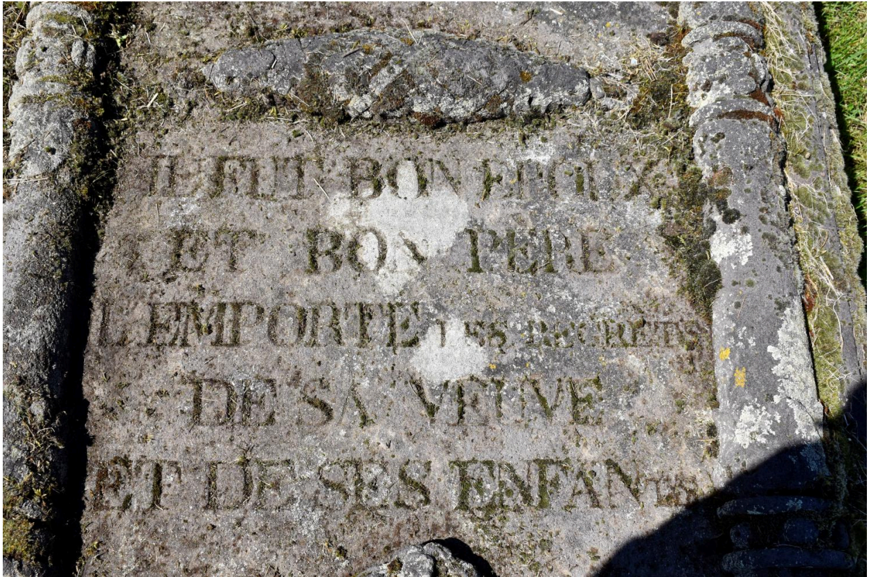
Détail de l'épitaphe.