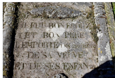
Détail de l'épithaphe. IVR84_20230300532NUC4A