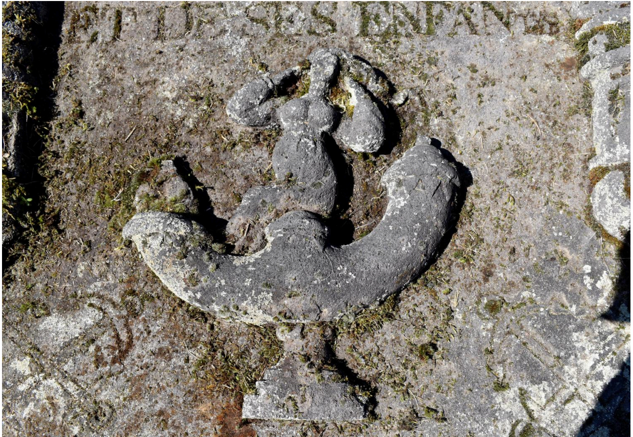
Vue de détail, sculpture de sirène sur une ancre.