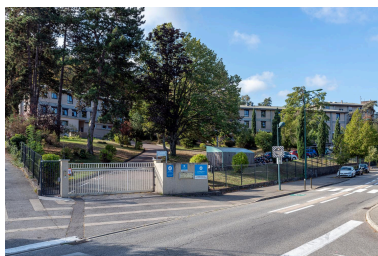
Vue d'ensemble. IVR84_20200700050NUCA