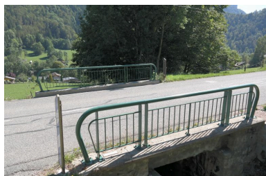
Pont du Borgel, vue de la chaussée et des garde-corps IVR84_20207401507NUCA