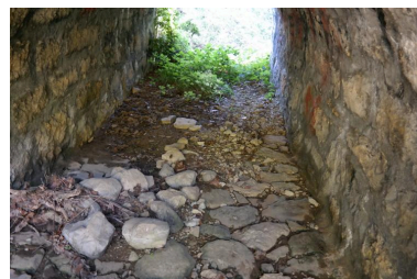
Pont du Borgel, vue du lit du cours d'eau sous le pont