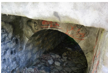
Pont du Borgel, détail de la voûte en face amont