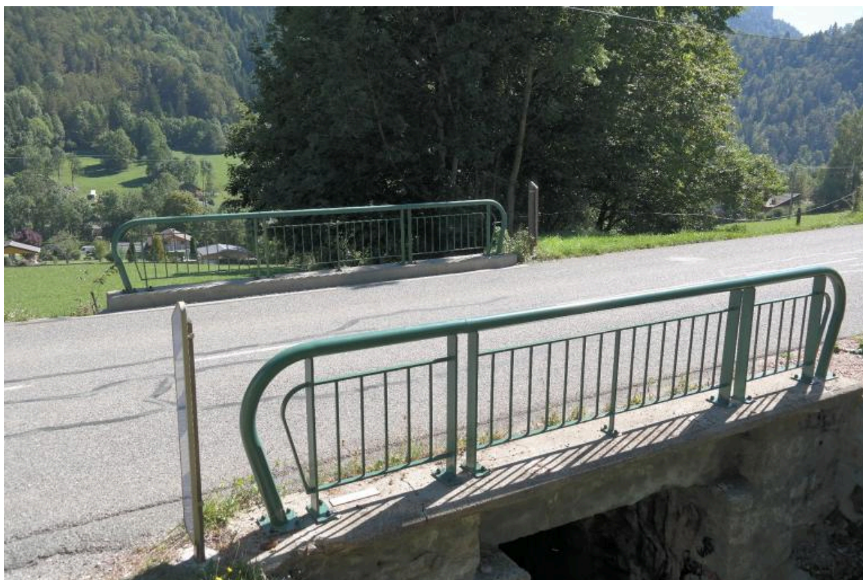
Pont du Borgel, vue de la chaussée et des garde-corps