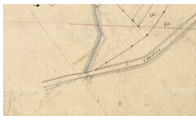
Extrait de la section E Feuille n°1 du cadastre de Bellevaux, 1874. IVR84_20207401505NUCA