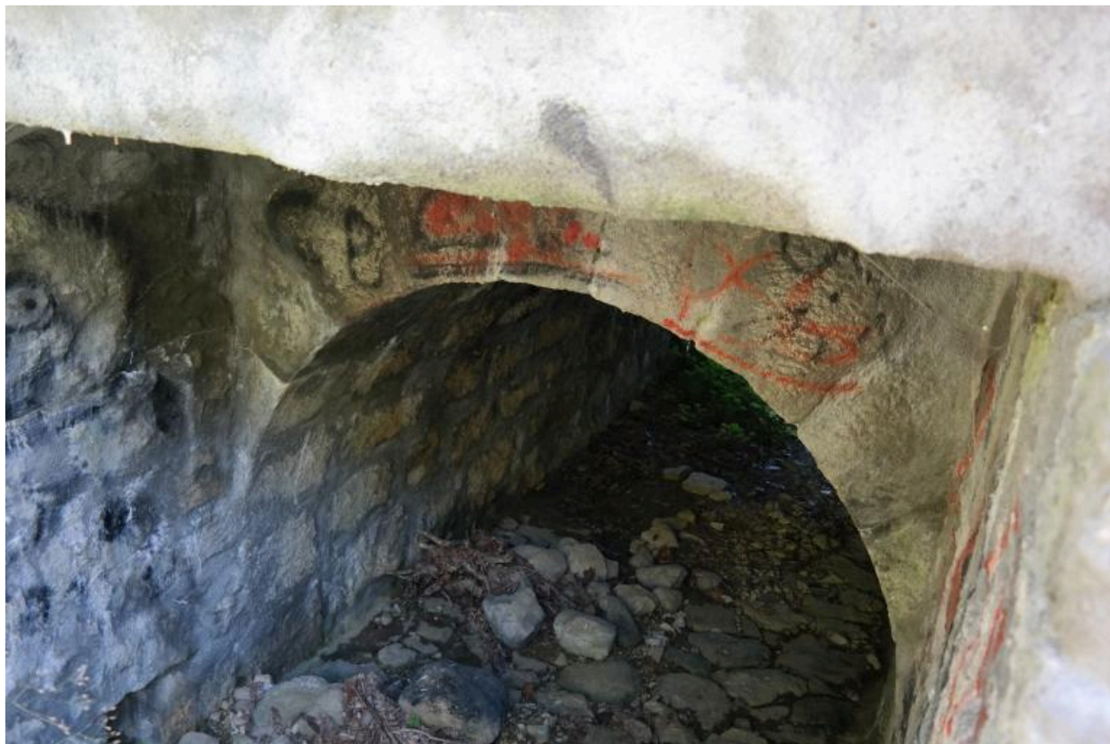
Pont du Borgel, détail de la voûte en face amont