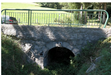
PONT du Borgel, vue de la face aval IVR84_20197401234NUCA