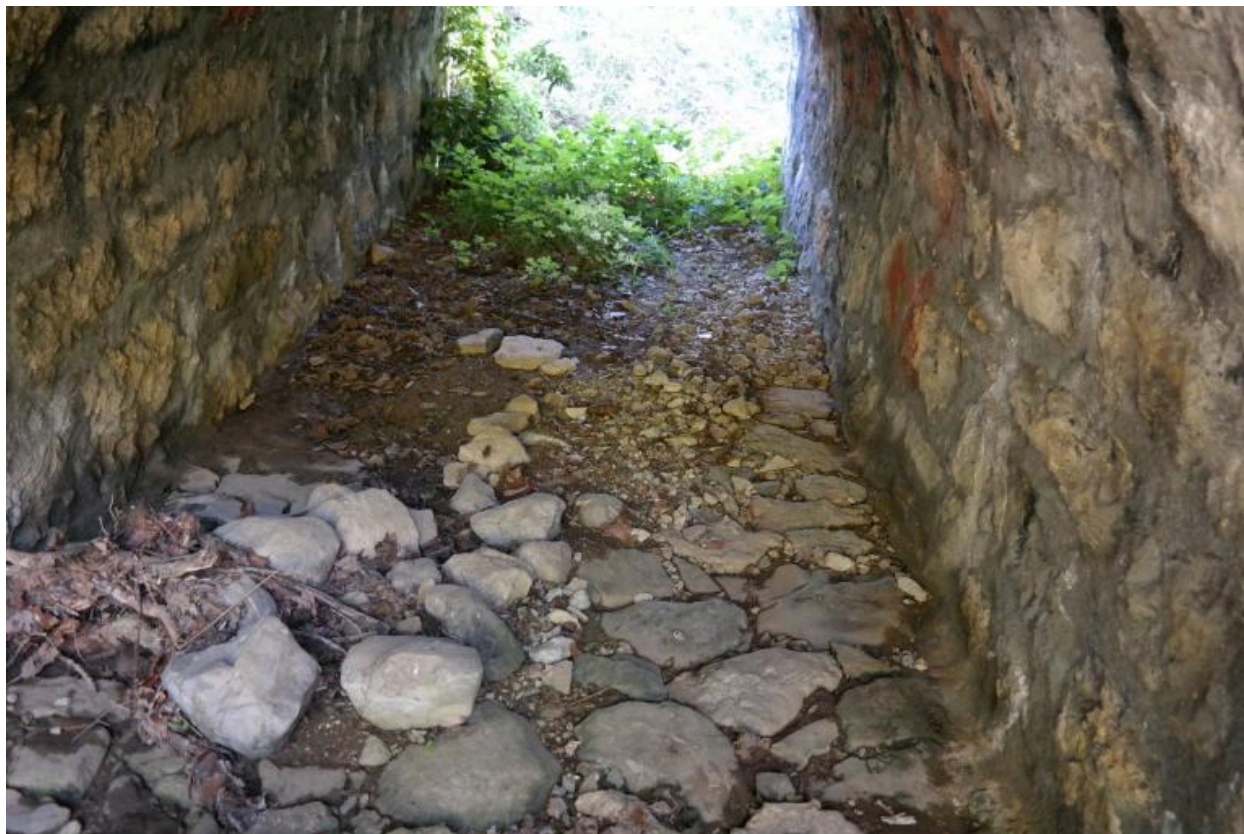
Pont du Borgel, vue du lit du cours d'eau sous le pont