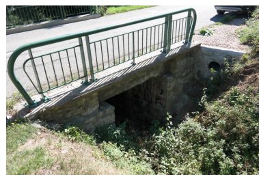
Pont du Borgel, vue de la face amont