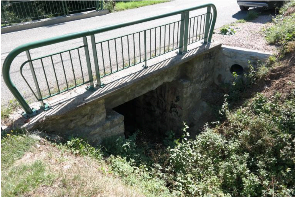
Pont du Borgel, vue de la face amont