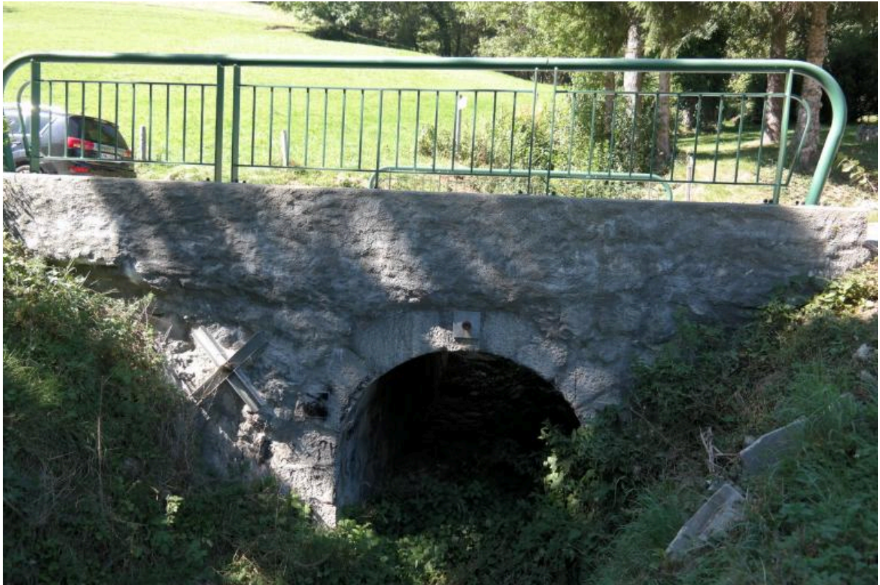
PONT du Borgel, vue de la face aval