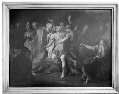
Vue générale IVR82_19786900086P