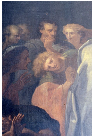
Détail