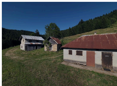
Vue d'ensemble. IVR84_20167305046NUCA