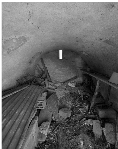
Vue de l'intérieur de la cave voûtée. IVR84_20167305048NUCQ