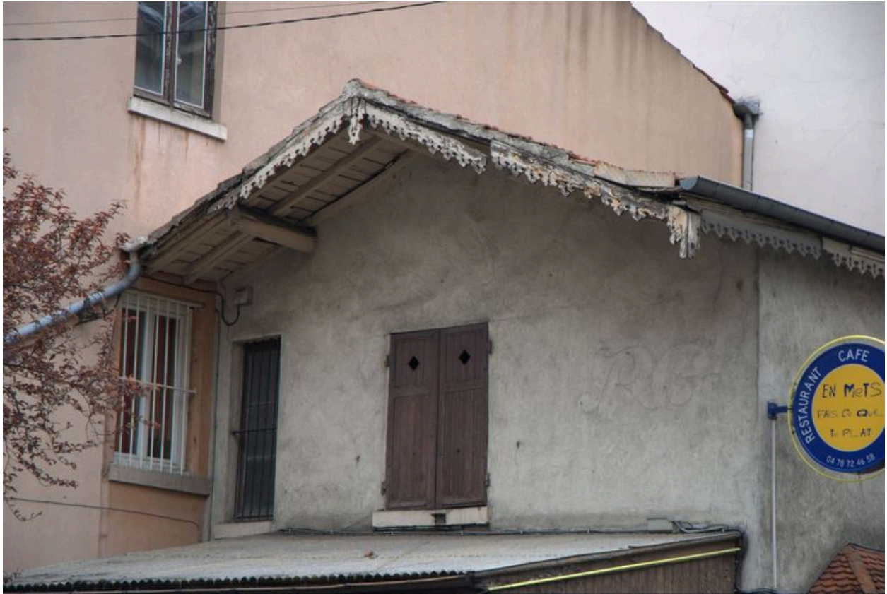
Partie supérieure de l'élévation antérieure