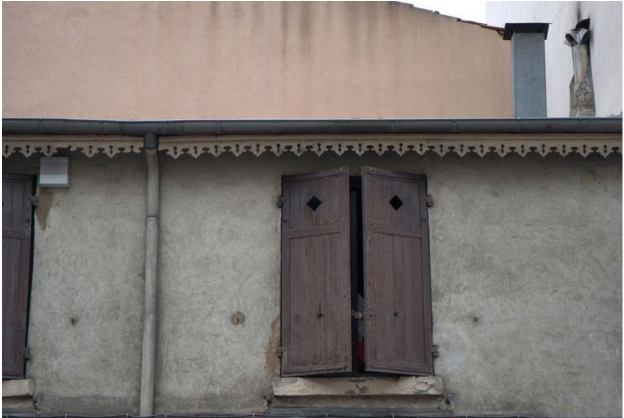
Détail de l'élévation latérale