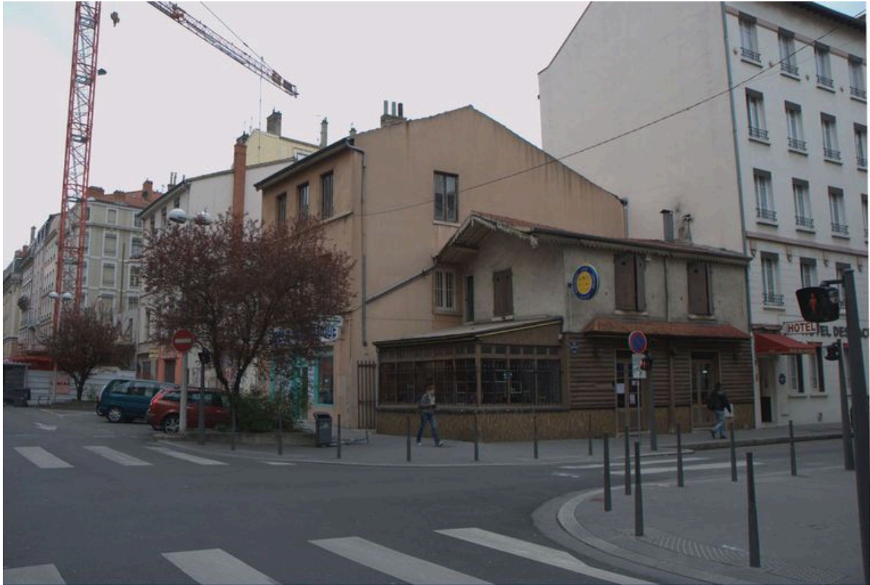
Elévations antérieure et latérale depuis le sud-est