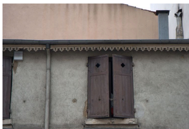
Détail de l'élévation latérale IVR82_20086900133NUCA