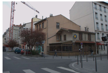
Elévations antérieure et latérale depuis le sud-est IVR82_20086900131NUCA