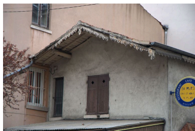
Partie supérieure de l'élévation antérieure