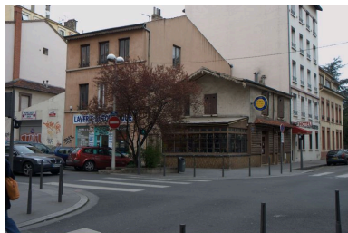
Vue de situation IVR82_20086900130NUCA