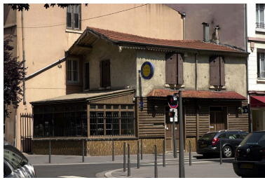
Vue générale IVR82_20086901396NUCA