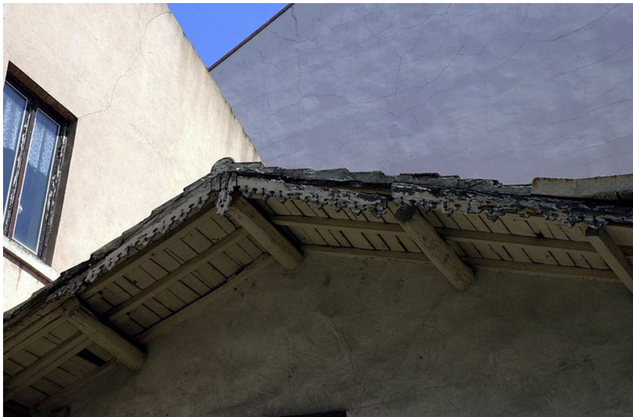
Détail du lambrequin rue Chevreul