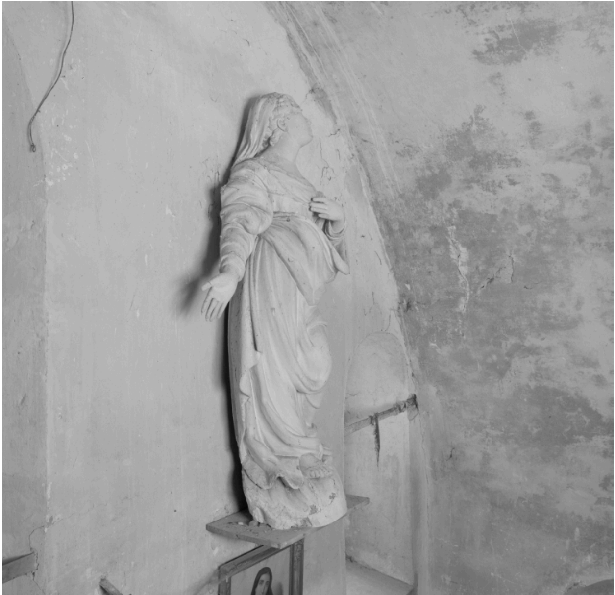
Vue de profil.