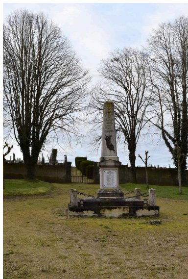
Vue générale IVR84_20250300524NUCA