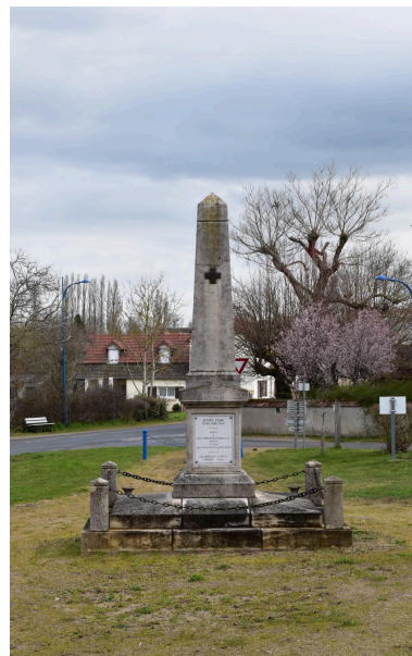
IVR84_20250300526NUCA