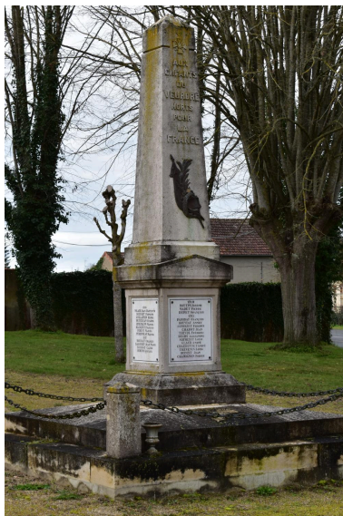
IVR84_20250300525NUCA