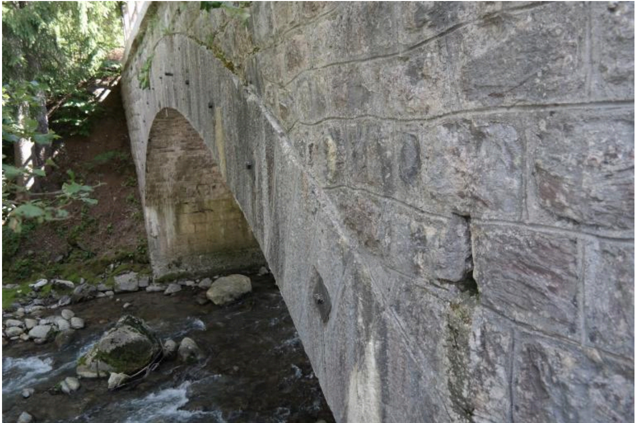
Pont de la Solitude, détail du bandeau de voûte et du tympan