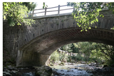
Pont de la Solitude, vue de la face aval IVR84_20207401035NUCA