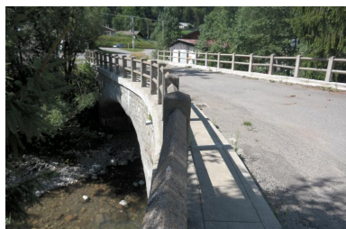
Vue générale du Pont de la Solitude