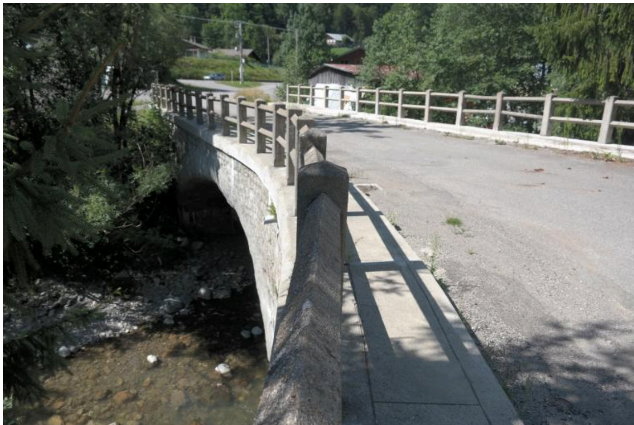
Vue générale du Pont de la Solitude