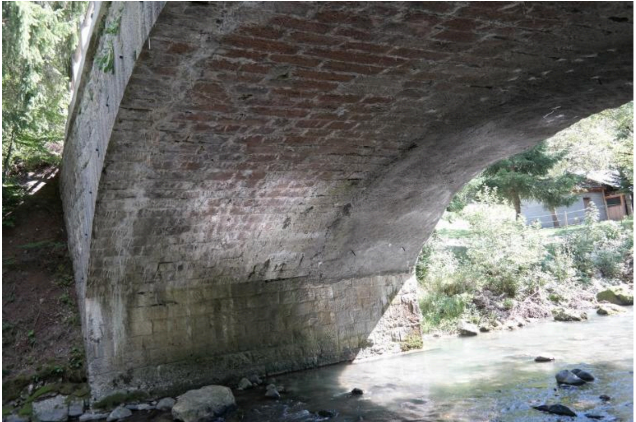
Pont de la Solitude, vue du dessous