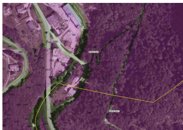
Cadastre des communes de Bonnevaux et d'Abondance. 2017. IVR84_20207401040NUCA