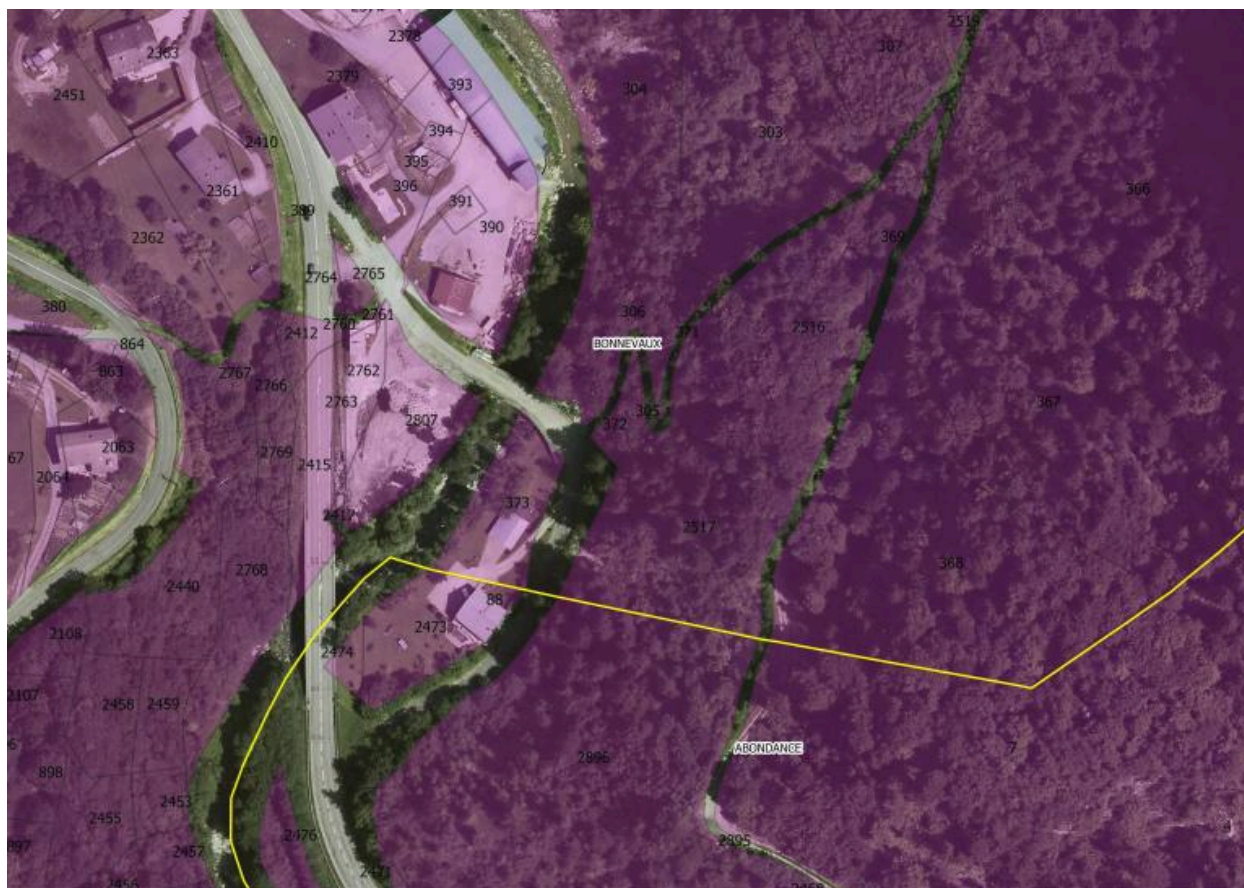
Cadastre des communes de Bonnevaux et d'Abondance. 2017.