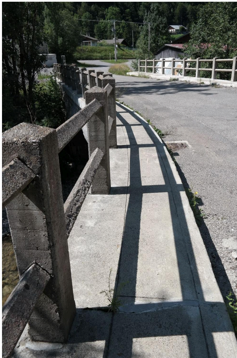
Pont de la Solitude, détail garde-corps et chaussée