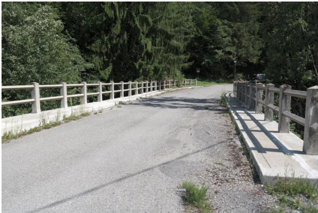
Pont de la Solitude, vue de la chaussée et des garde-corps