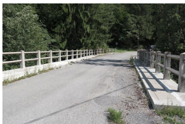
Pont de la Solitude, vue de la chaussée et des garde-corps IVR84_20207401034NUCA