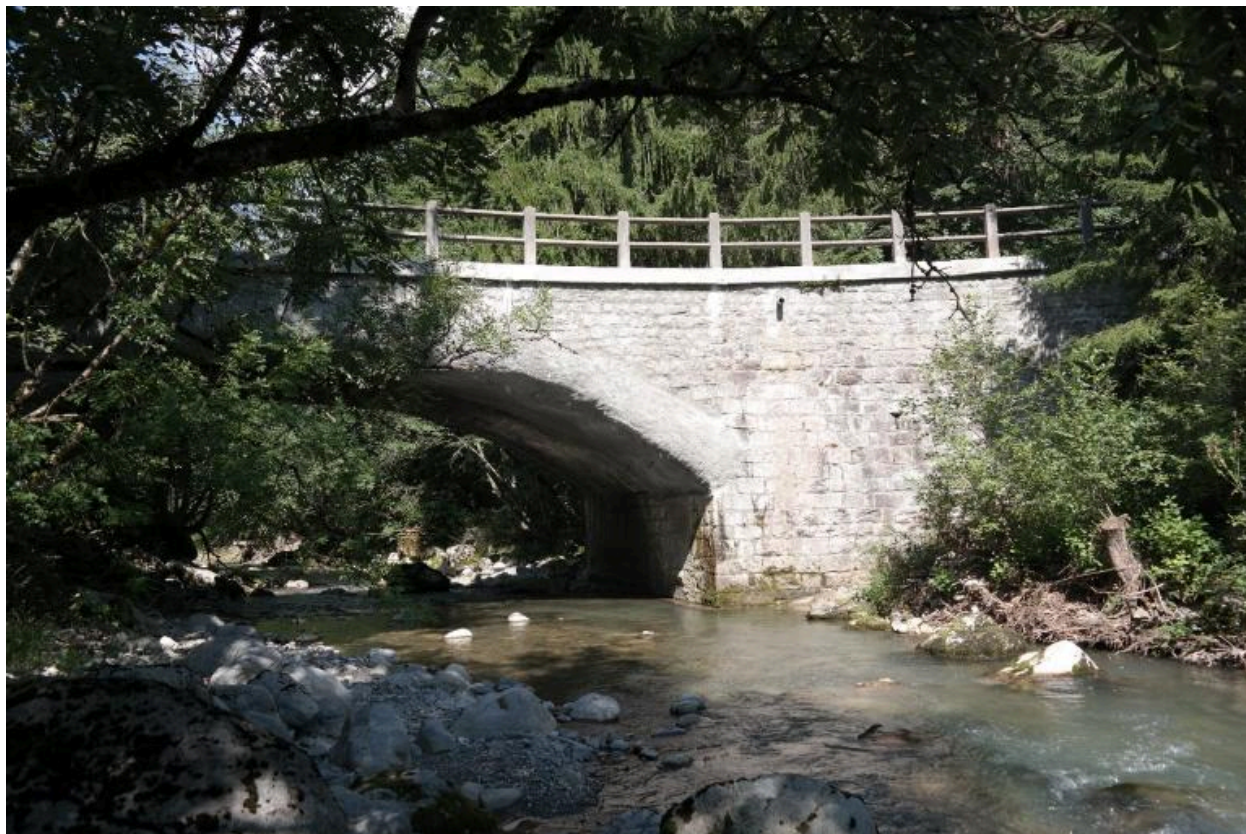
Pont de la Solitude, vue de la face amont