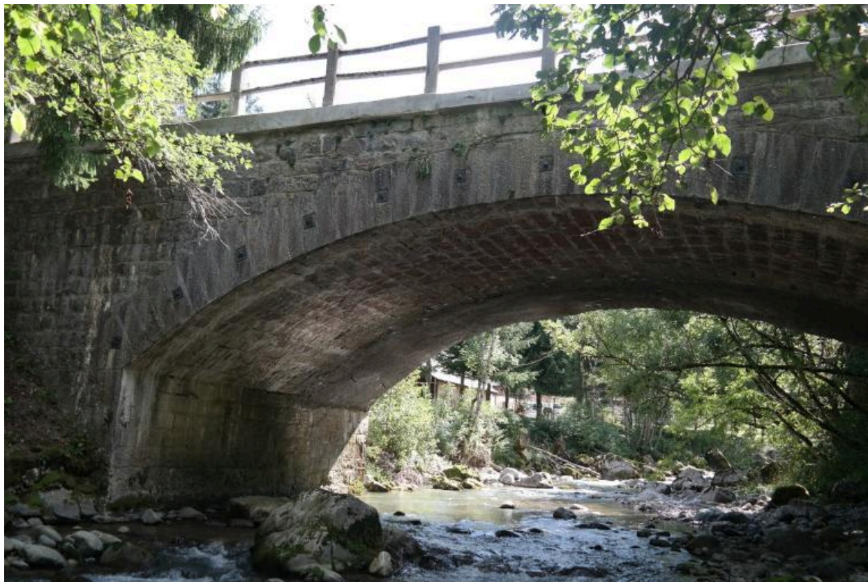
Pont de la Solitude, vue de la face aval