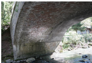
Pont de la Solitude, vue du dessous IVR84_20207401037NUCA