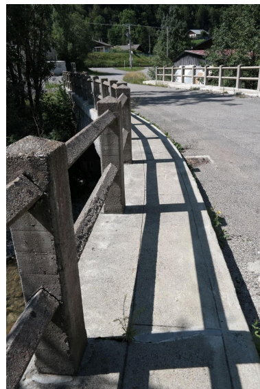
Pont de la Solitude, détail garde-corps et chaussée IVR84_20207401038NUCA