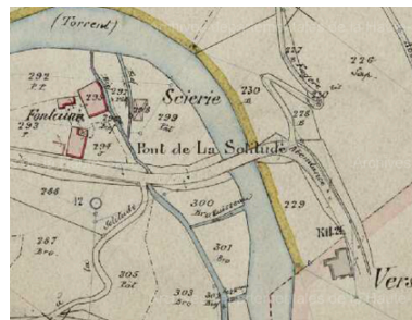
Extrait de la Feuille n°2 du cadastre de Bonnevaux. 1920. IVR84_20207401033NUCA