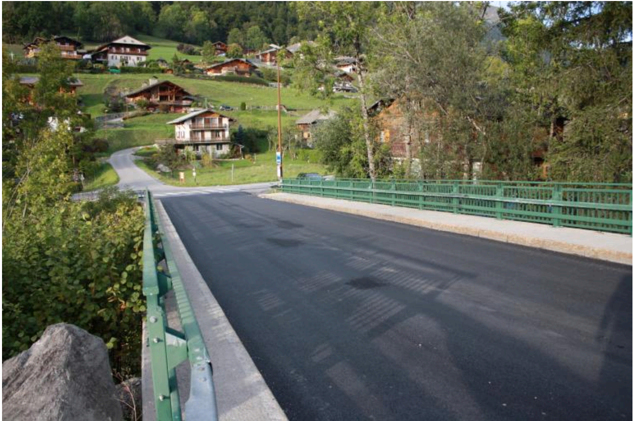
Pont de la Glière, contexte, chaussée et garde corps