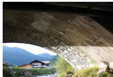
Pont de la Glières, détail intrados IVR84_20207400975NUCA