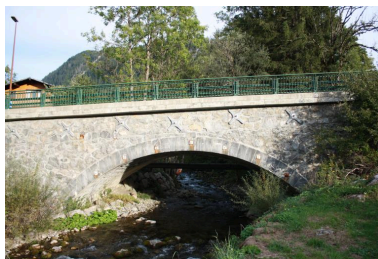
Pont de la Glières, face aval