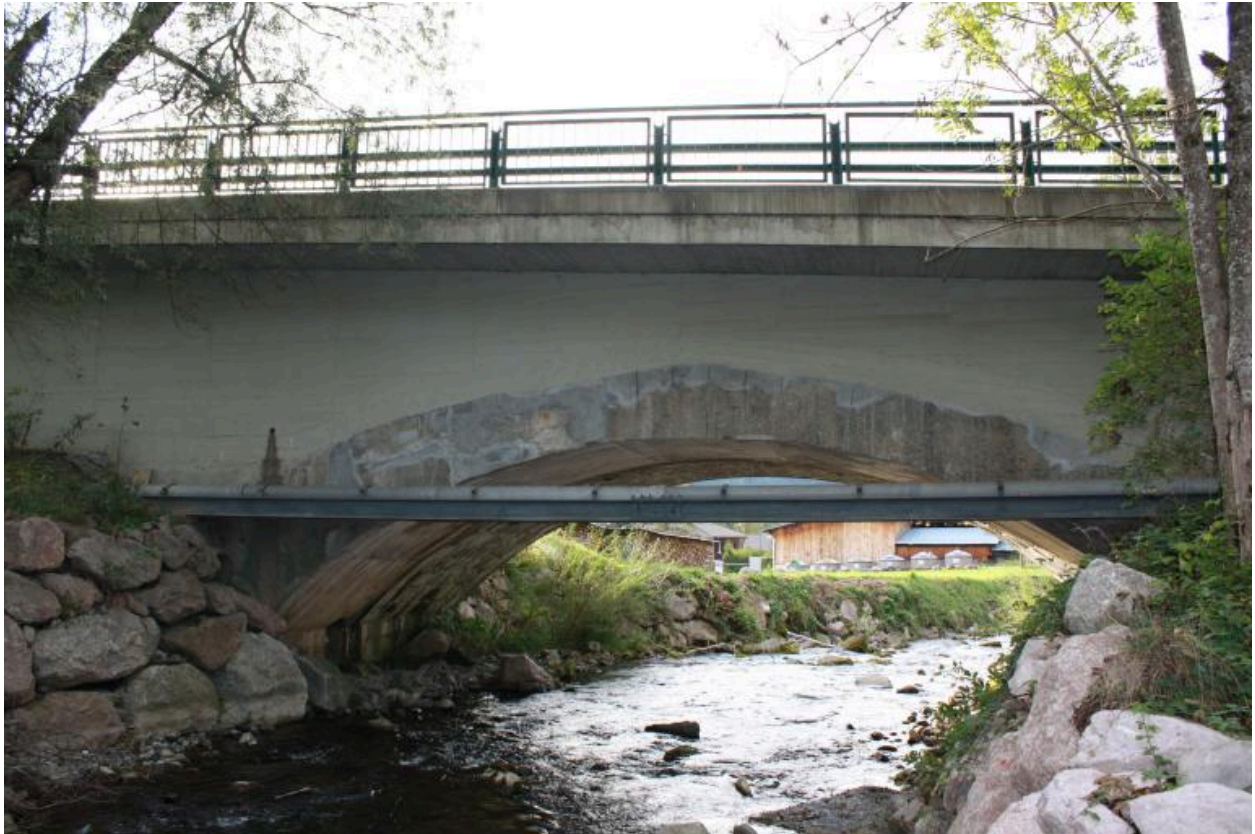
Pont de la Glières, face amont