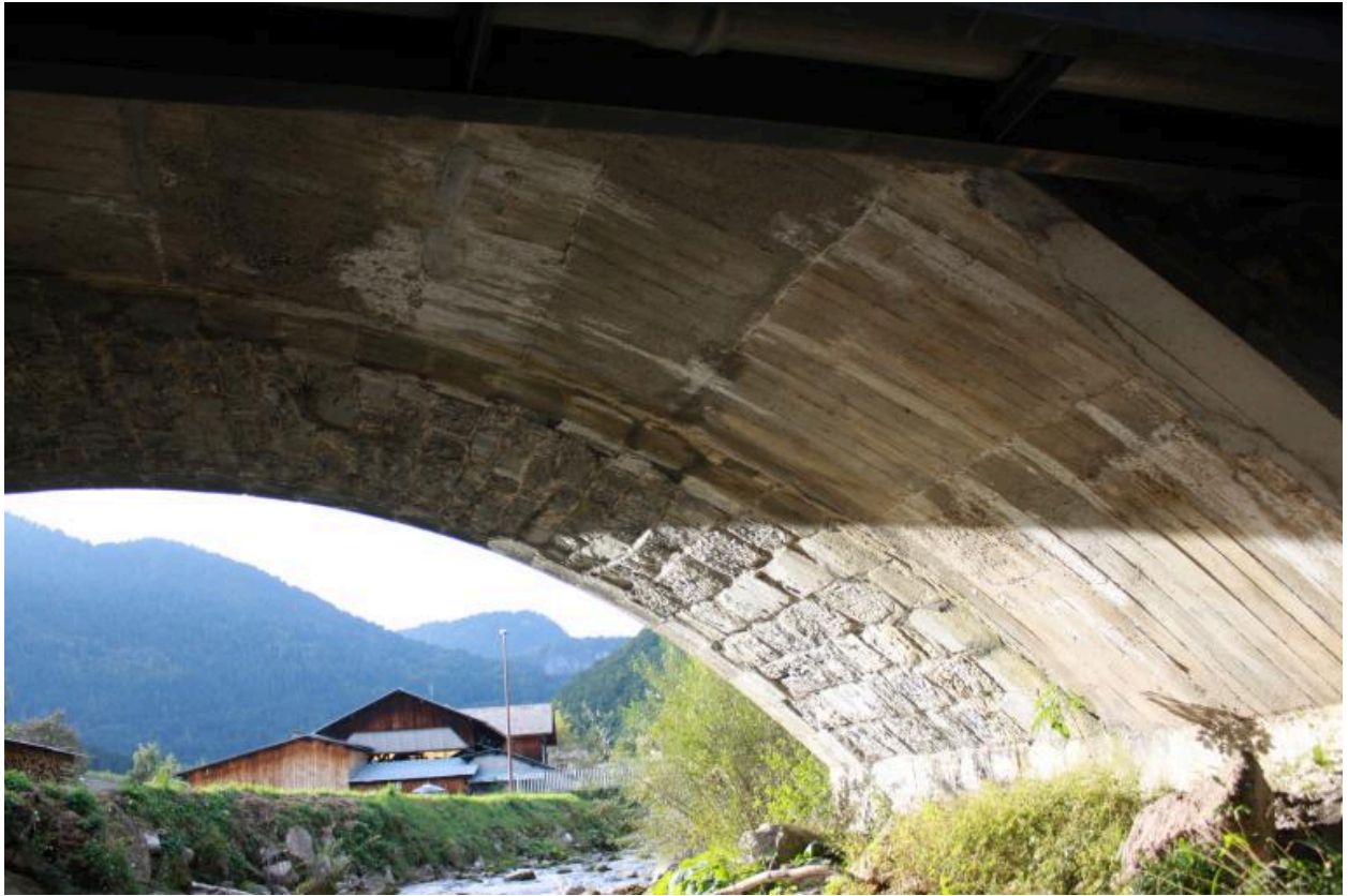
Pont de la Glières, détail intrados