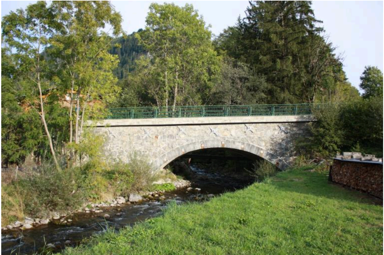
Vue générale du pont de la Glières