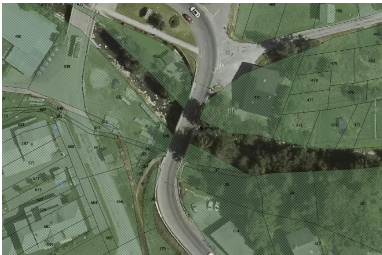
Cadastre de la commune de Montriond, 2017, Ortho photo 2015, Département de la Haute-Savoie/Pôle culture et patrimoine/ SIG