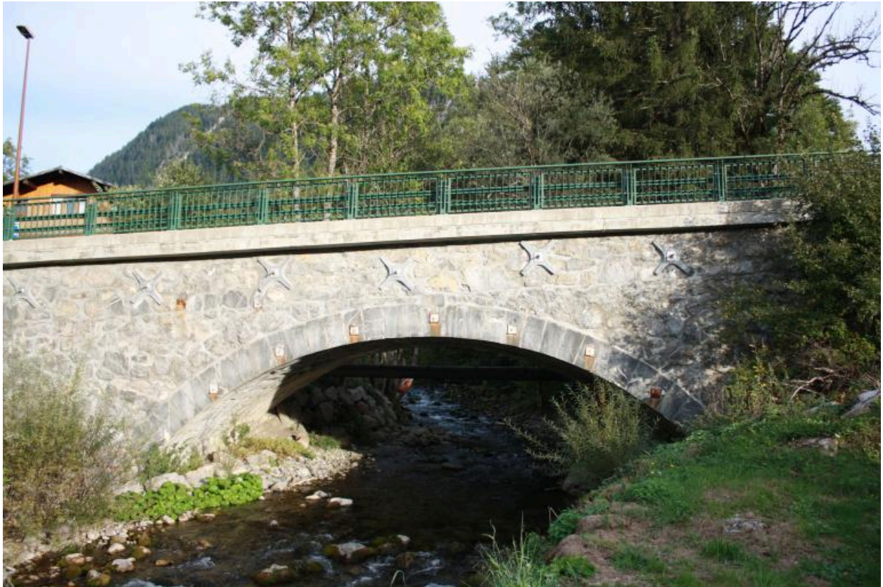
Pont de la Glières, face aval