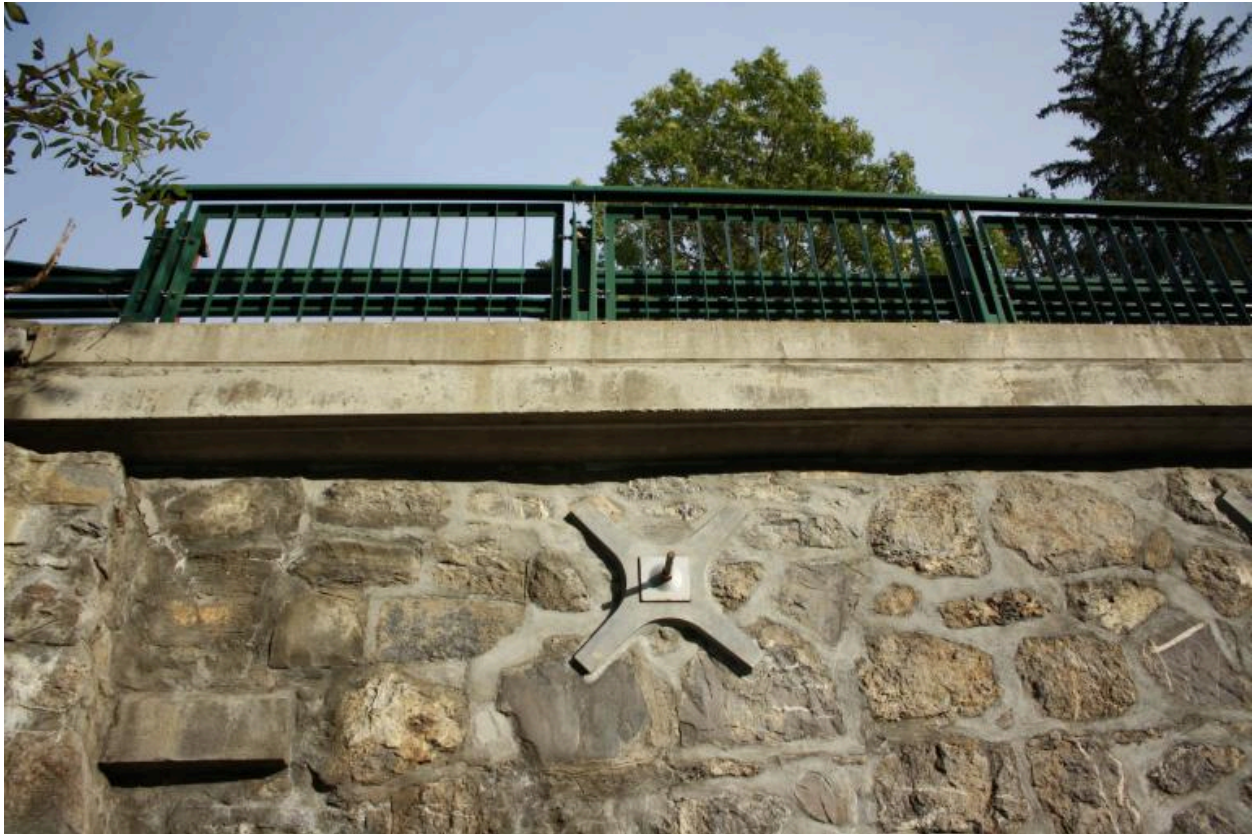
Pont de la Glières, détails tympan, enserrement et plinthe