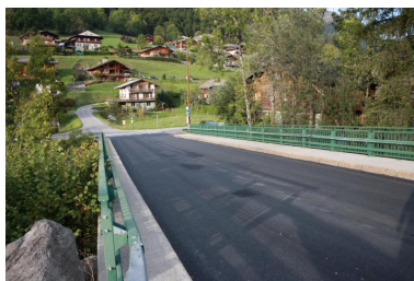
Pont de la Glière, contexte, chaussée et garde corps IVR84_20207400977NUCA