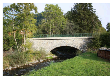
Vue générale du pont de la Glières IVR84_20197401262NUCA