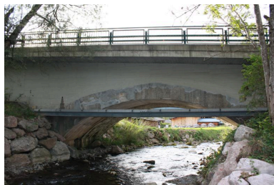
Pont de la Glières, face amont IVR84_20207400973NUCA