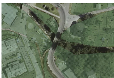
Cadastre de la commune de Montriond, 2017, Ortho photo 2015, Département de la Haute-Savoie/ Pôle culture et patrimoine/ SIG IVR84_20207400972NUCA