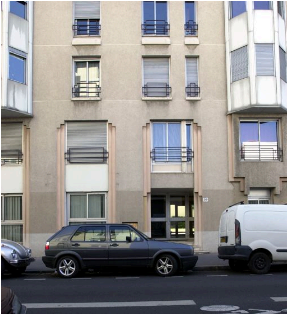
Elévation antérieure, détail de deux travées