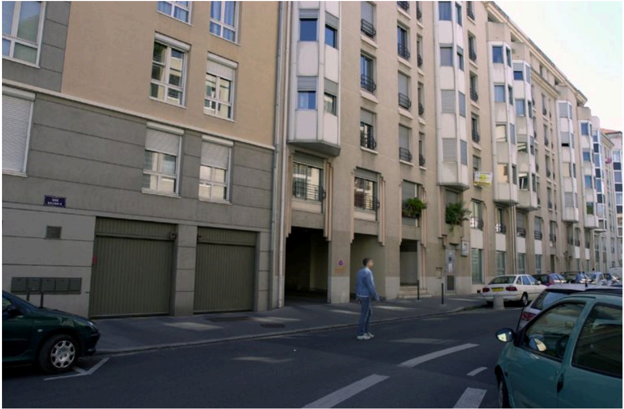
Élévation antérieure, depuis le nord