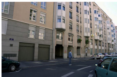
Elévation antérieure, depuis le nord IVR82_20096901354NUCA