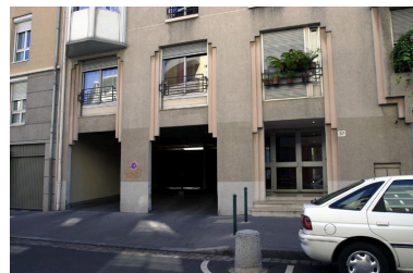
Elévation antérieure, détail des ouvertures (porte d'entrée et accès aux garages) IVR82_20096901355NUCA