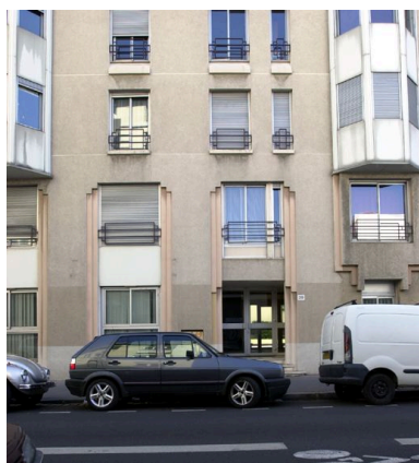
Elévation antérieure, détail de deux travées IVR82_20096901356NUCA