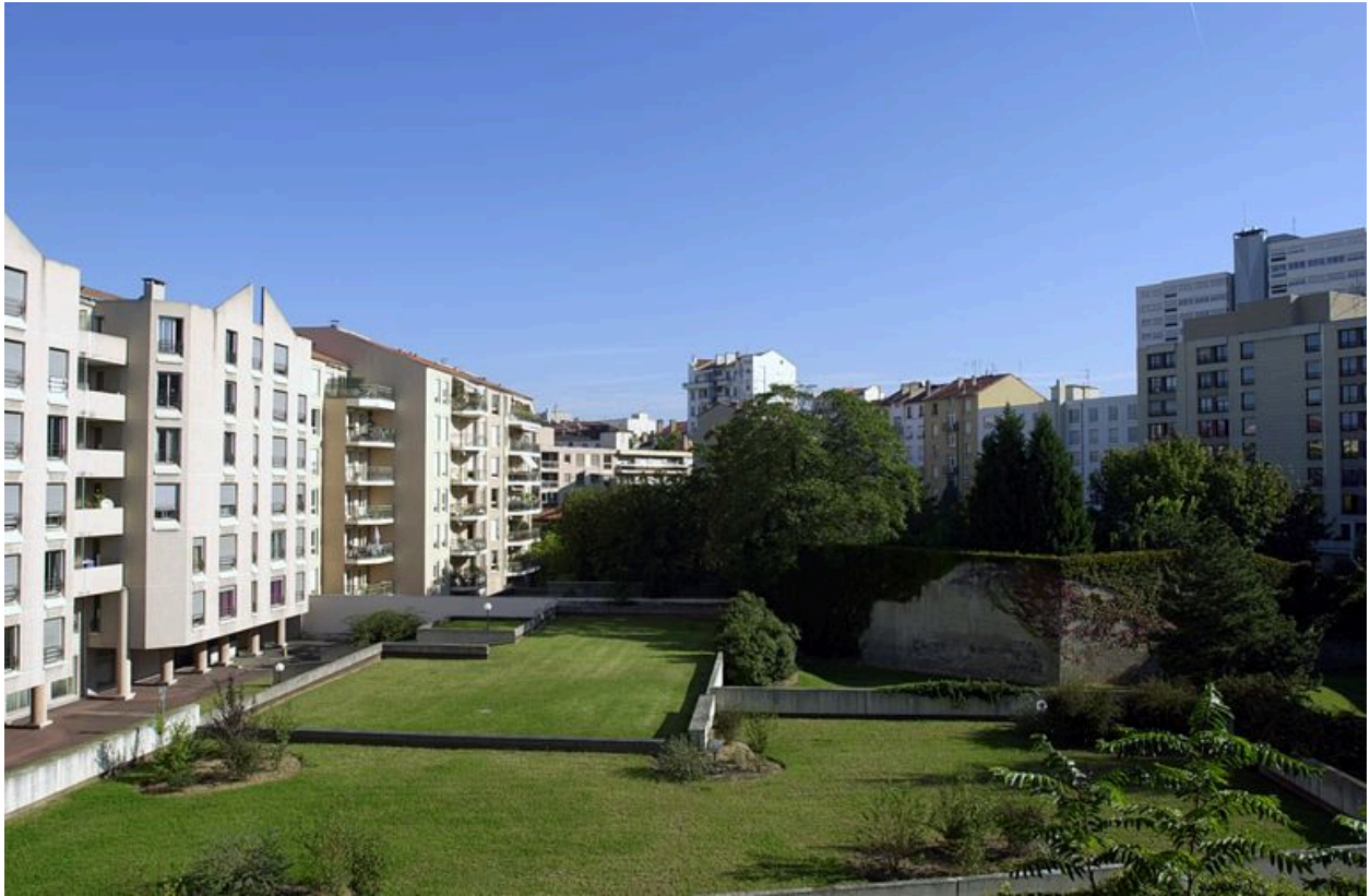
Élévation postérieure, vue partielle depuis le sud