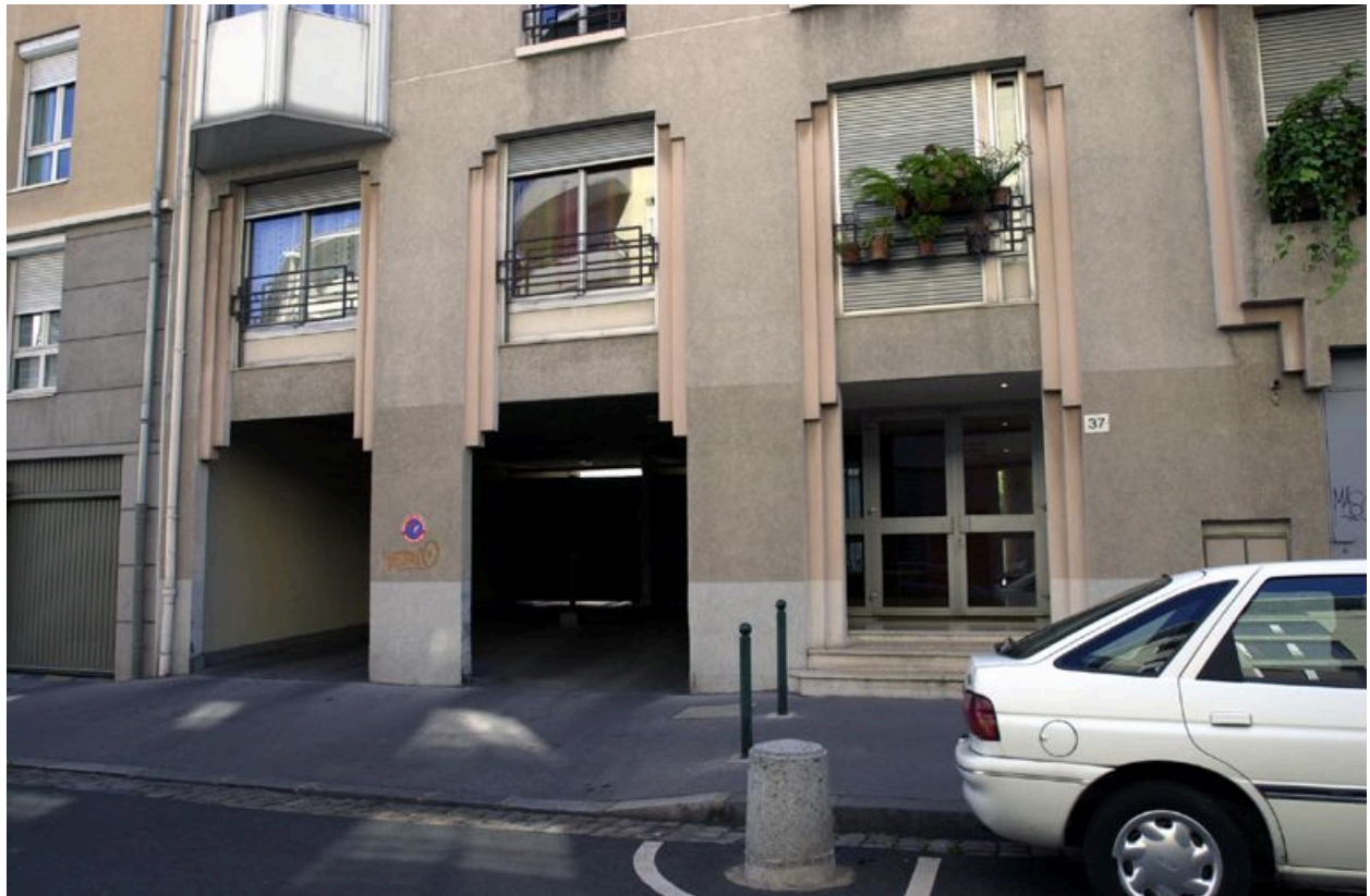
Elévation antérieure, détail des ouvertures (porte d'entrée et accès aux garages)