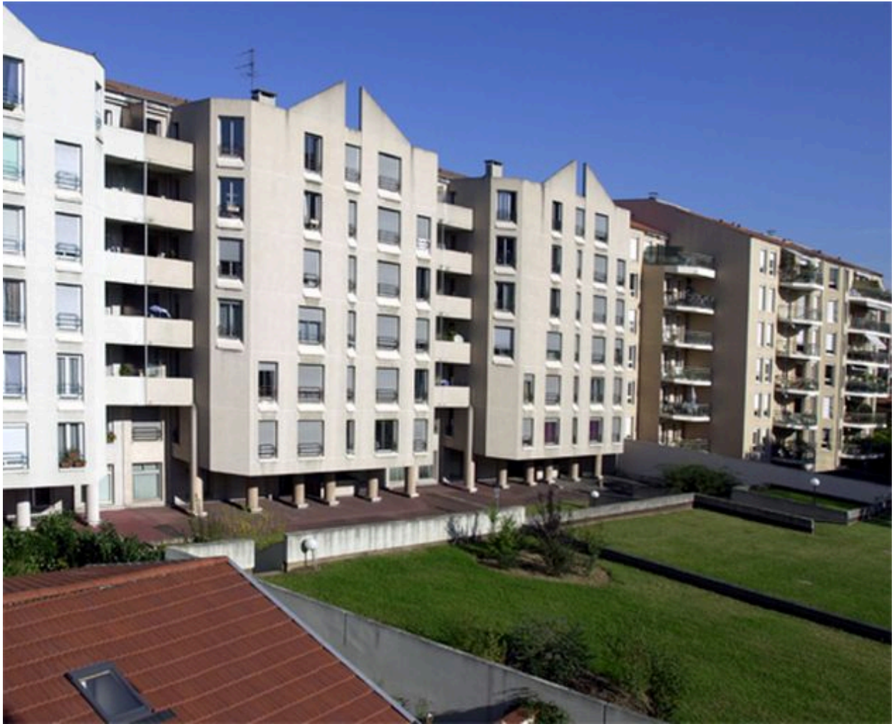
Elévation postérieure et cour-jardin