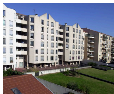
Elévation postérieure et cour-jardin IVR82_20096901357NUCA