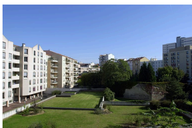
Elévation postérieure, vue partielle depuis le sud IVR82_20116904918NUCA