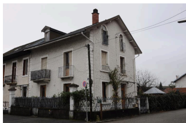
Vue d'ensemble