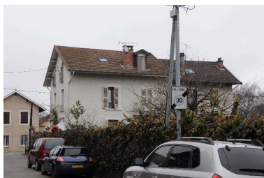
Vue depuis l'arrière