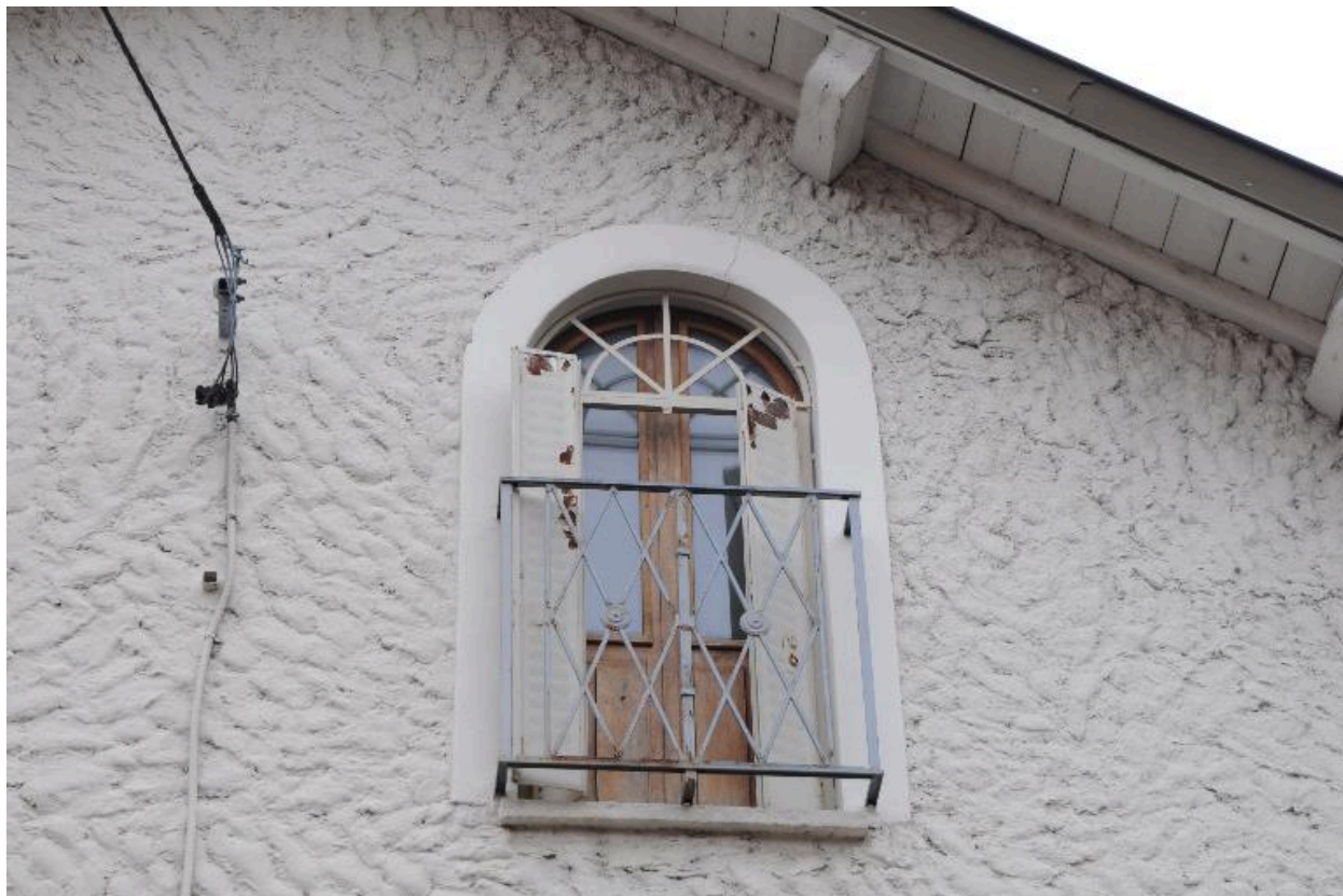
Baie sur le pignon ouest