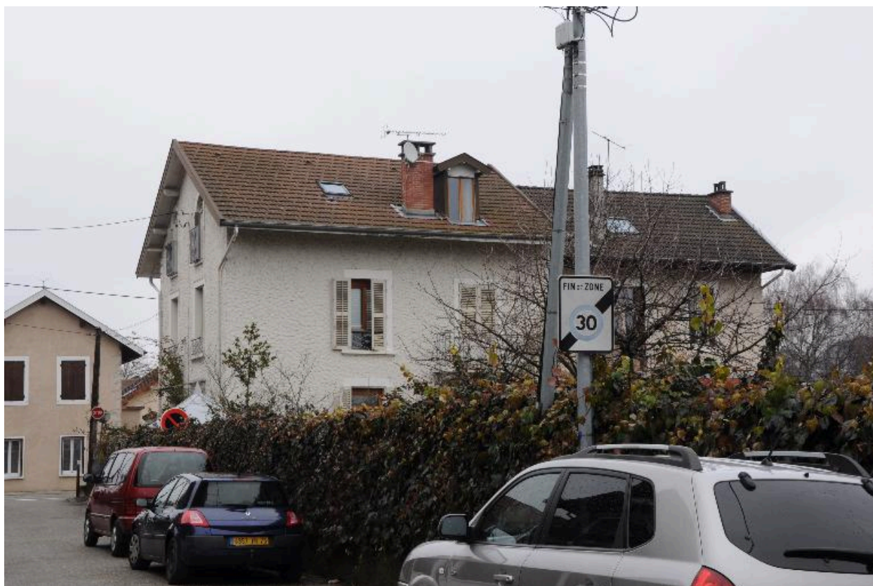
Vue depuis l'arrière