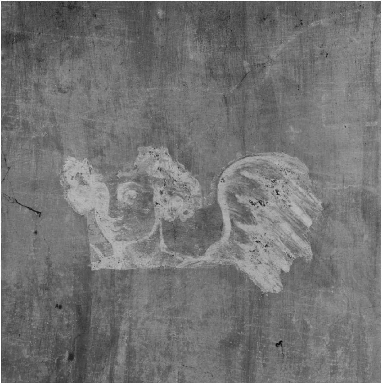
Cul-de-four de l'abside : détail d'un angelot (juin 2002).