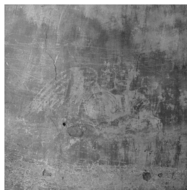
Cul-de-four de l'abside : détail d'un angelot transparaisant sous le badigeon avant dégagement.