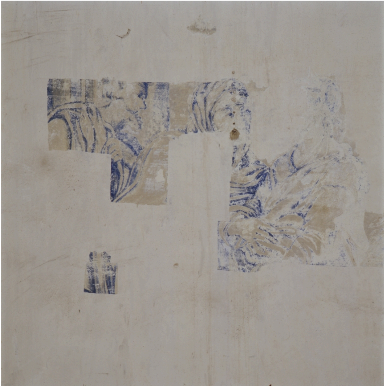
La Visitation, détail (juin 2002).