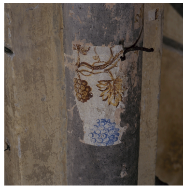
Détail d'une colonne : pampres de vigne (juin 2002).