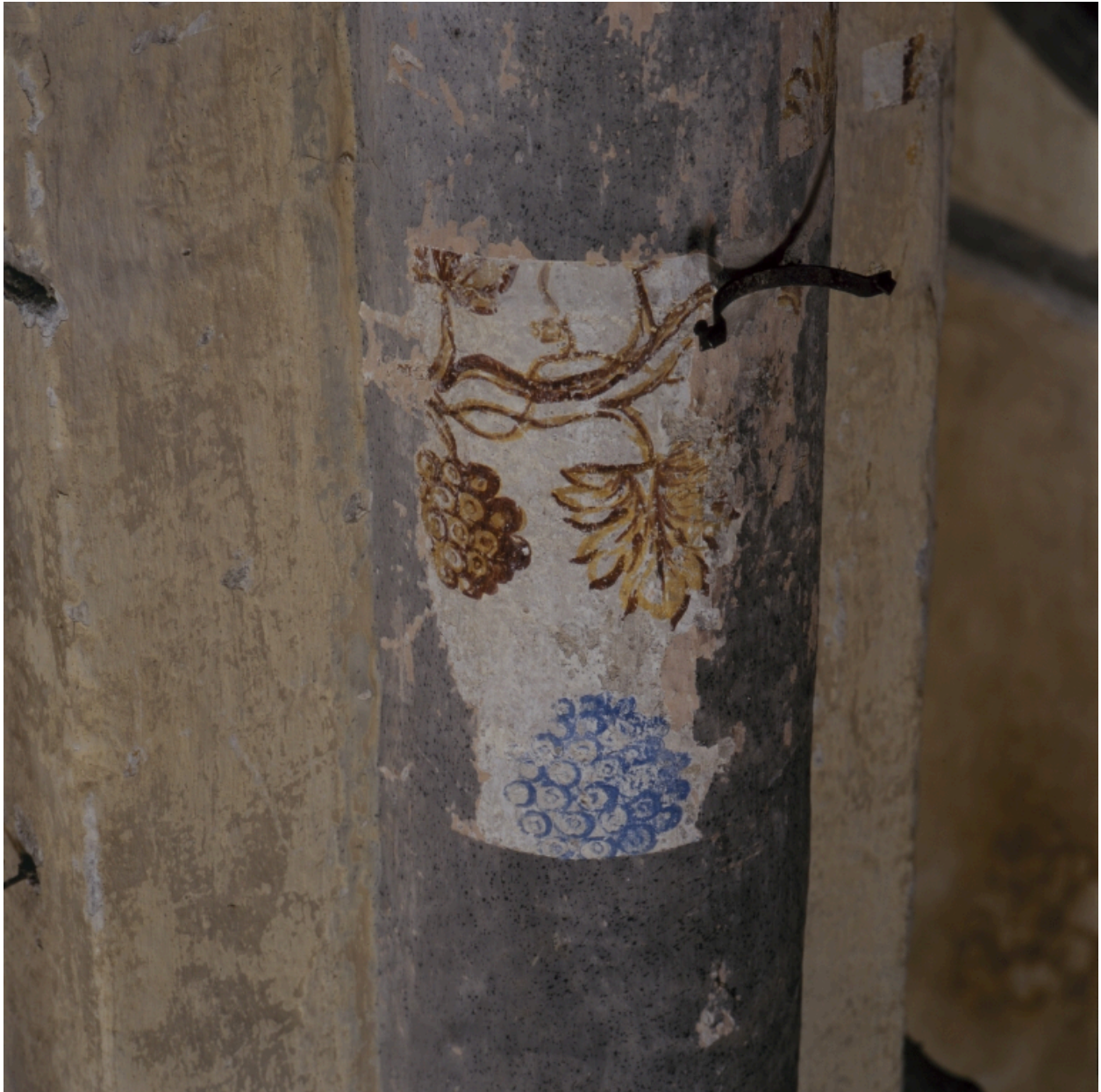
Détail d'une colonne : pampres de vigne (juin 2002).