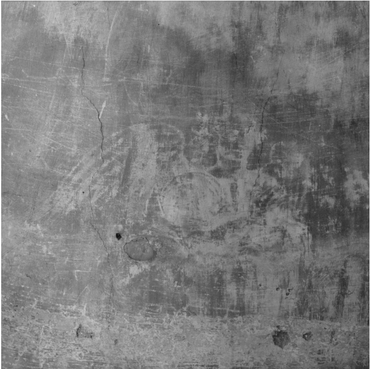
Cul-de-four de l'abside : détail d'un angelot transparissant sous le badigeon avant dégagement.