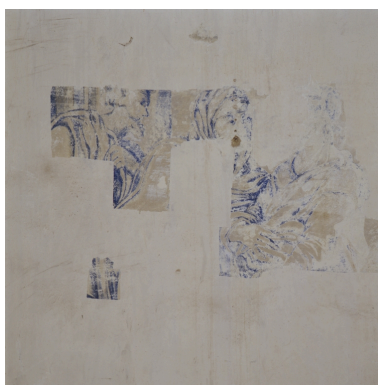
La Visitation, détail (juin 2002).