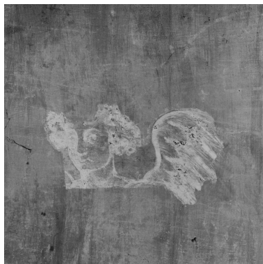
Cul-de-four de l'abside : détail d'un angelot (juin 2002).