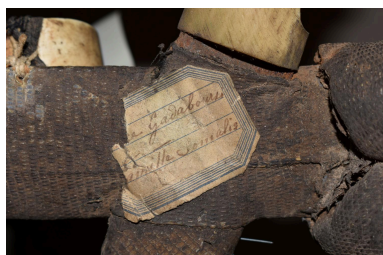
Détail de l'étiquette