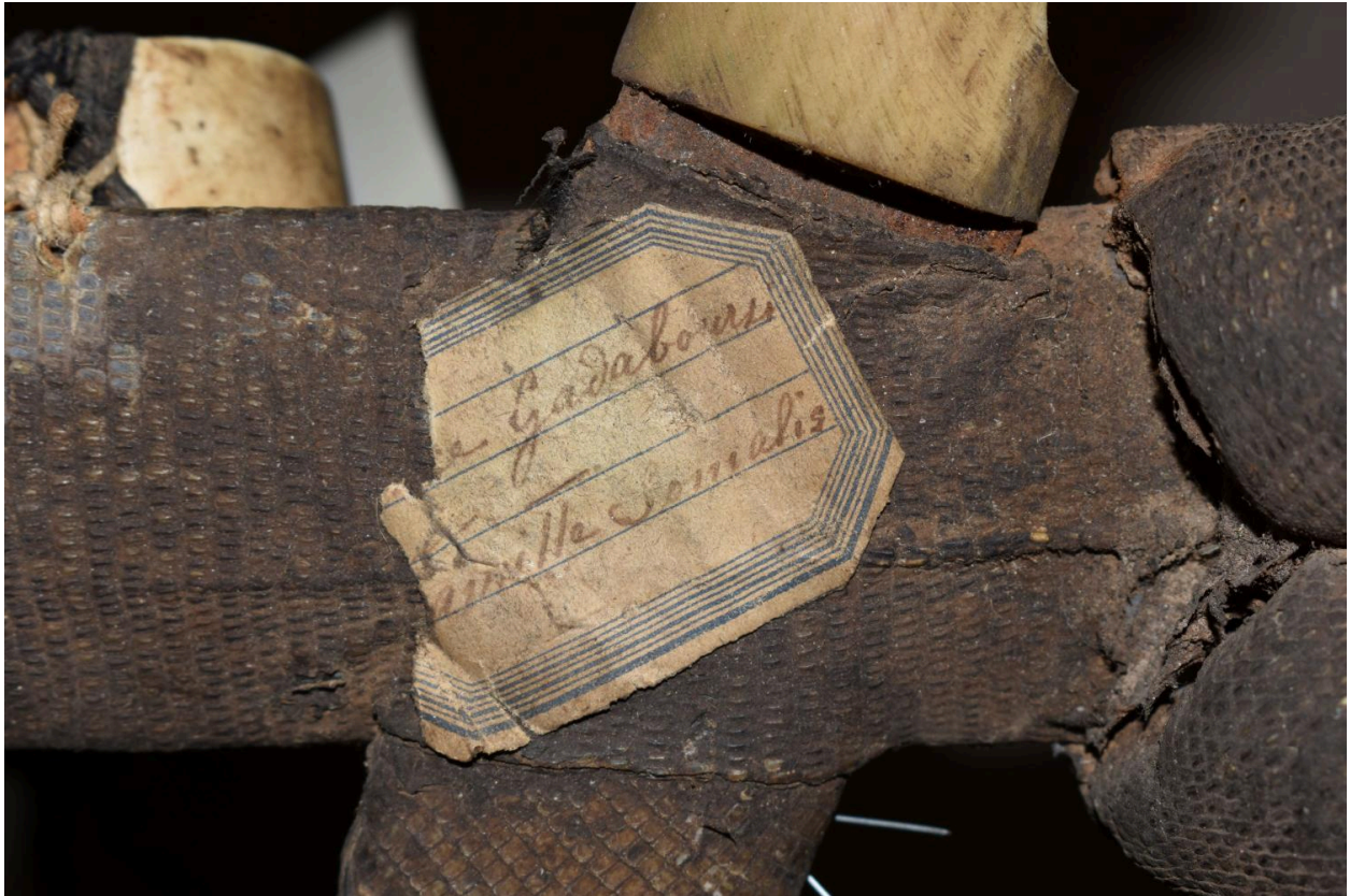
Détail de l'étiquette