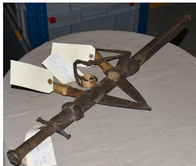
Vue générale IVR84_20226302980NUC4A