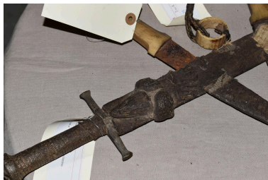
Détail IVR84_20226302981NUC4A