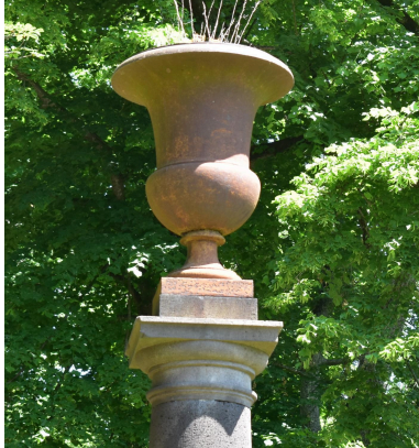
Vue générale IVR84_20226300804NUCA