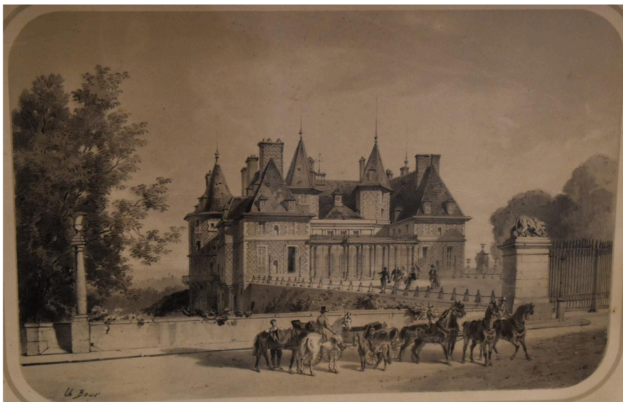
Lithographie de Charles Bour