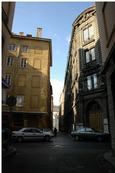
Vue de situation sur la rue des Augustins IVR82_20066901060NUCA