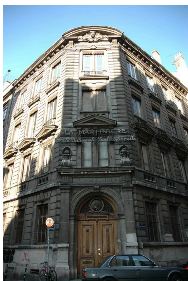
Elévations sur la rue Hippolyte- Flandrin et la rue des Augustins IVR82_20066901118NUCA