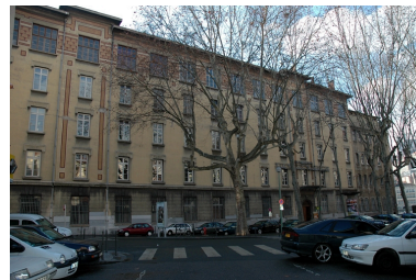
Vue générale sur la place Gabriel-Rimbaud Phot. IVR82_20066901117NUCA