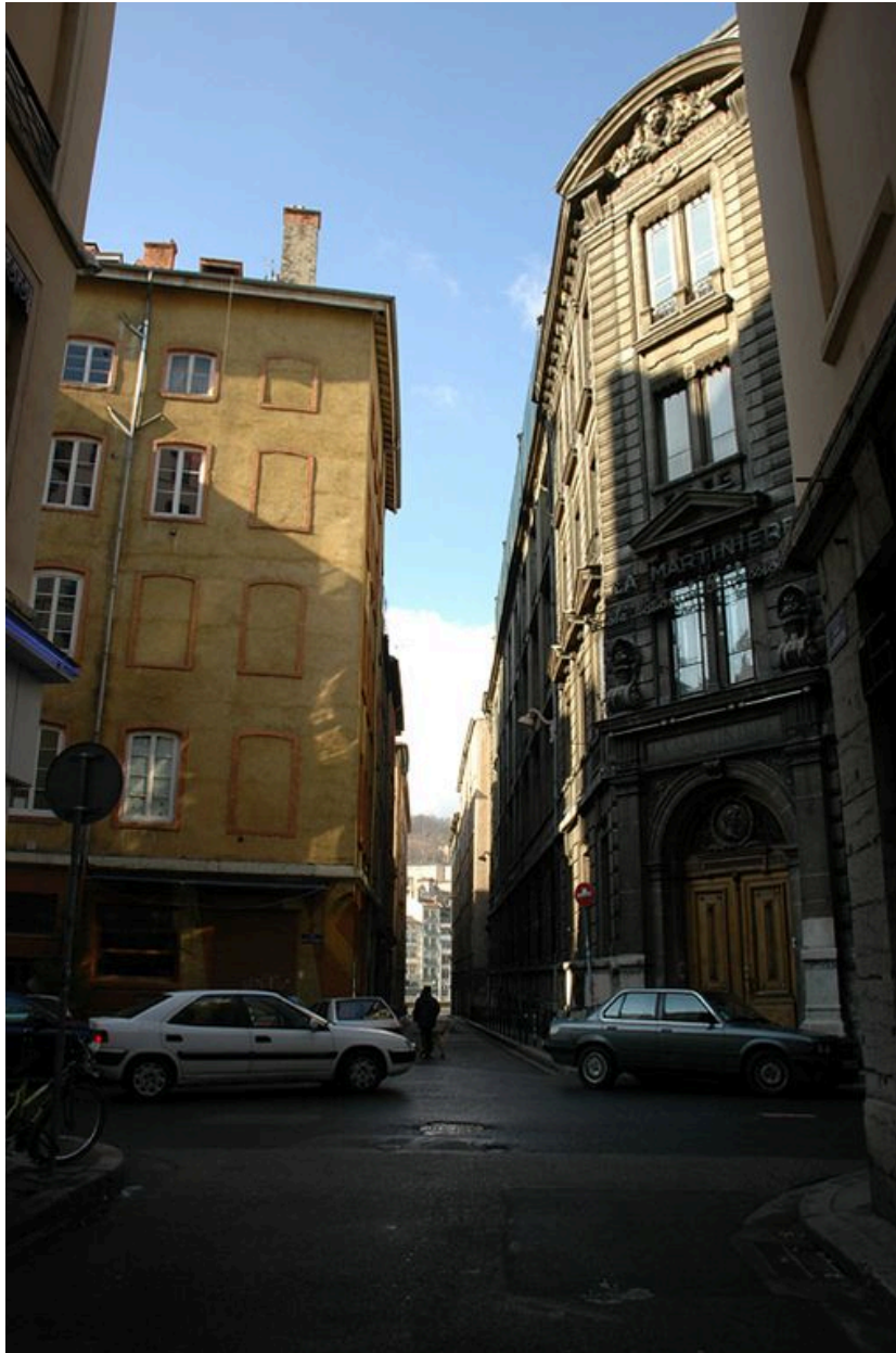
Vue de situation sur la rue des Augustins