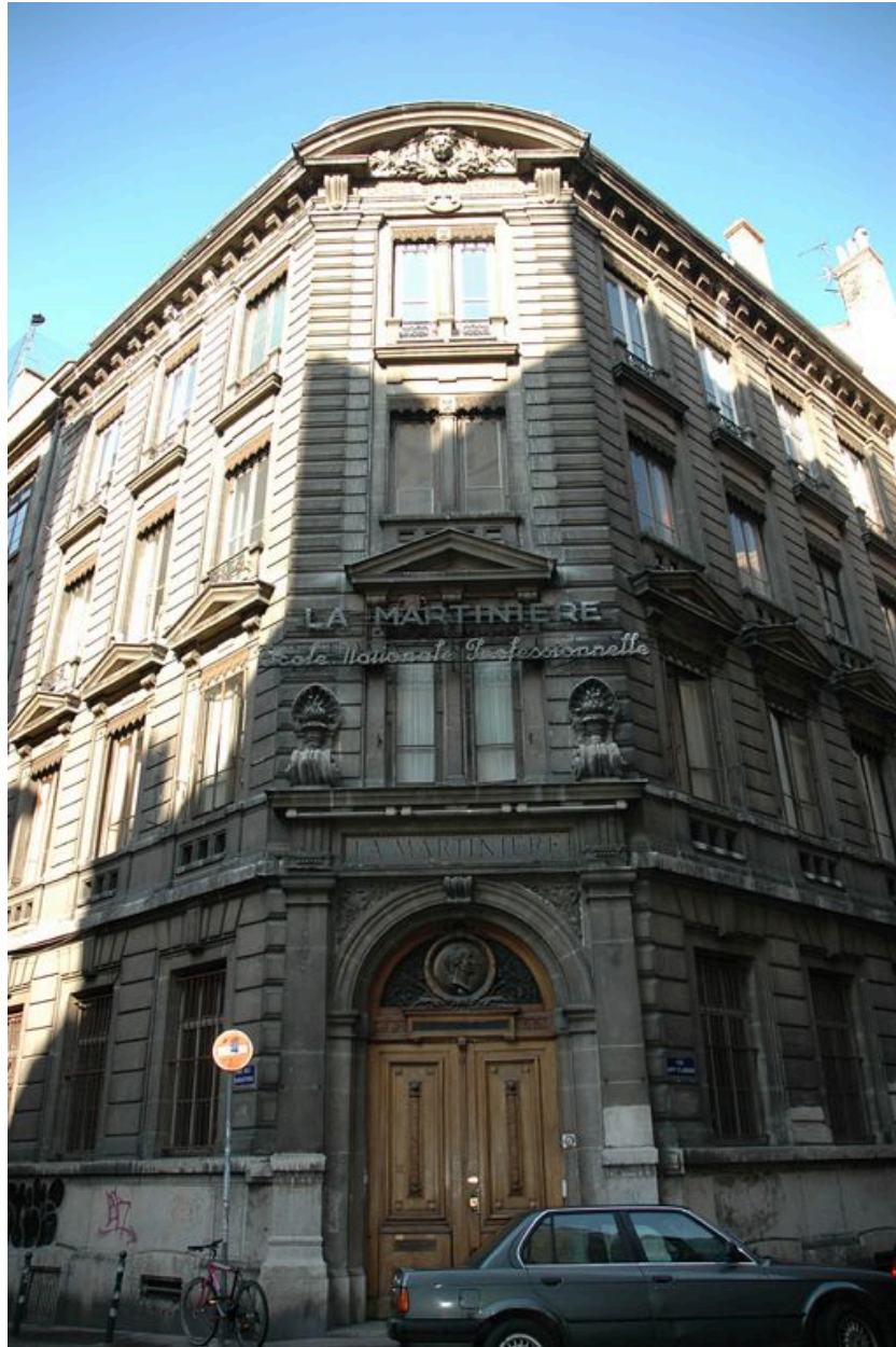
Elévations sur la rue Hippolyte-Flandrin et la rue des Augustins