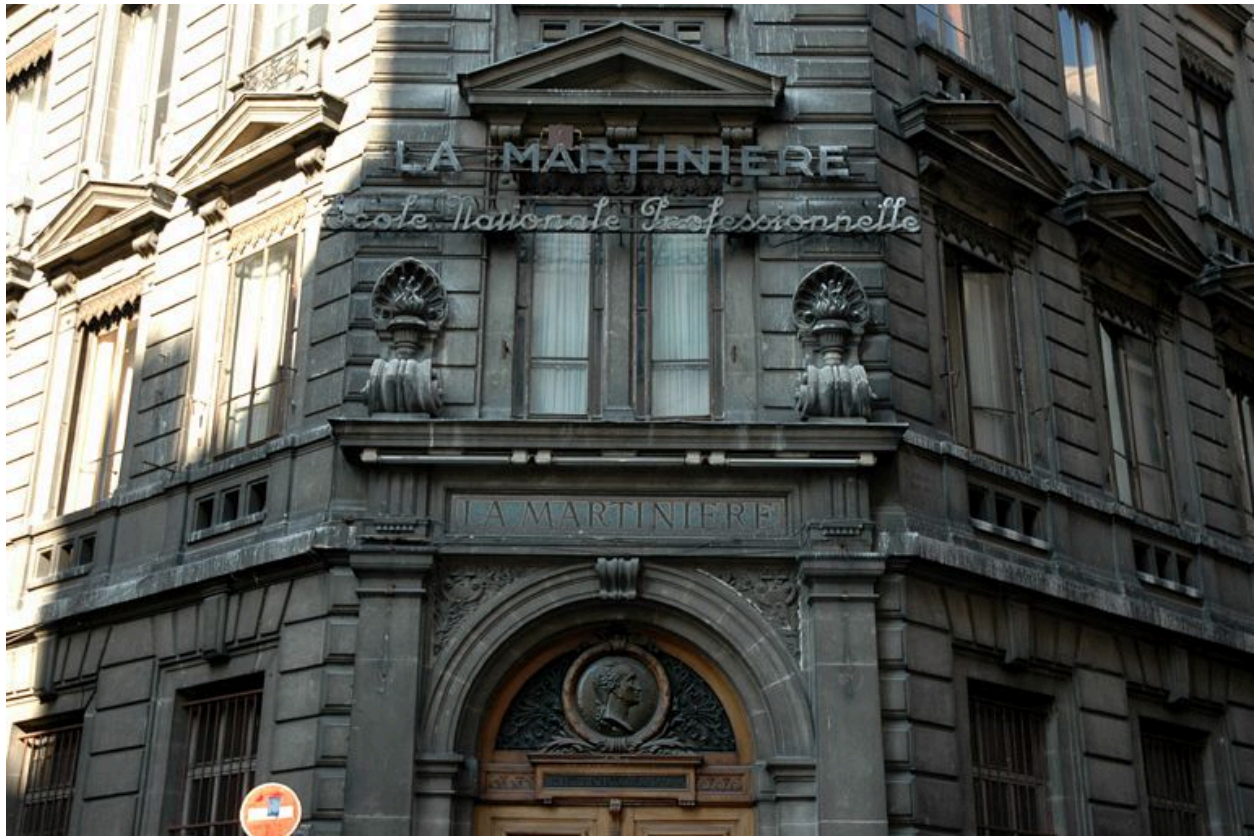
Elévations sur la rue Hippolyte-Flandrin et la rue des Augustins : détail