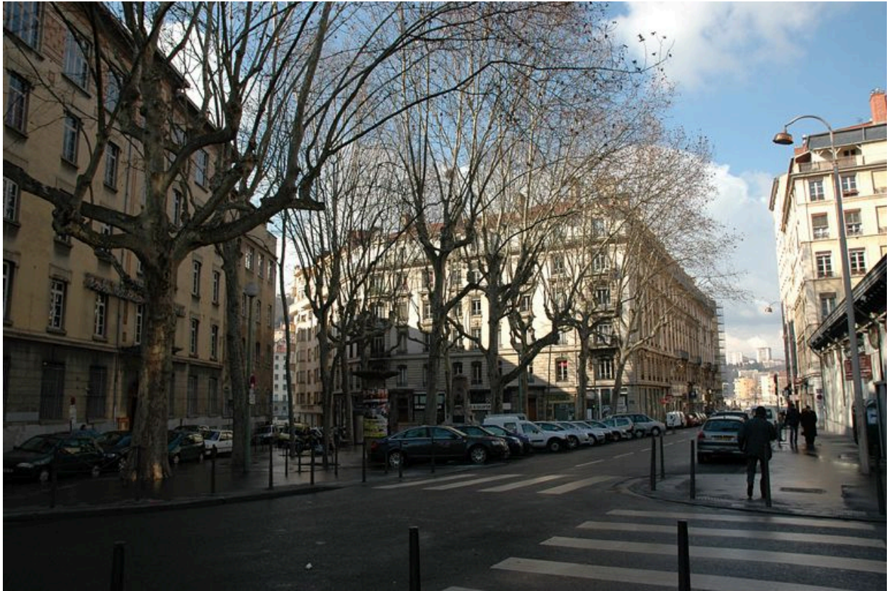
Vue de situation sur la place Gabriel-Rimbaud