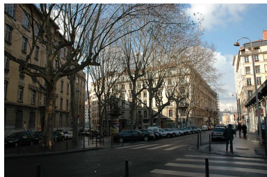
Vue de situation sur la place Gabriel-Rimbaud