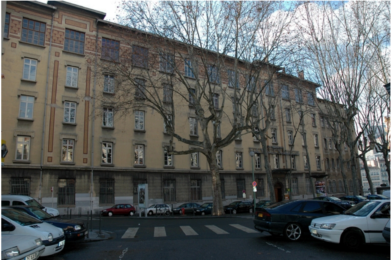
Vue générale sur la place Gabriel-Rimbaud