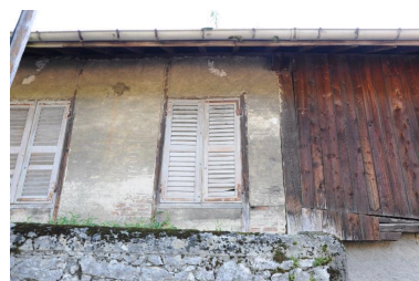
Détail de la partie supérieure de l'élévation sud