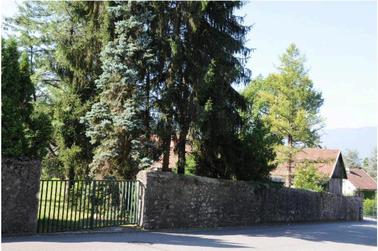
Vue générale depuis l'est