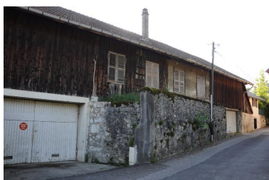
Élévation sud IVR82_20137300727NUCA