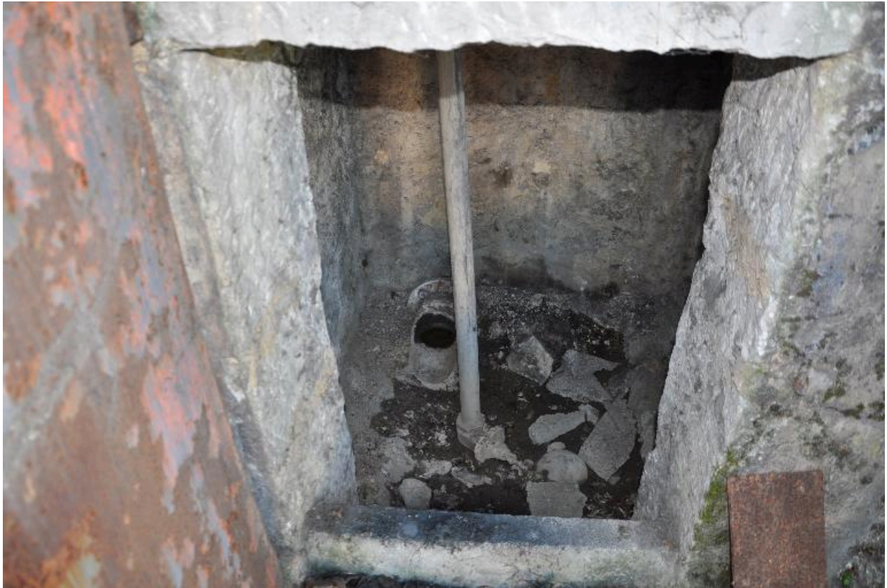
Axe de la vanne