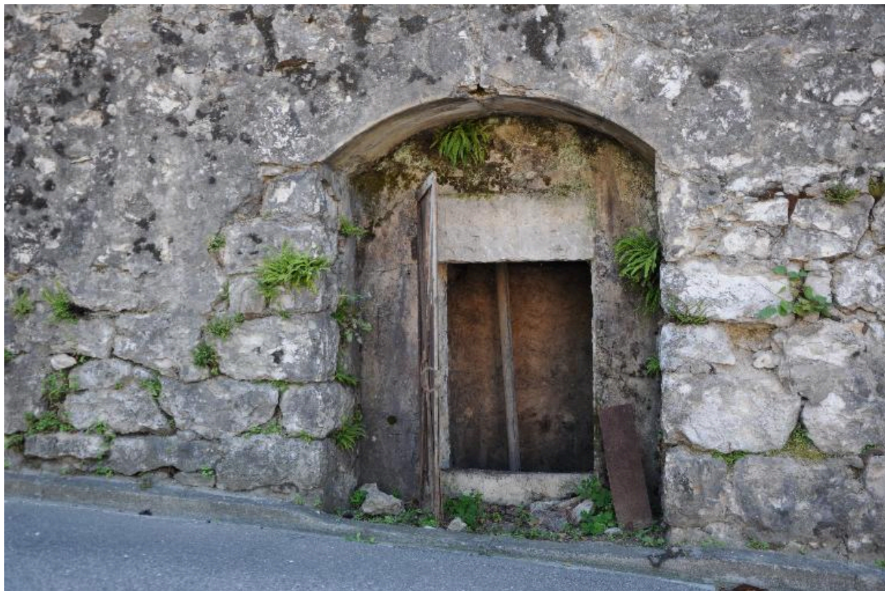
Porte d'accès à la vanne