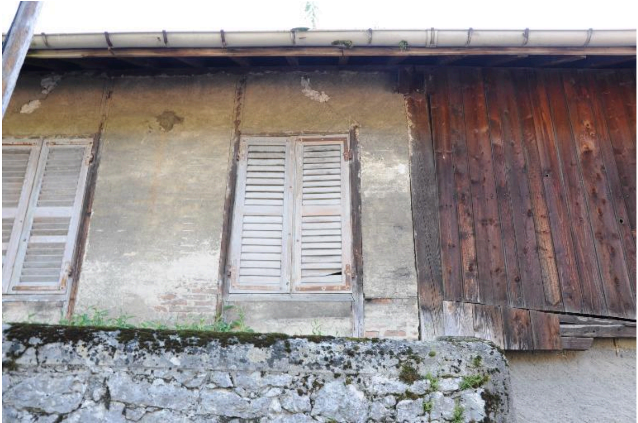
Détail de la partie supérieure de l'élévation sud