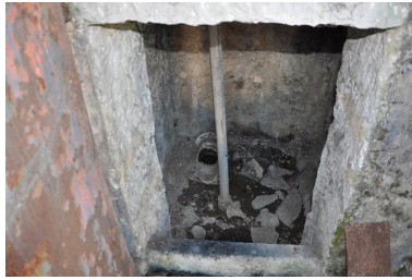
Axe de la vanne