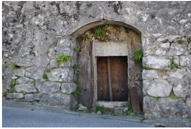
Porte d'accès à la vanne