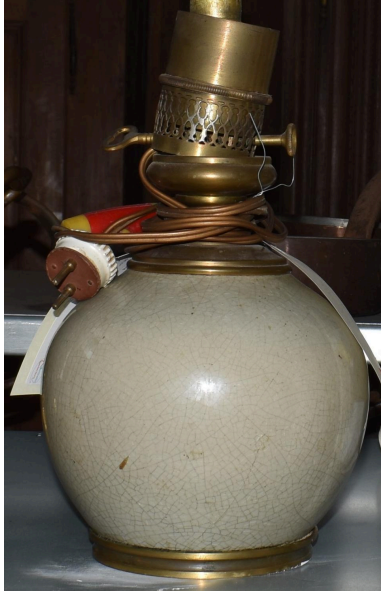
Vue générale IVR84_20226302881NUC4A