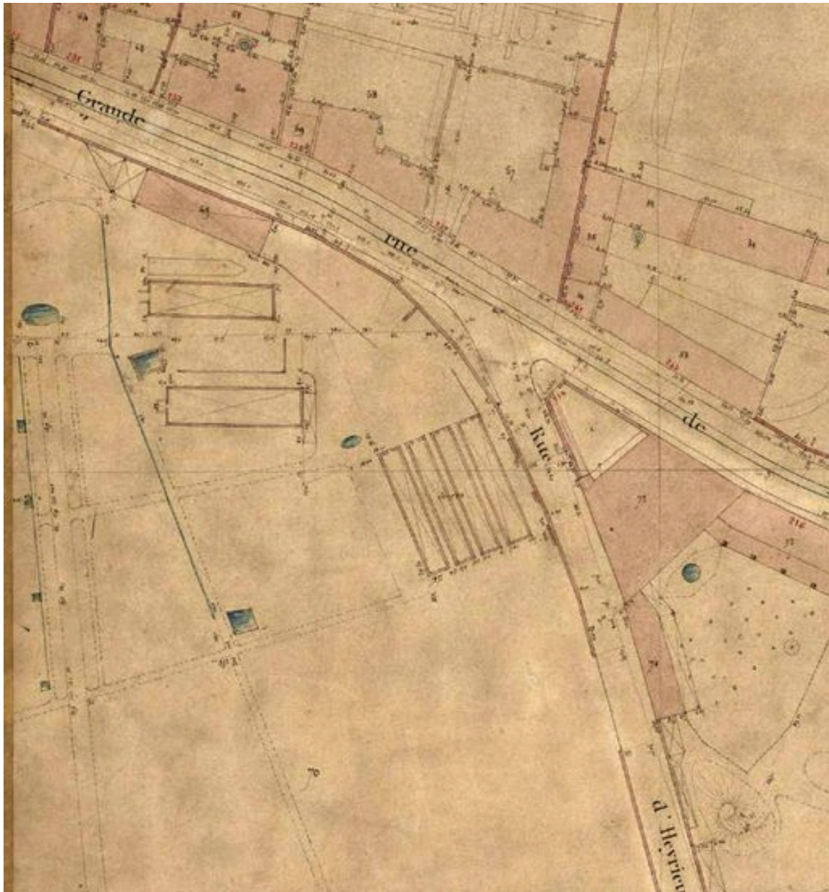
Plan général de la ville, 1885-1907, extrait