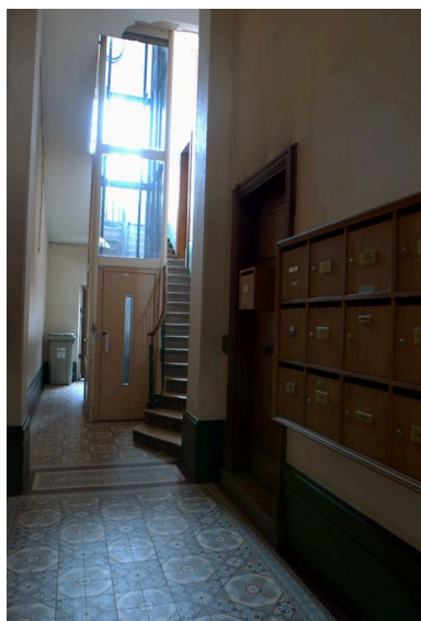
Vestibule et 1ère volée de l'escalier IVR82_20116904041NUCA