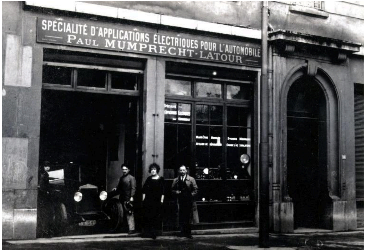
Vue du rez-de-chaussée, fotogr. anc., 1er tiers 20e siècle