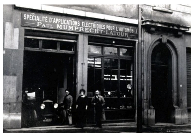
Vue du rez-de-chaussée, photogr. anc., 1er tiers 20e siècle IVR84_20166901674NUCB