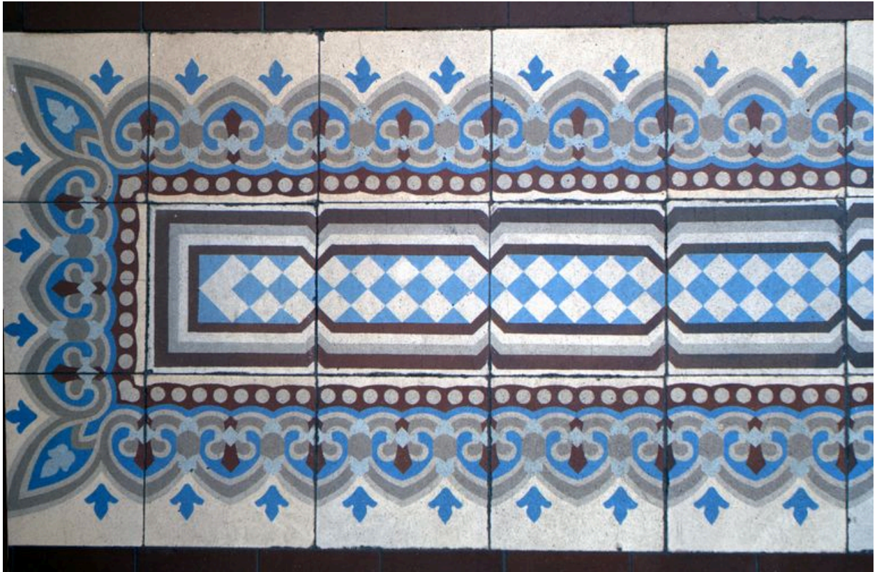
Carrelage en carreaux de ciment, détail de la frise