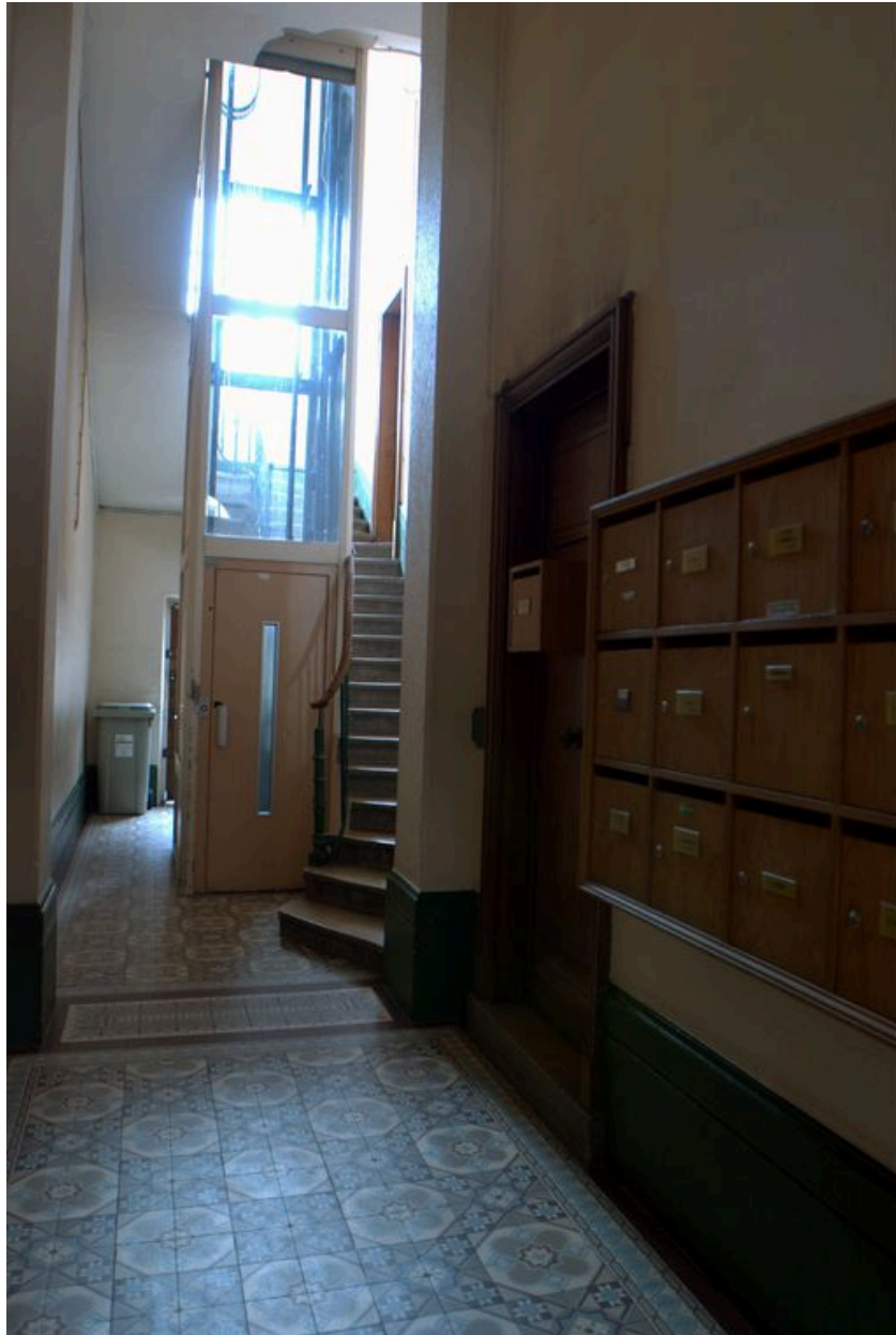
Vestibule et 1ère volée de l'escalier