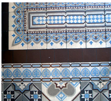
Carrelage en carreaux de ciment, vestibule