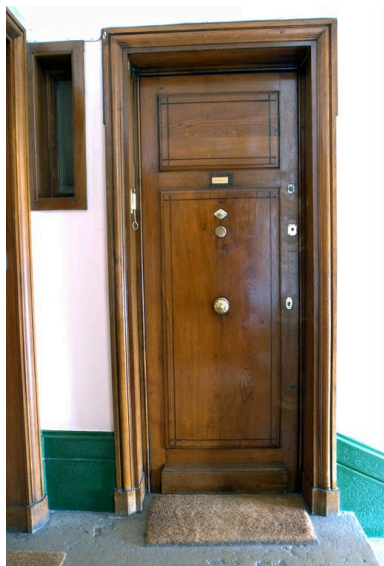
Porte palière