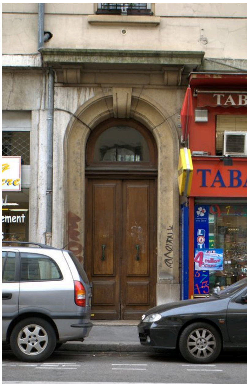
Porte sur rue