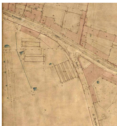
Plan général de la ville, 1885-1907, extrait (AC Lyon, 4 S 251)