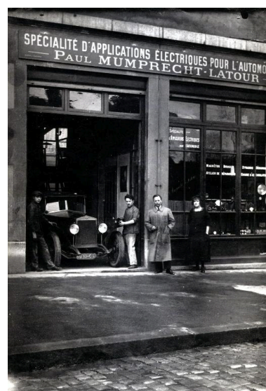
Vue du rez-de-chaussée, photogr. anc., 1er tiers 20e siècle IVR84_20166901673NUCB