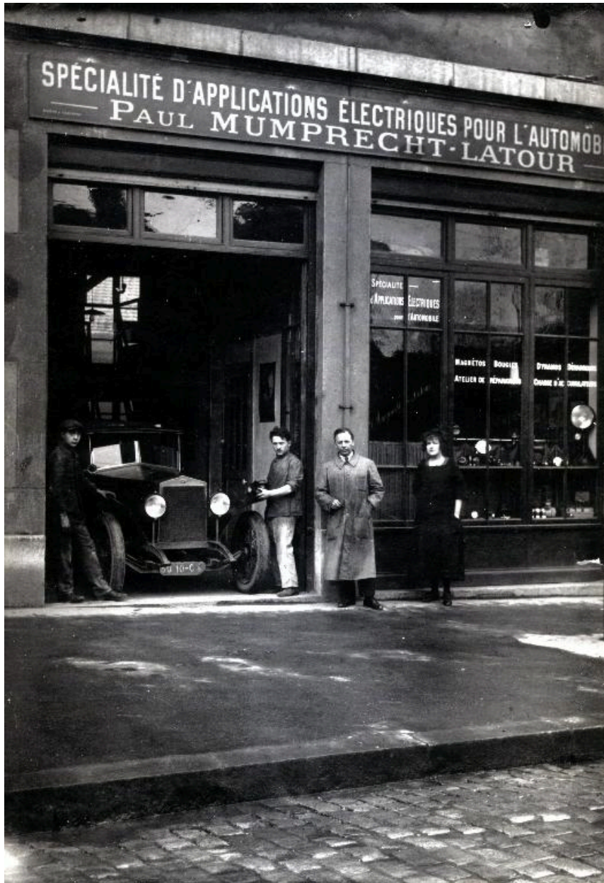
Vue du rez-de-chaussée, fotogr. anc., 1er tiers 20e siècle (AP Deguillen)