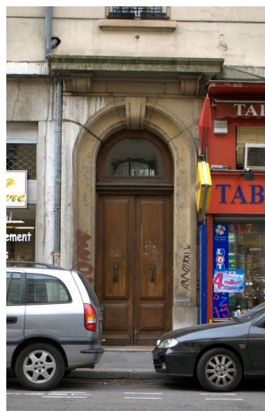
Porte sur rue IVR82_20116904040NUCA