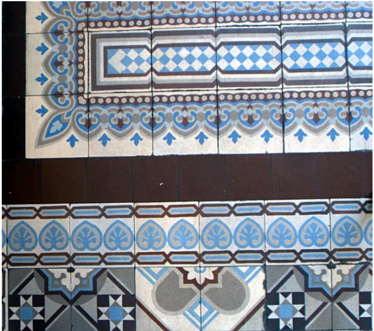
Carrelage en carreaux de ciment, vestibule