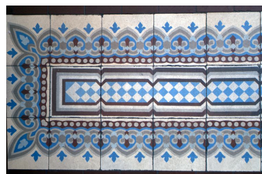
Carrelage en carreaux de ciment, détail de la frise IVR82_20116904042NUCA