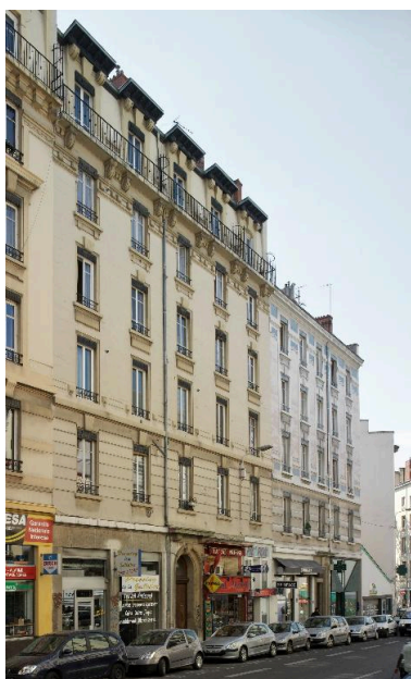
Elévation principale