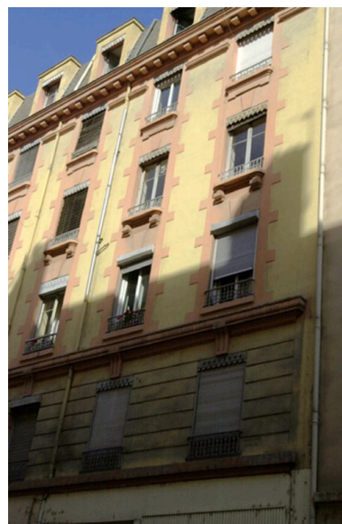
Détail de l'élévation principale IVR82_20046904691NUCA