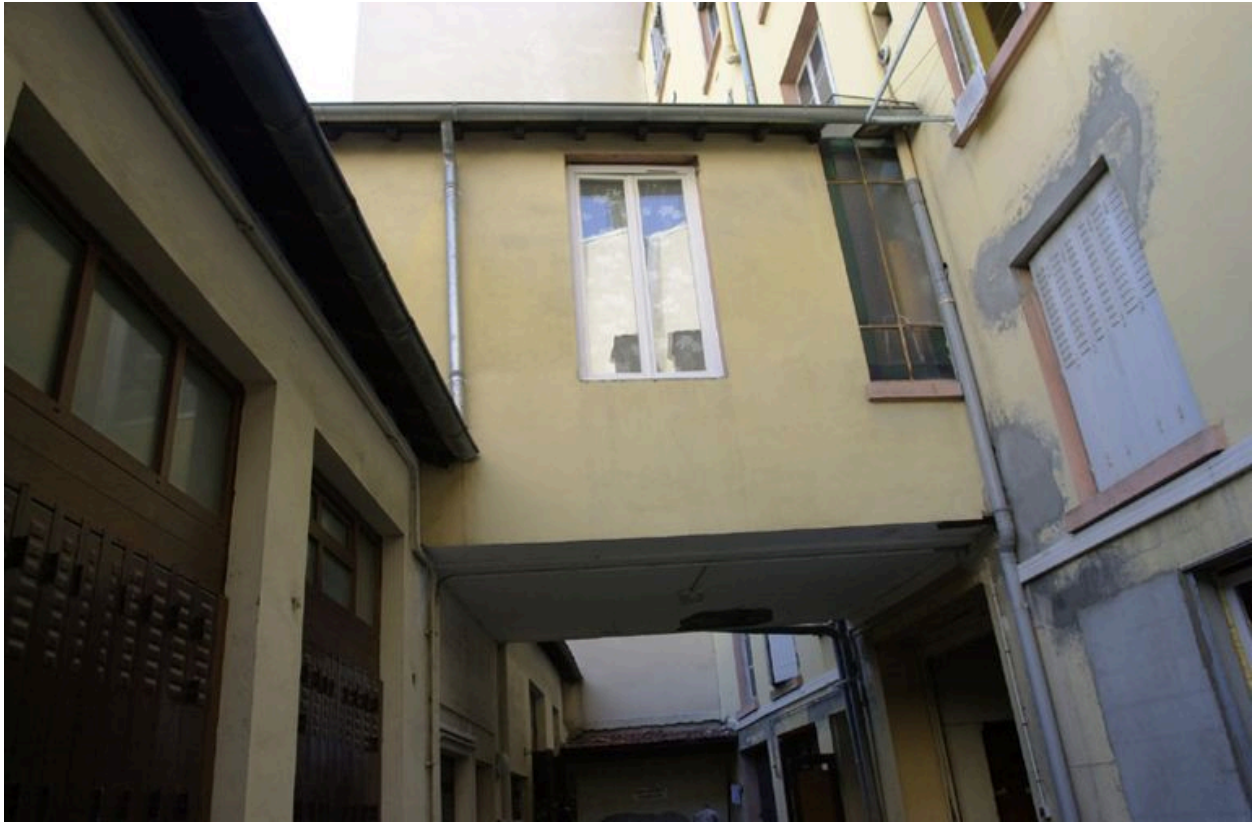
Vue de la conciergerie construite en encorbellement au-dessus de la cour