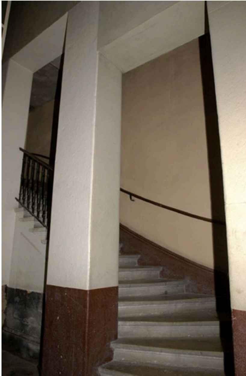
Vue du départ de l'escalier sur la droite du passage cocher