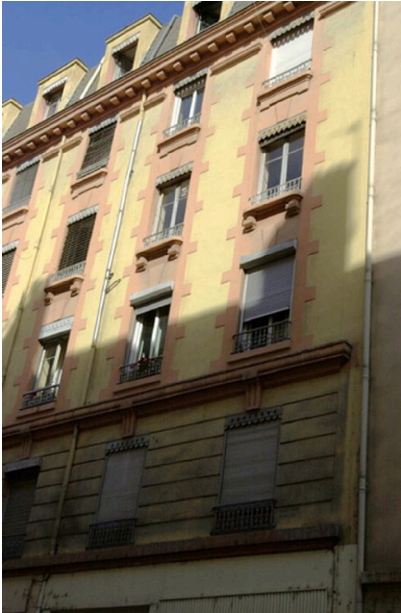
Détail de l'élévation principale