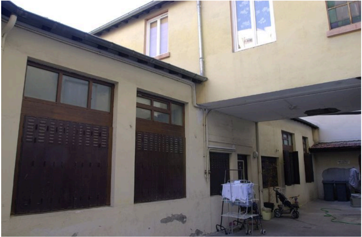
Les anciens garages en fond de cour, transformés en logements