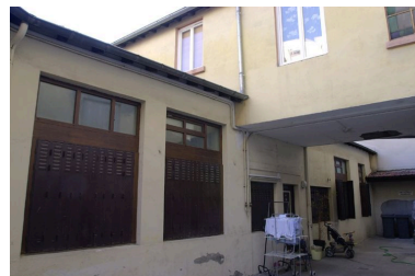
Les anciens garages en fond de cour, transformés en logements