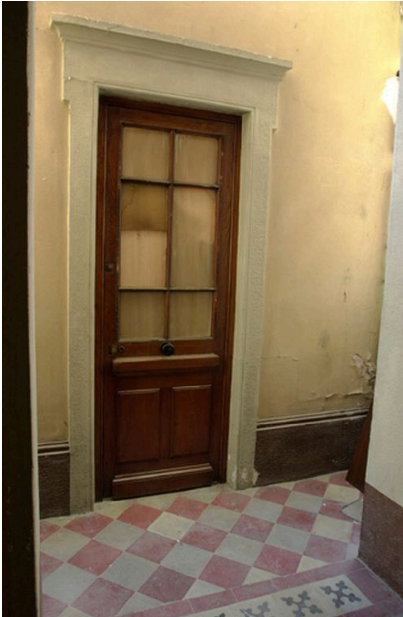
Entrée de la conciergerie au niveau du 1er repos de l'escalier