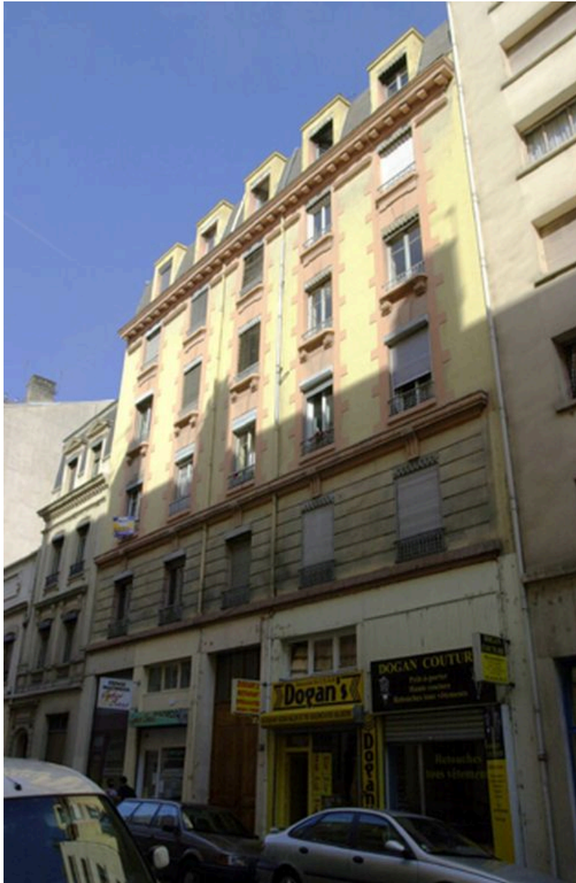
Elévation principale depuis le nord-est