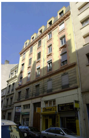
Elévation principale depuis le nord-est IVR82_20046904690NUCA