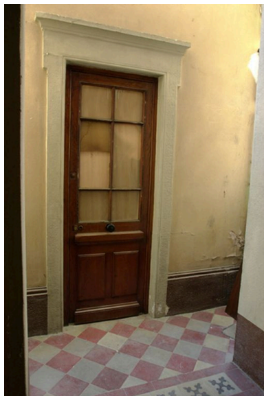
Entrée de la conciergerie au niveau du 1er repos de l'escalier

IVR82_20046904694NUCA