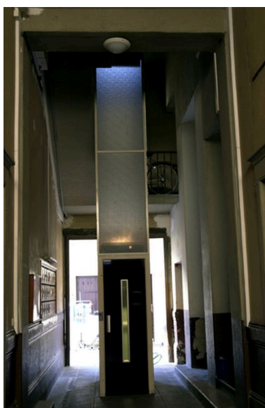
Vue du passage cocher et de l'ascenseur construit au centre IVR82_20046904692NUCA