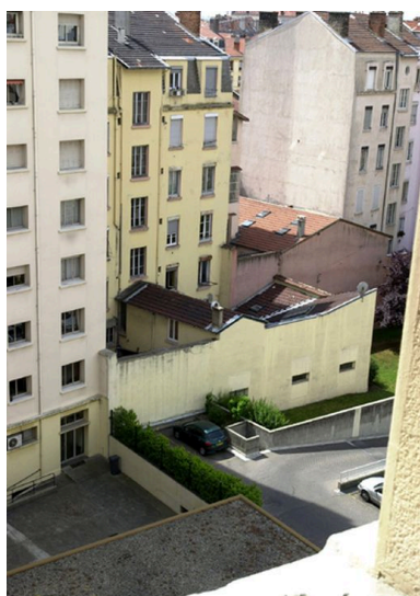
Elévation postérieure