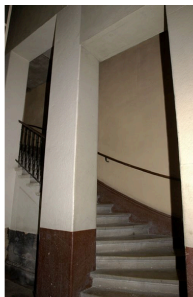
Vue du départ de l'escalier sur la droite du passage cocher IVR82_20046904693NUCA