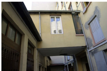
Vue de la conciergerie construite en encorbellement au-dessus de la cour

Phot. David Chevallier IVR82_20046904694NUCA