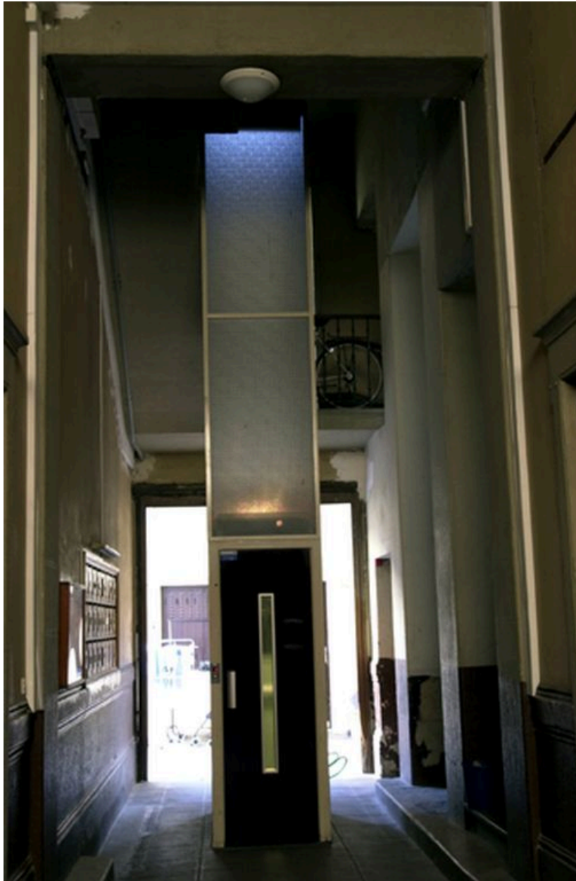
Vue du passage cochier et de l'ascenseur construit au centre