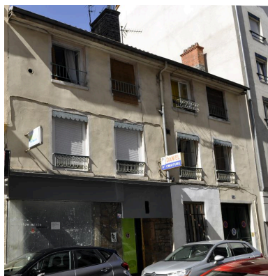
Vue générale de l'élévation sur rue IVR82_20156901257NUCA