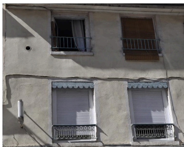
Vue rapprochée des fenêtres du 1er et du 2e étage