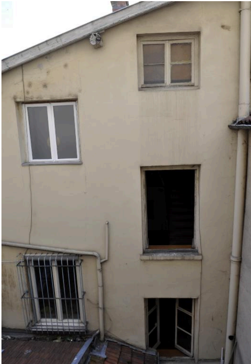
Vue partielle de la façade sur cour