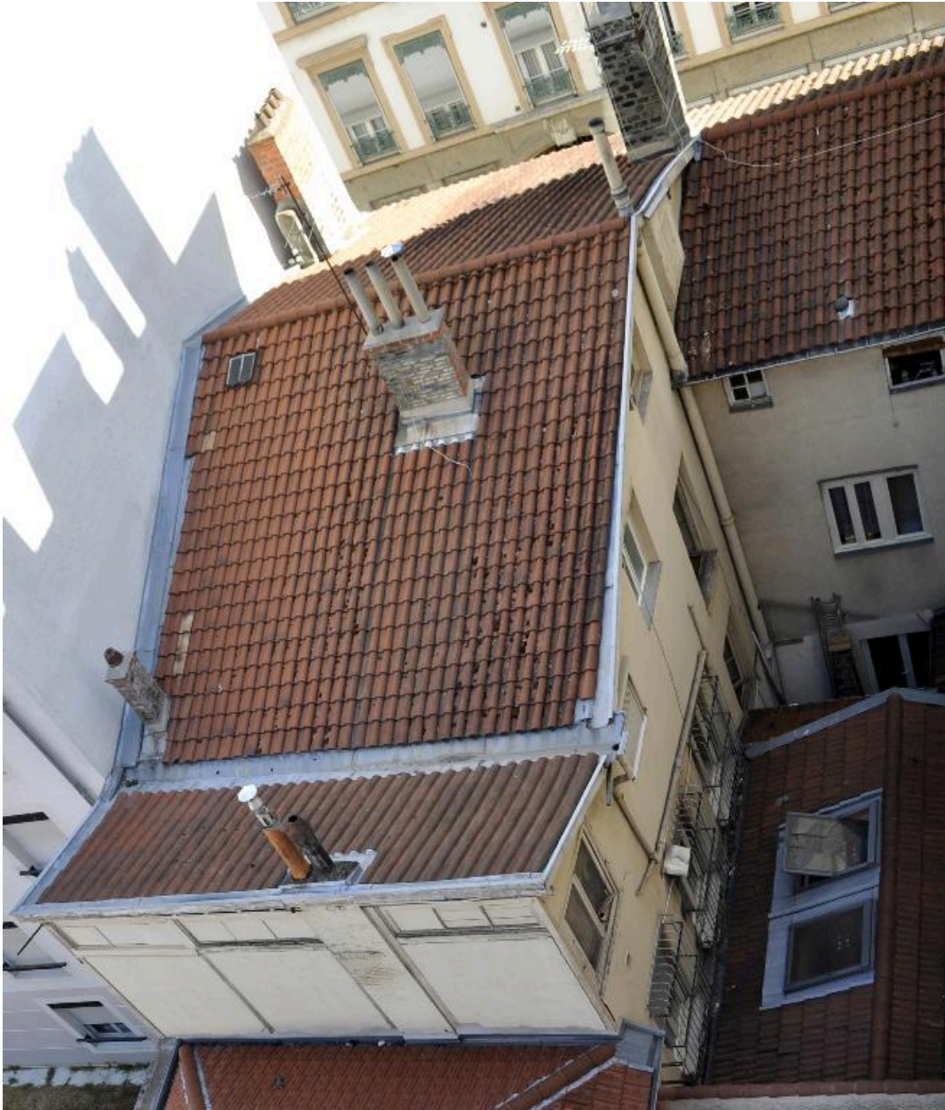
Vue de toiture : anciennes galerie et écurie au premier plan