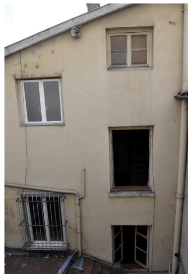
Vue partielle de la façade sur cour IVR82_20156901260NUCA