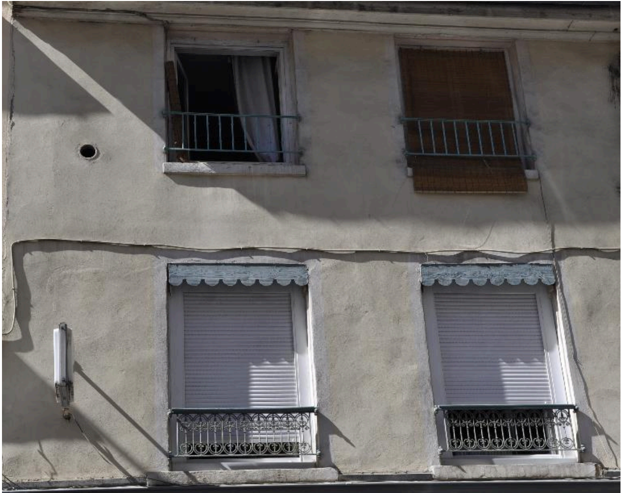
Vue rapprochée des fenêtres du 1er et du 2e étage