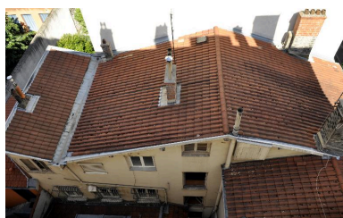
Corps de bâtiment ouest, vue latérale