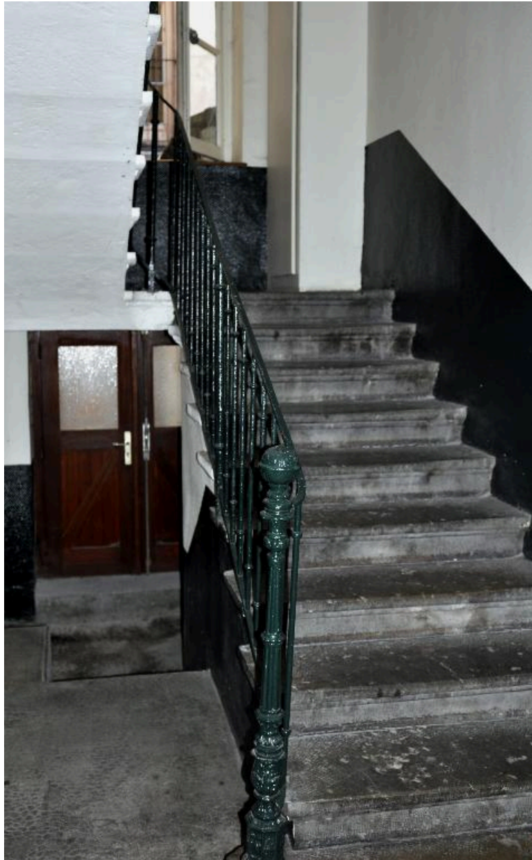
Vue intérieure : le départ de l'escalier