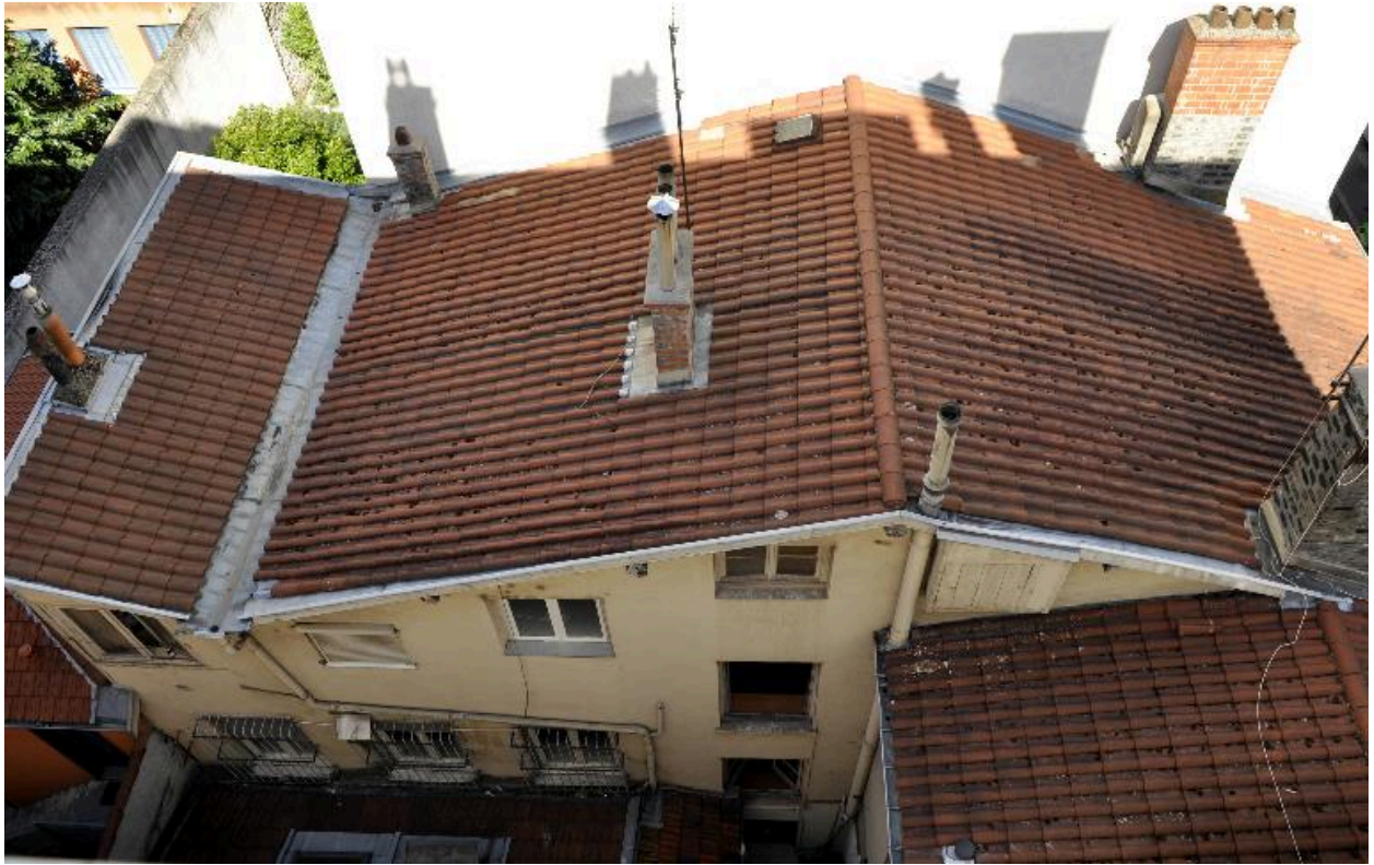
Corps de bâtiment ouest, vue latérale