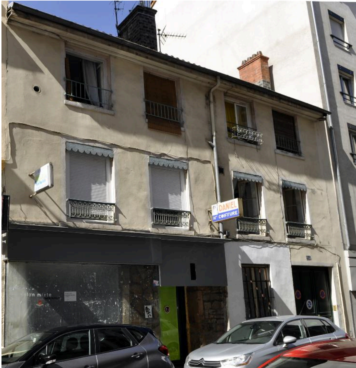
Vue générale de l'élévation sur rue