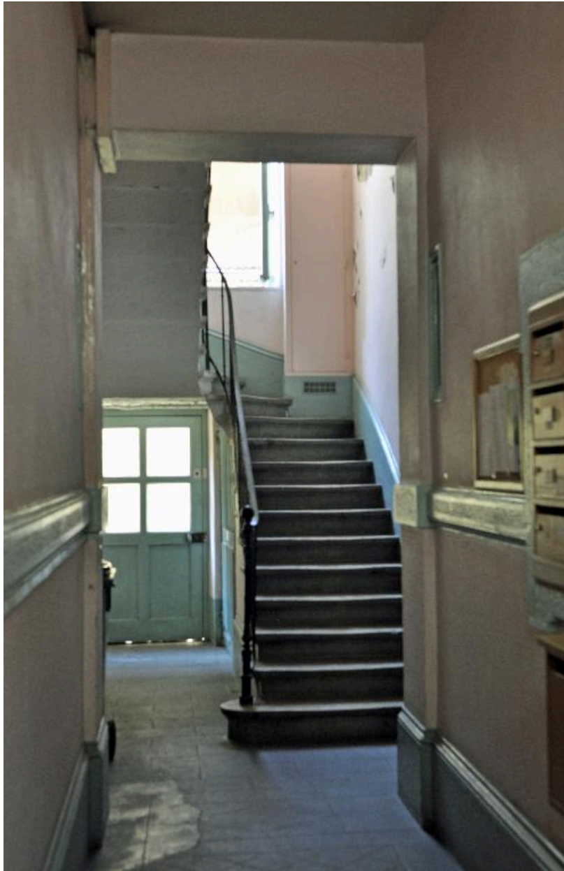
Vue intérieure : l'allée et le départ de l'escalier