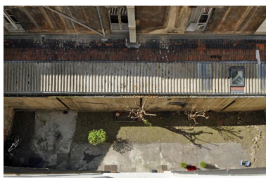
Vue plongeante sur la cour et les remises