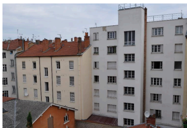
Vue générale de l'élévation sur cour (à gauche)