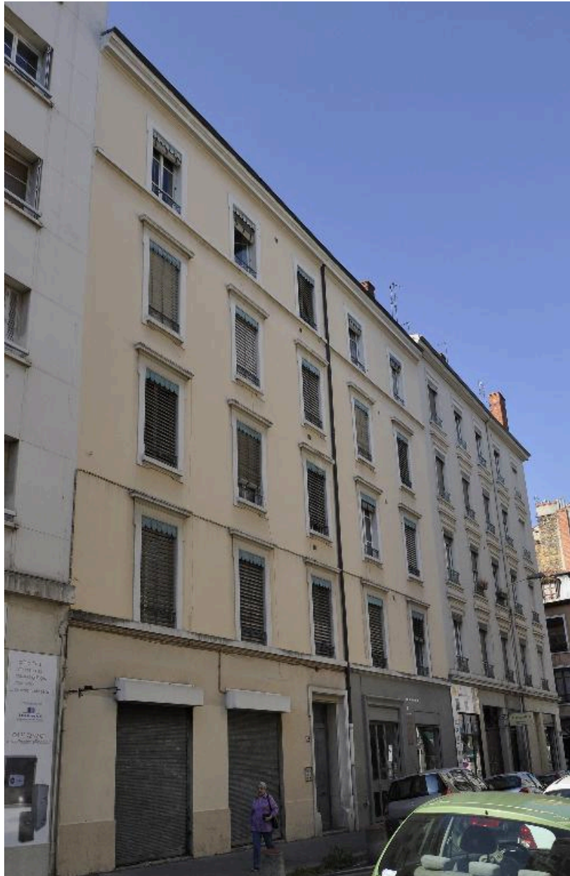
Vue générale de l'élévation sur rue