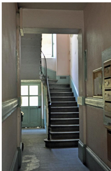
Vue intérieure : l'allée et le départ de l'escalier IVR82_20156901126NUCA