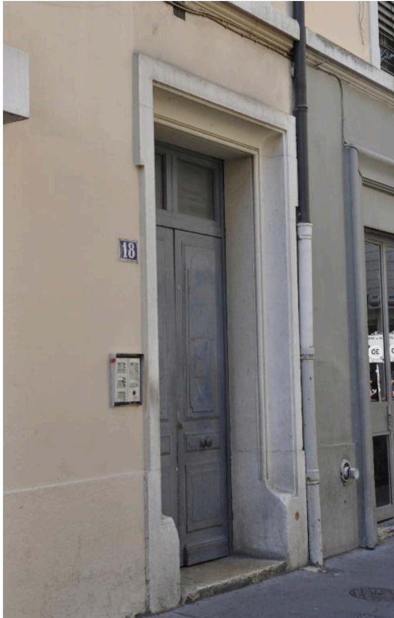
Vue rapprochée de la porte d'entrée