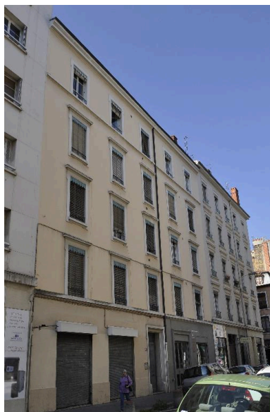
Vue générale de l'élévation sur rue