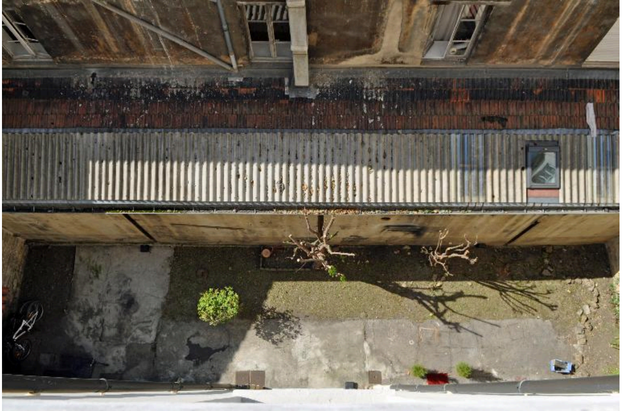
Vue plongeante sur la cour et les remises