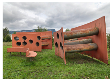
Vue d'ensemble latérale.