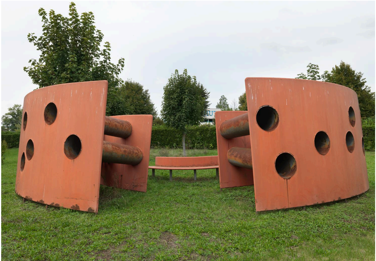
Vue d'ensemble de l'extérieur.