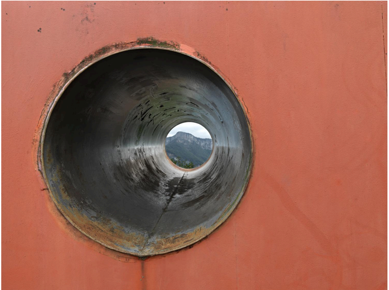
Paysage vu à travers un tuyau d'observation.