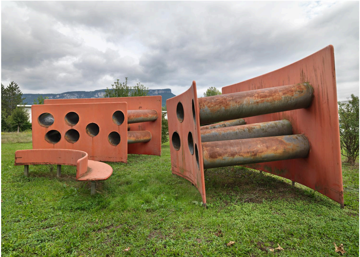
Vue d'ensemble latérale.