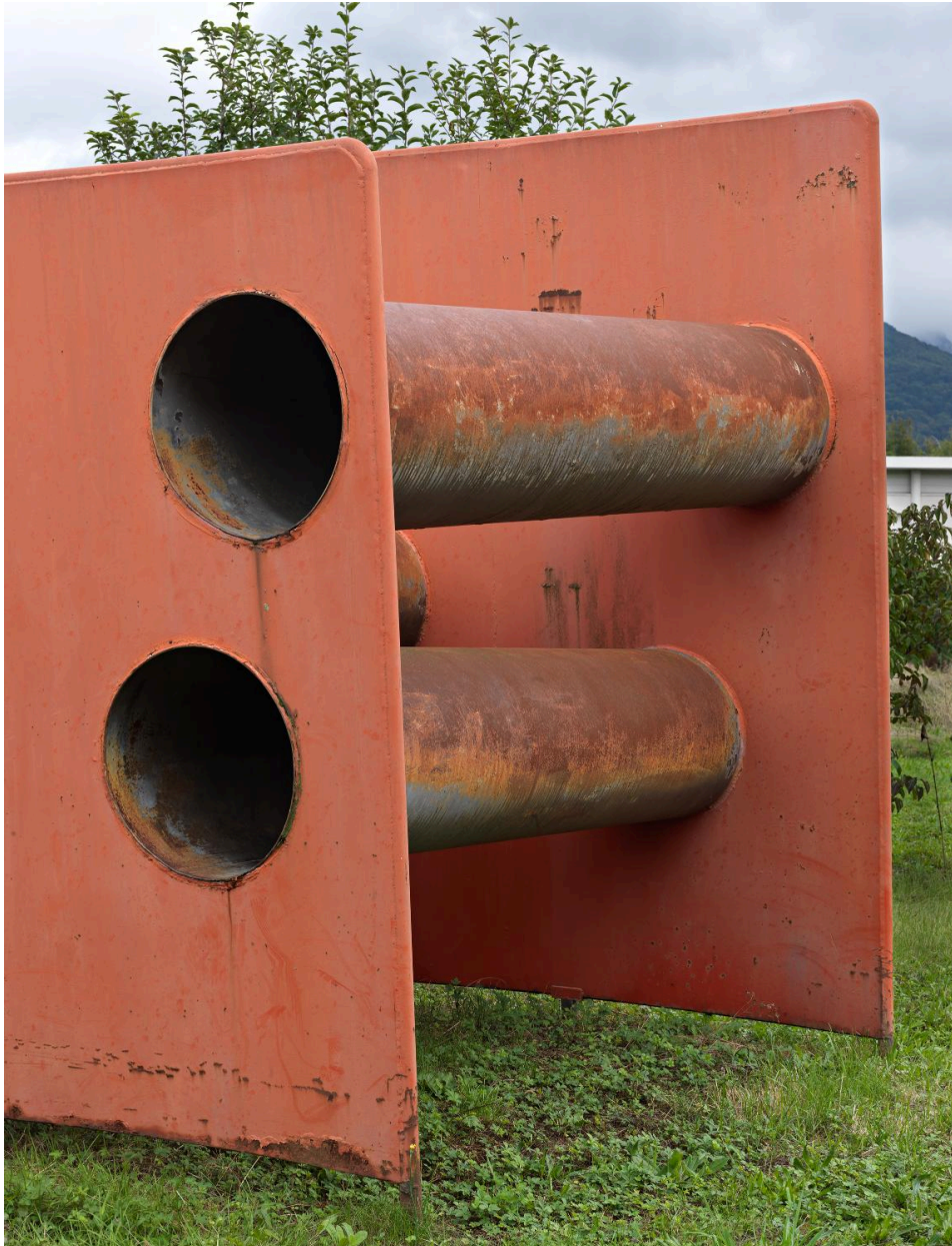
Vue rapprochée sur le côté.