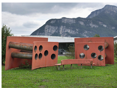
L'installation dans son ensemble.