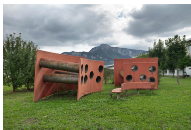
Vue d'ensemble. IVR84_20203800403NUCAQ