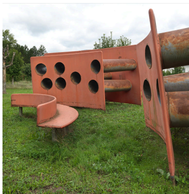
Vue latérale rapprochée. IVR84_20203800419NUCAQ