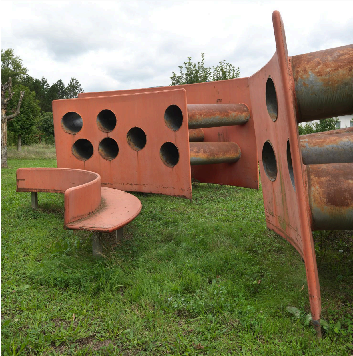
Vue latérale rapprochée.