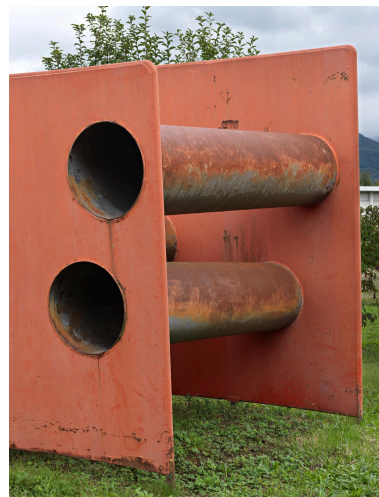
Vue rapprochée sur le côté. IVR84_20203800407NUCAQ