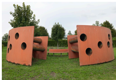
Vue d'ensemble de l'extérieur. IVR84_20203800418NUCAQ