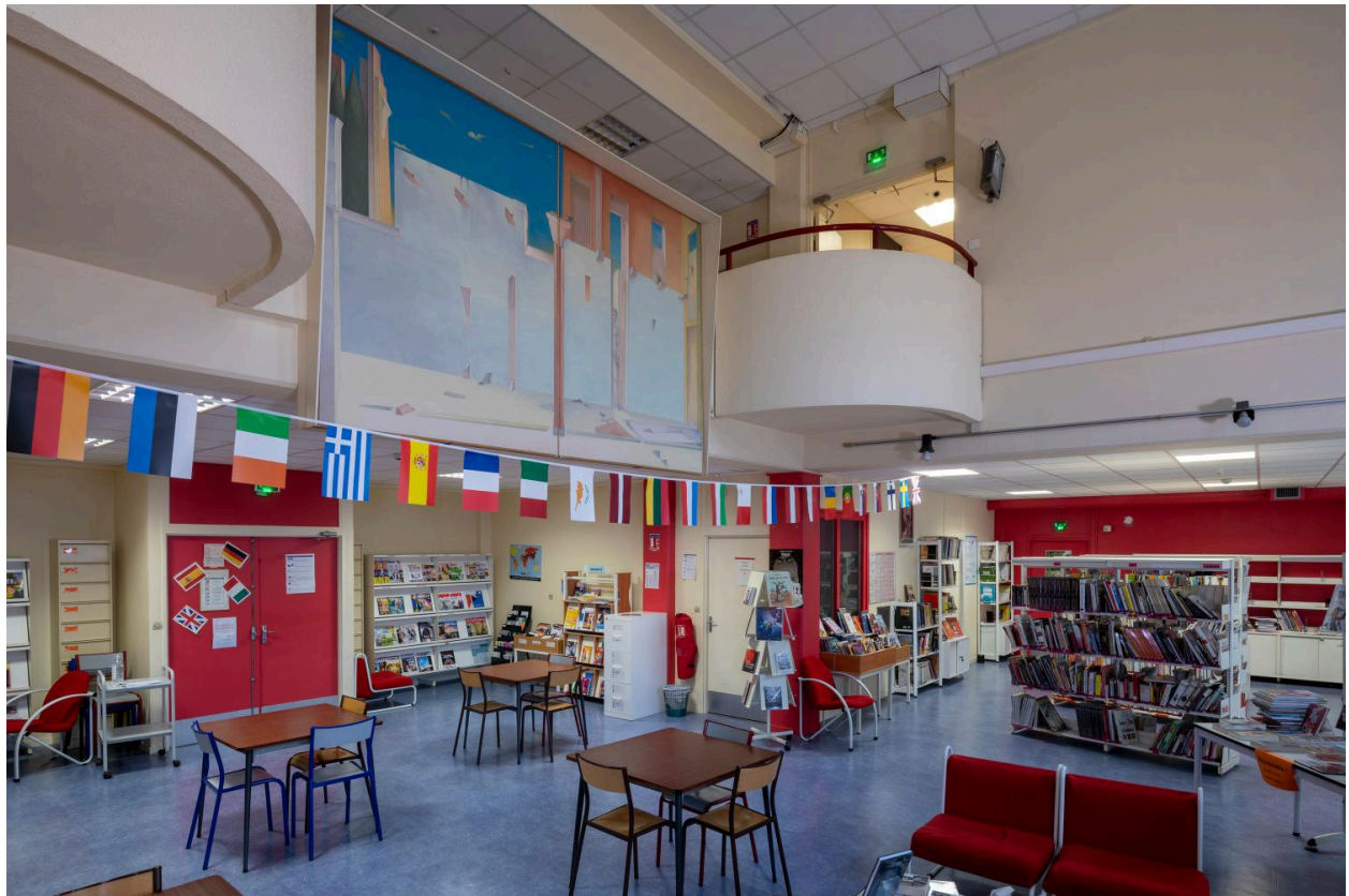
L'œuvre dans son environnement.