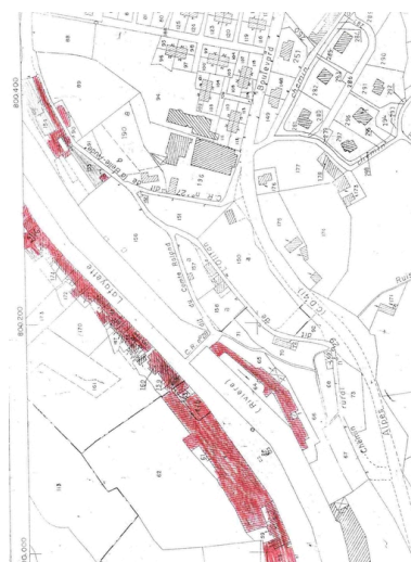
Cadastre 1977, vue d'ensemble cours Lafayette IVR82_20123800193NUCA