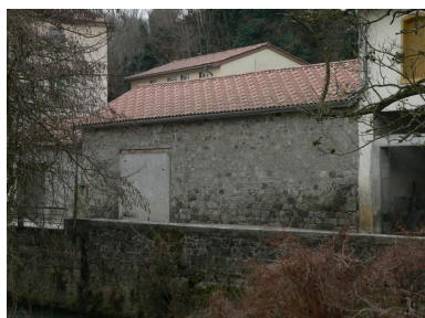
Façade sur rue IVR82_20073800175NUCA