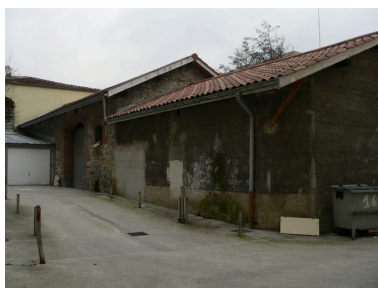
Façade arrière