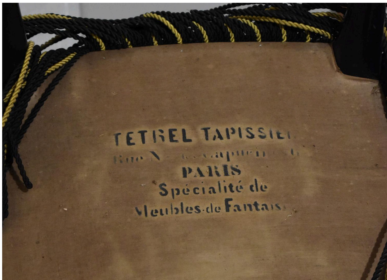
Inscription de fabricant