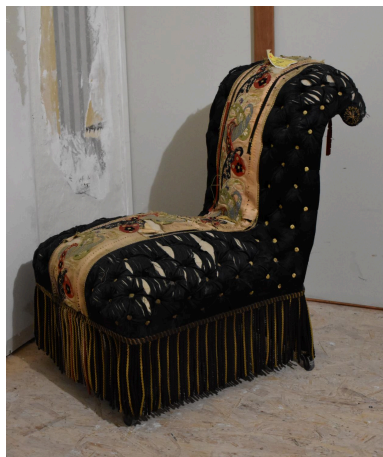
Vue générale IVR84_20216301581NUC4A