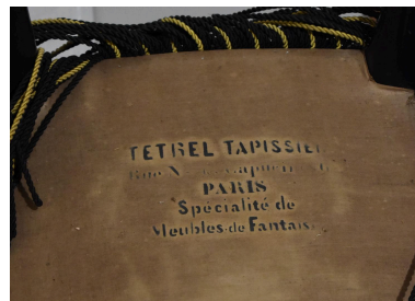
Inscription de fabricant IVR84_20216301583NUC4A