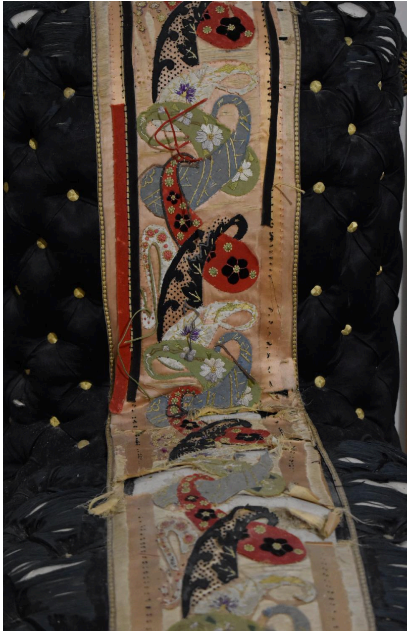
Détail de l'assise