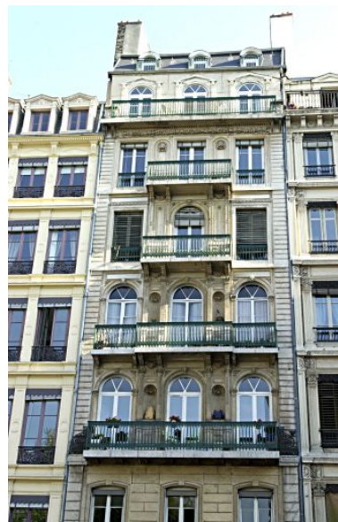
Façade sur rue, détail de l'élévation IVR82_20046900404NUCA