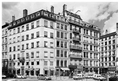
Vue générale des façades de l'îlot sur la place d'Albon IVR82_20046900832P