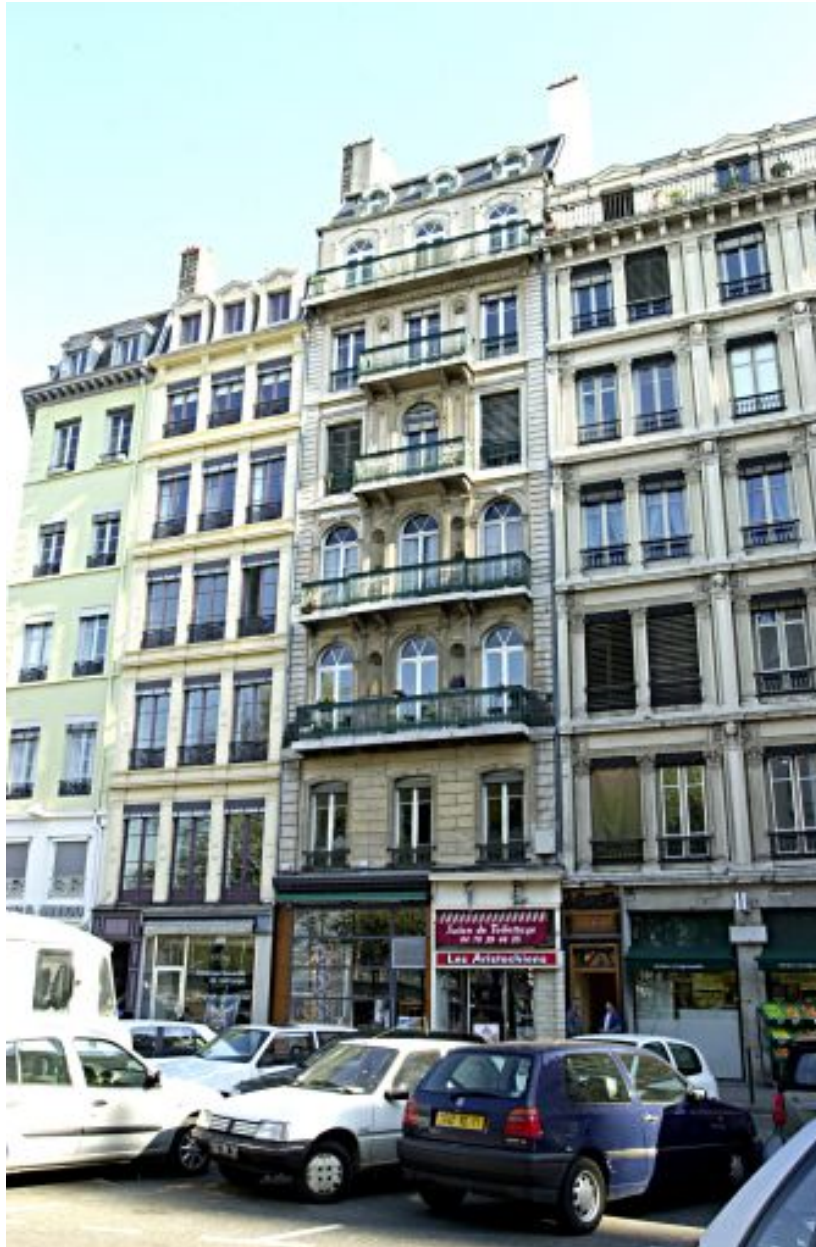
Façade sur rue, vue générale