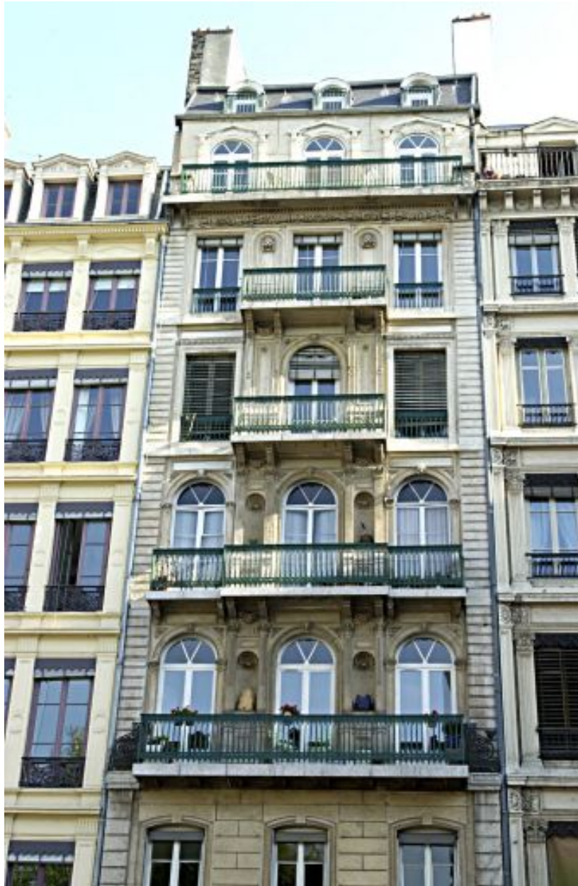
Façade sur rue, détail de l'élévation