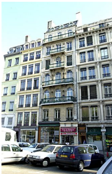
Façade sur rue, vue générale IVR82_20046900403NUCA