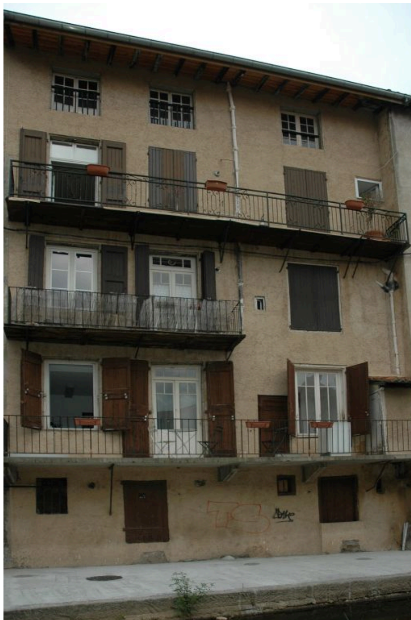
Elévation postérieure donnant sur le quai du Vizézy.