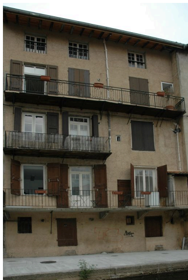
Elévation postérieure donnant sur le quai du Vizézy. IVR82_20134200541NUCA