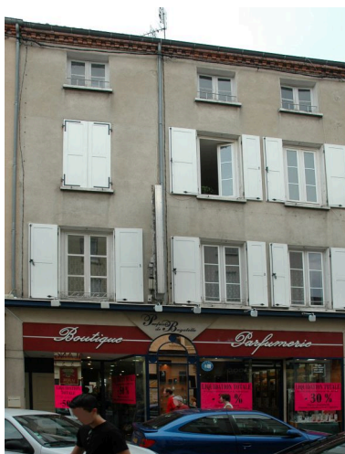
Vue générale sur la rue Tupinerie.