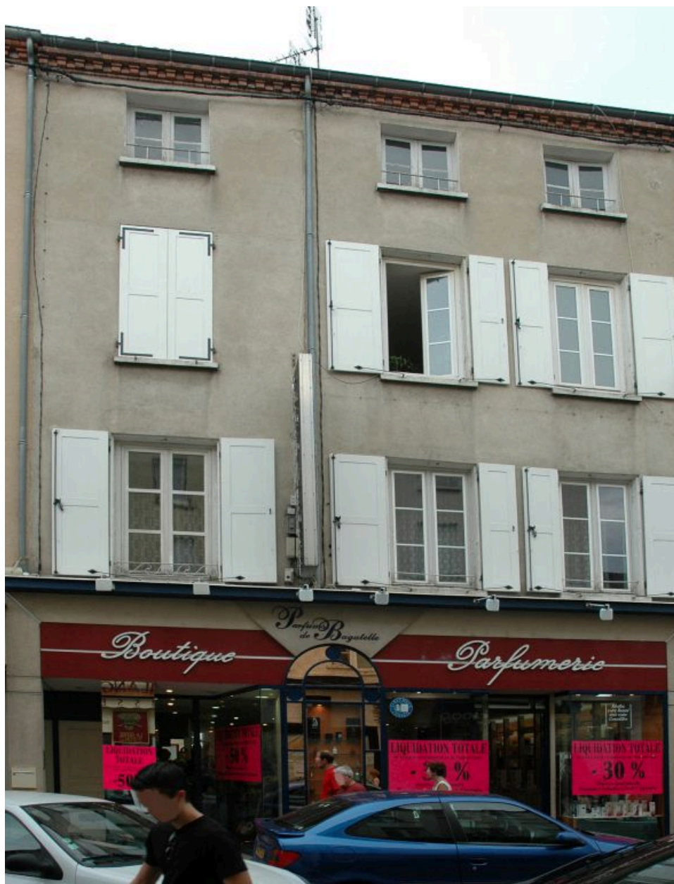
Vue générale sur la rue Tupinerie.