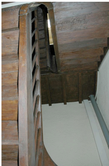
Vue partielle des volées d'escalier, du bas vers le haut. IVR82_20134200543NUCA