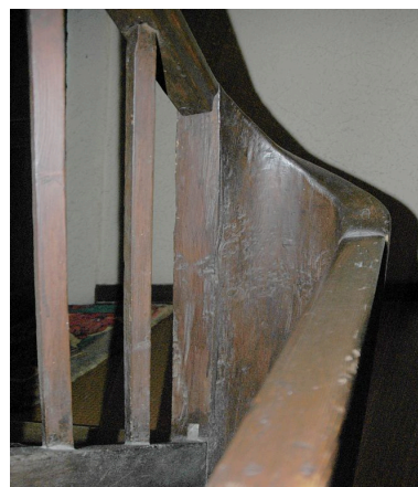
Escalier tournant à retours avec jour, détail d'un retour en bois plein. IVR82_20134200542NUCA