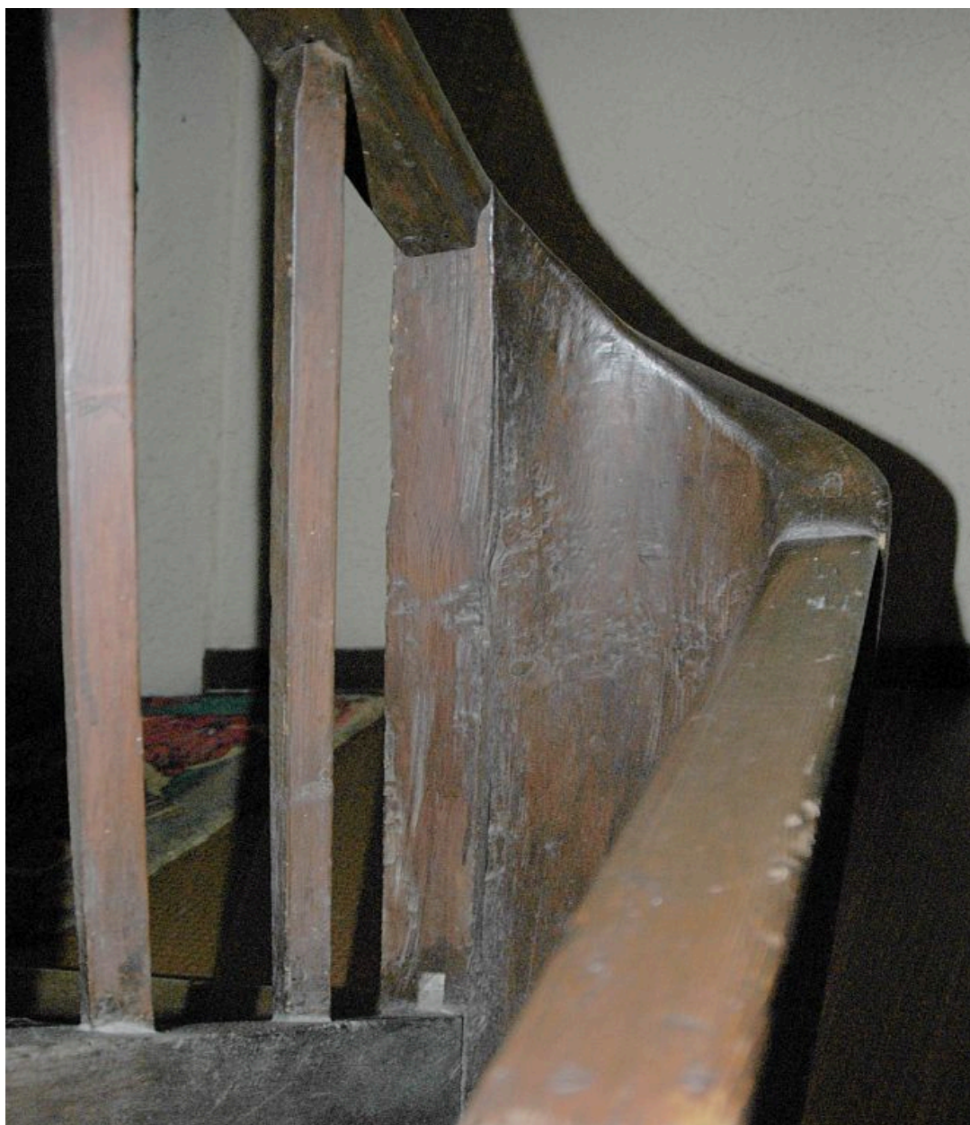
Escalier tournant à retours avec jour, détail d'un retour en bois plein.