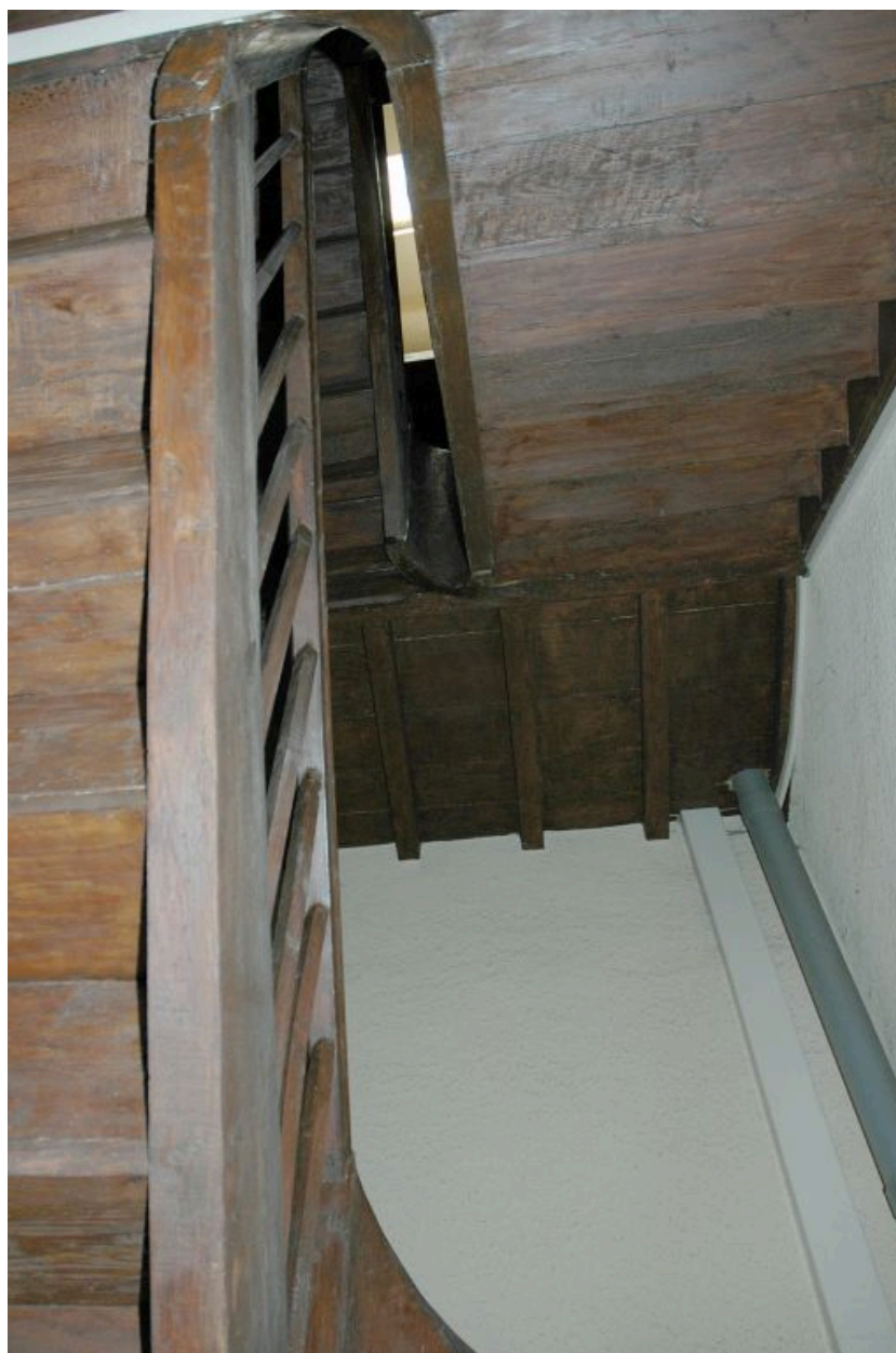
Vue partielle des volées d'escalier, du bas vers le haut.