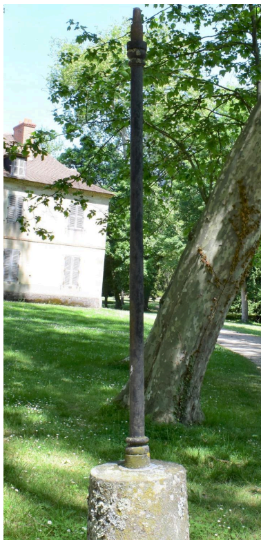
Vue générale d'un candélabre IVR84_20226300796NUCA