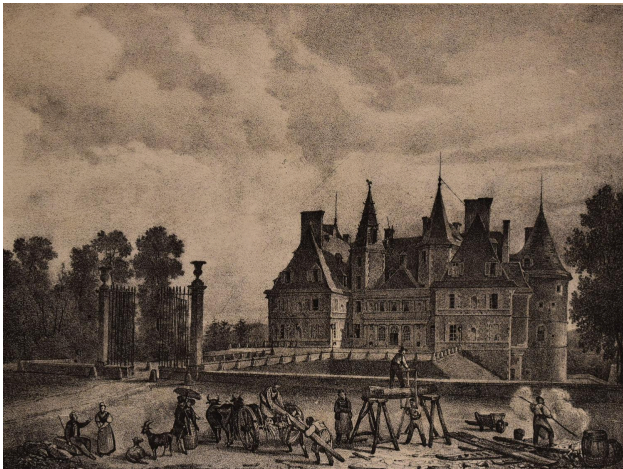
Lithographie d'Ernest Jaime d'après un dessin de Louis Atthalin