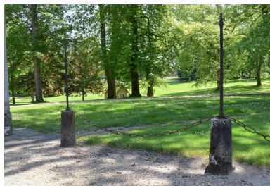
Vue générale IVR84_20226300794NUCA