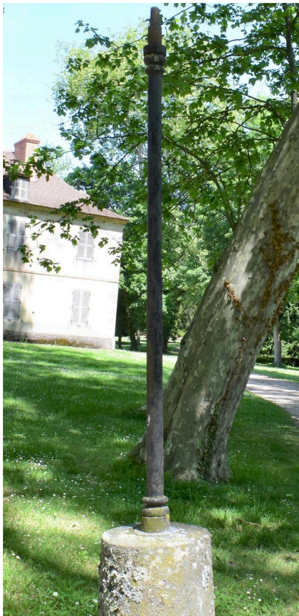
Vue générale d'un candélabre