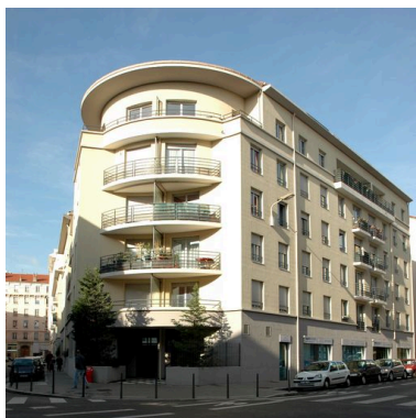
Vue générale depuis le sud IVR82_20076900382NUCA