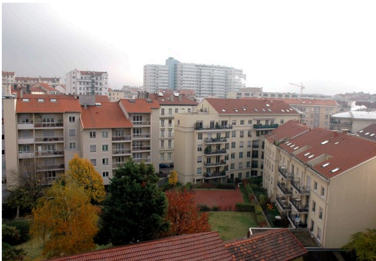
Elévation postérieures et jardin