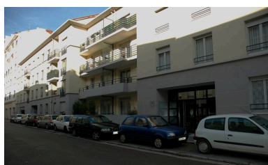
Elévation, rue Alphonse-Daudet