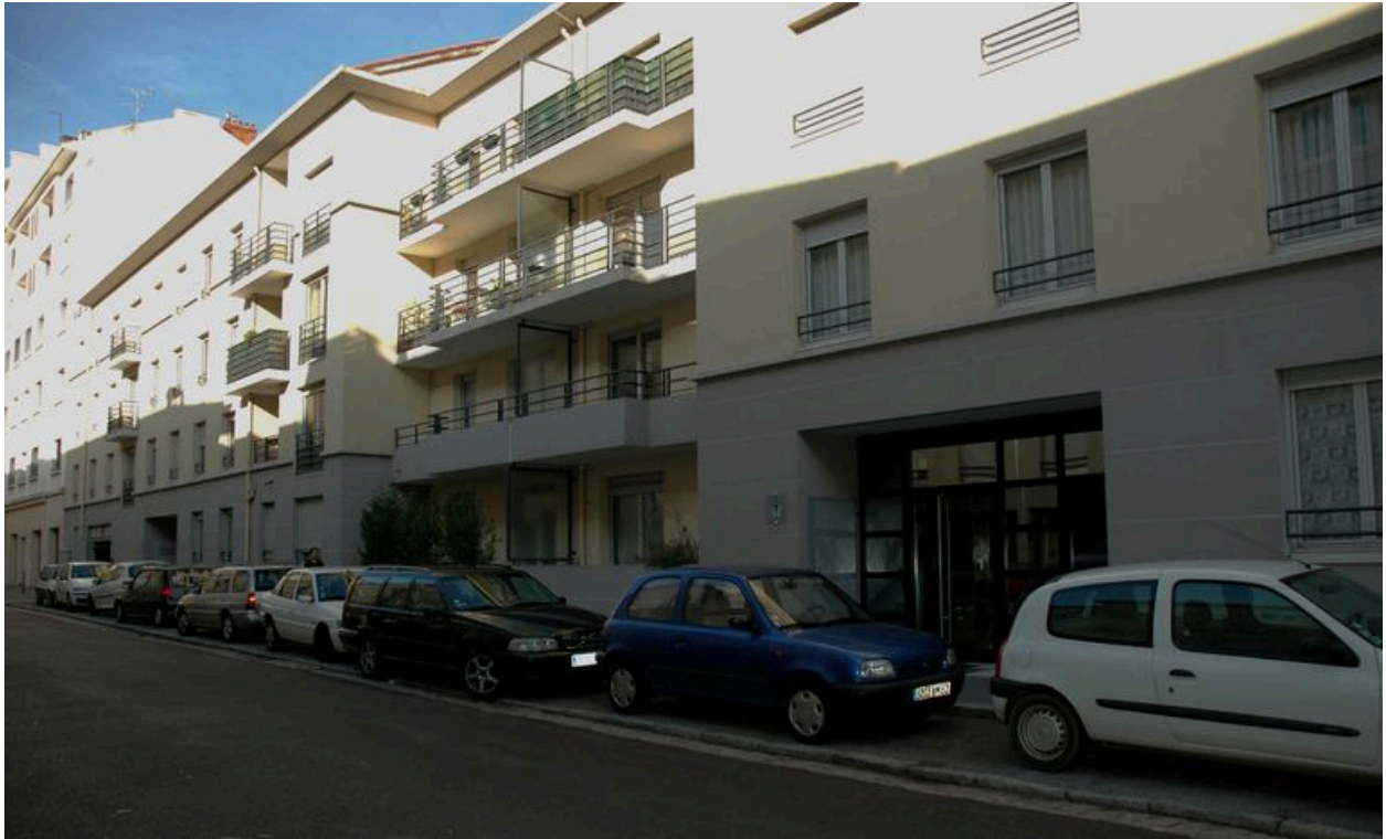
Elévation, rue Alphonse-Daudet