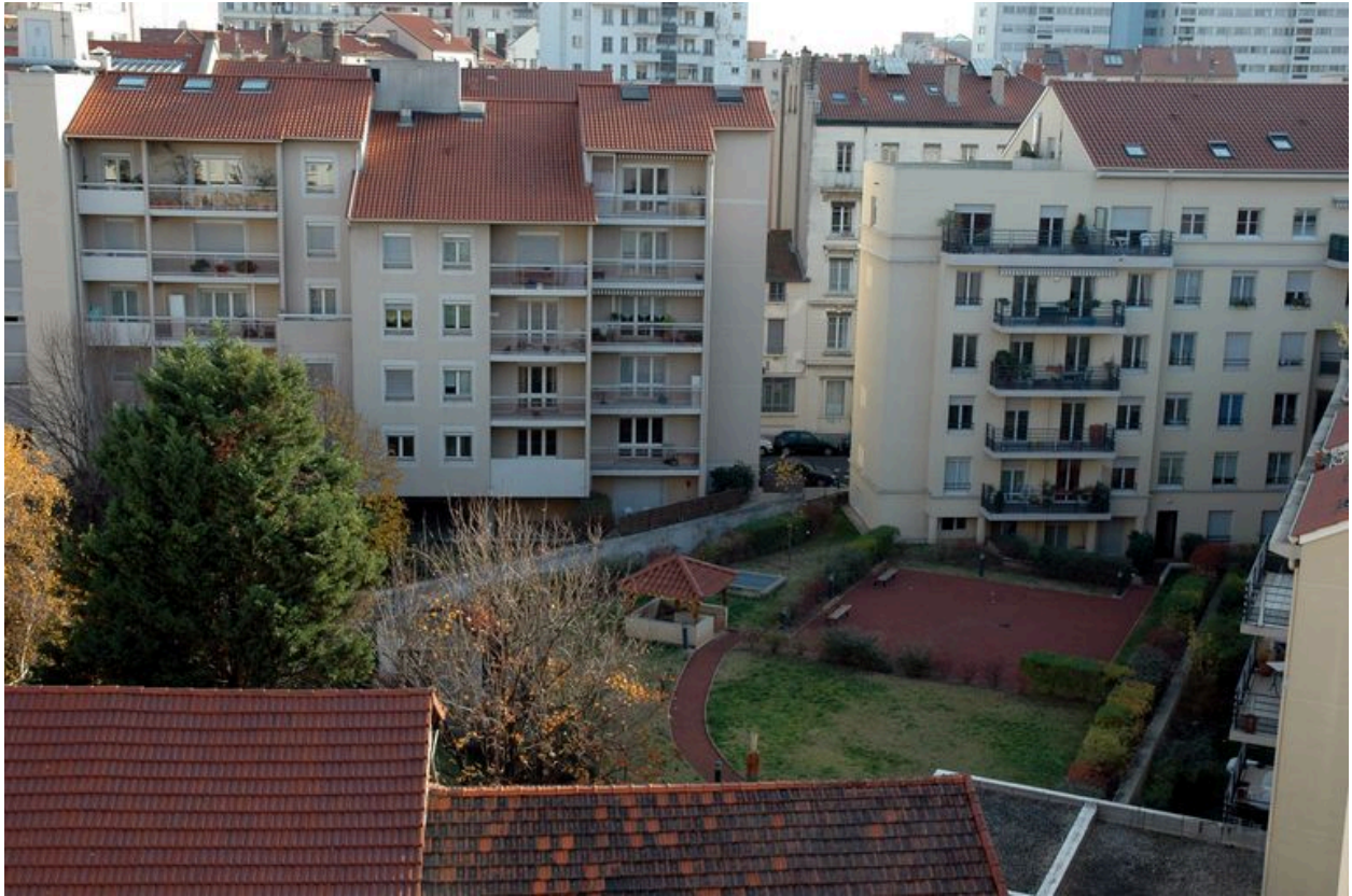
Vue du jardin