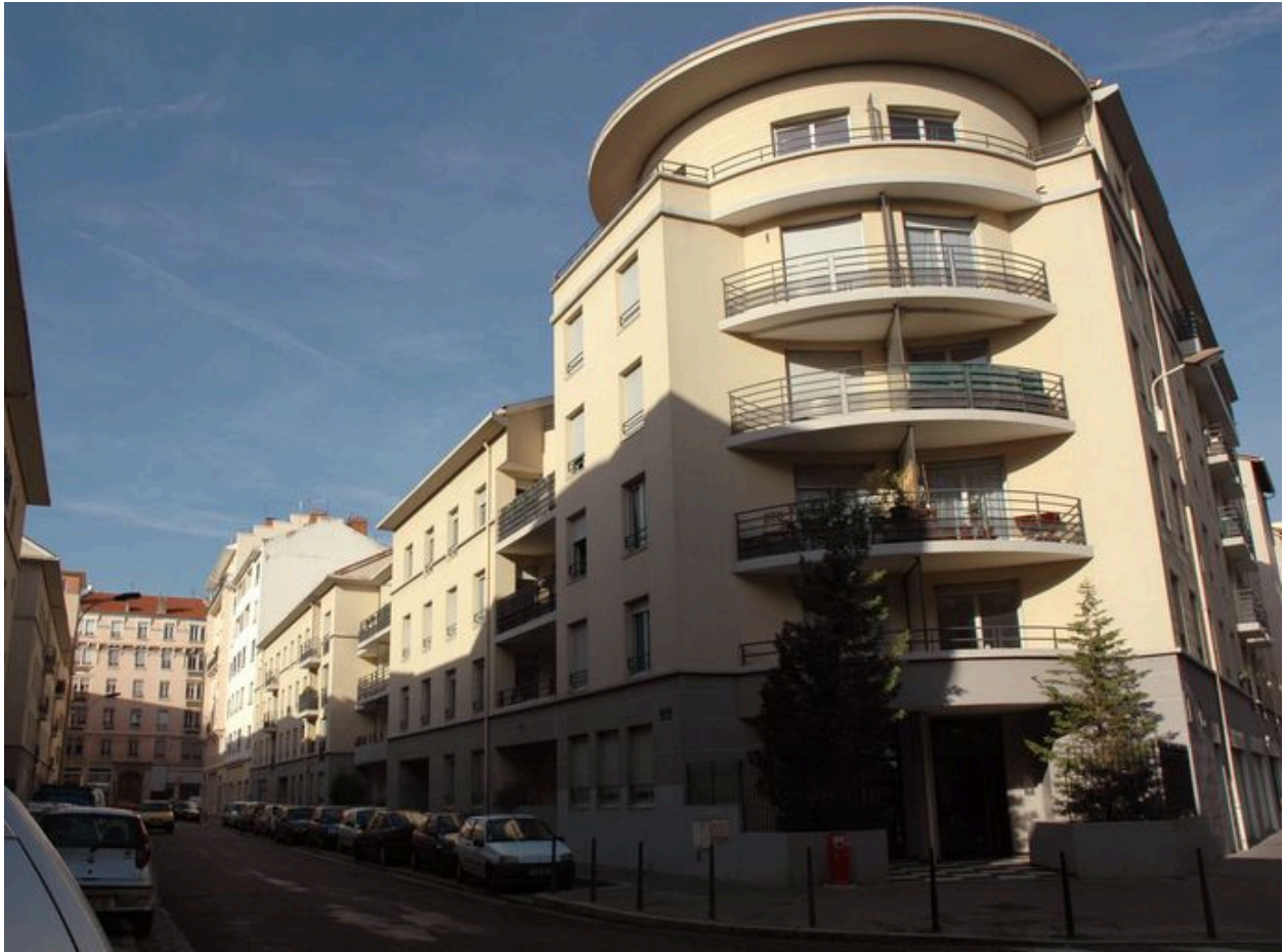
Vue d'ensemble vers l'ouest, rue Alphonse-Daudet