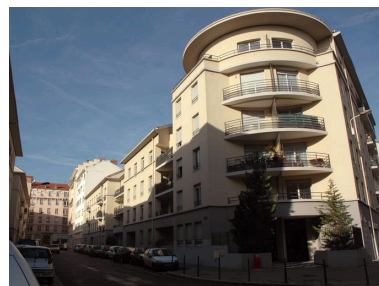
Vue d'ensemble vers l'ouest, rue Alphonse-Daudet IVR82_20076900383NUCA