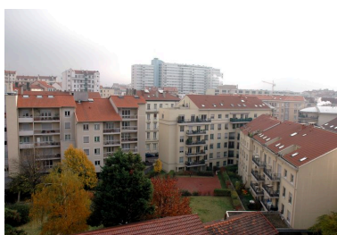
Elévation postérieures et jardin