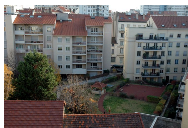
Vue du jardin IVR82_20076900447NUCA