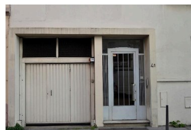
Élévation sur rue : porte piétonne et porte cochère