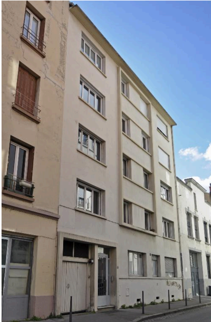
Vue générale, élévation sur rue