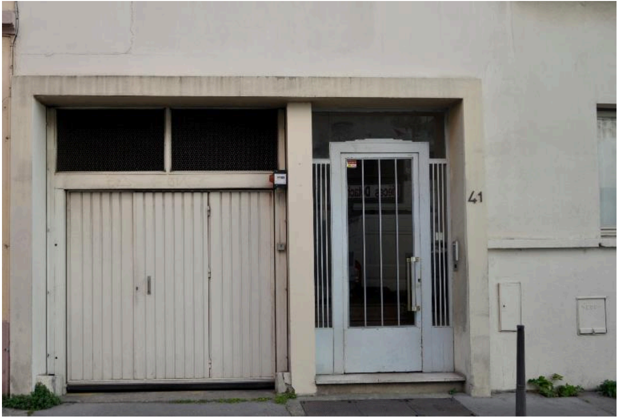
Elévation sur rue : porte piétonne et porte cochère