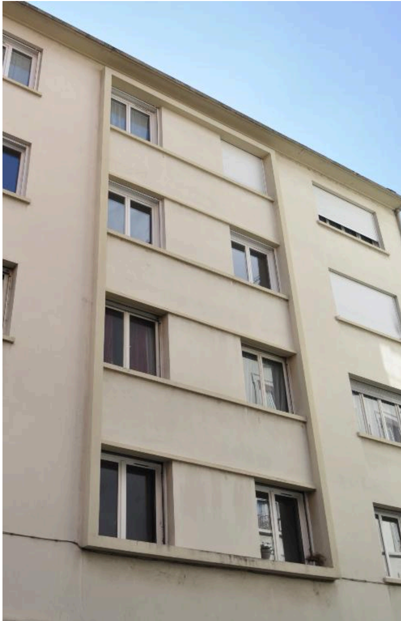
Elévation sur rue : effets de bandeaux saillants encadrant les travées centrales