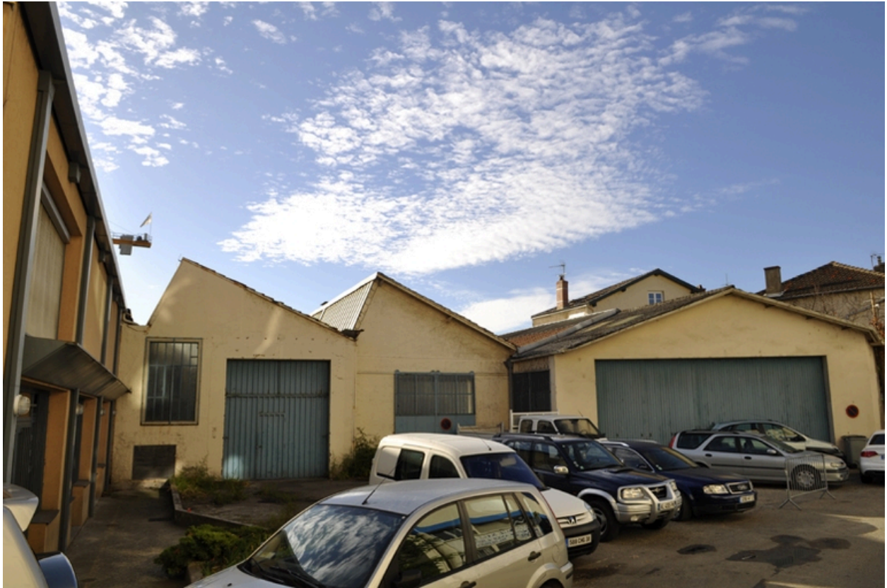
Vue d'ensemble est