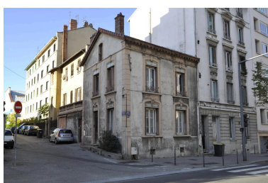
Bureaux d'entrée et maison du gardien