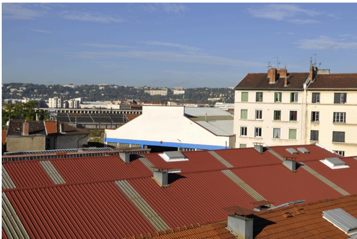
Vue zénithale est