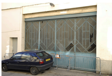
Détail portail