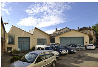
Vue d'ensemble sud IVR82_20106900497NUCA