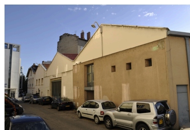
Façades sud du site IVR82_20106900498NUCA