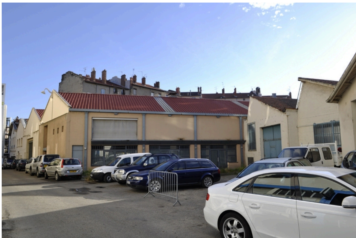
Vue d'ensemble sud