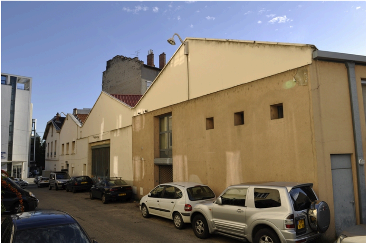
Façades sud du site