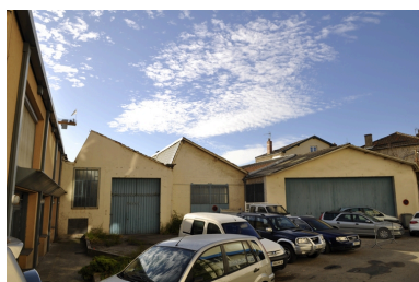
Vue d'ensemble est IVR82_20106900496NUCA