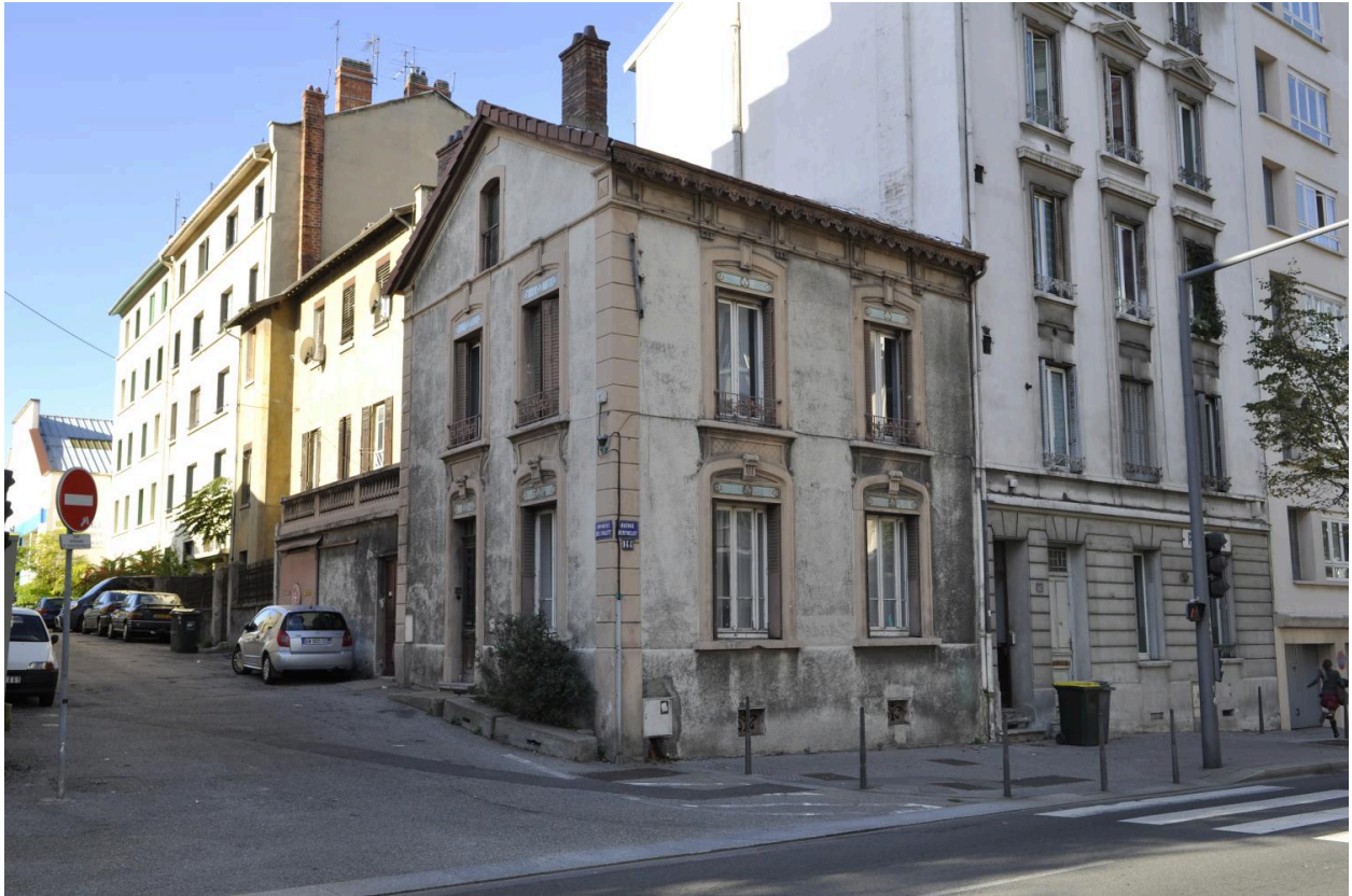
Bureaux d'entrée et maison du gardien