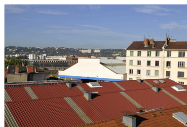
Vue zénithale est IVR82_20106900510NUCA