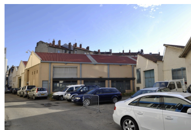
Vue d'ensemble sud IVR82_20106900495NUCA