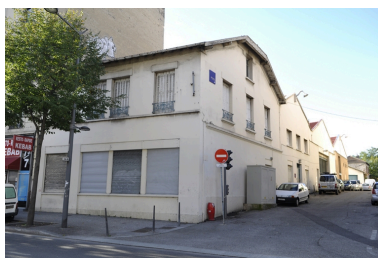
Vue générale sud-est IVR82_20106900501NUCA