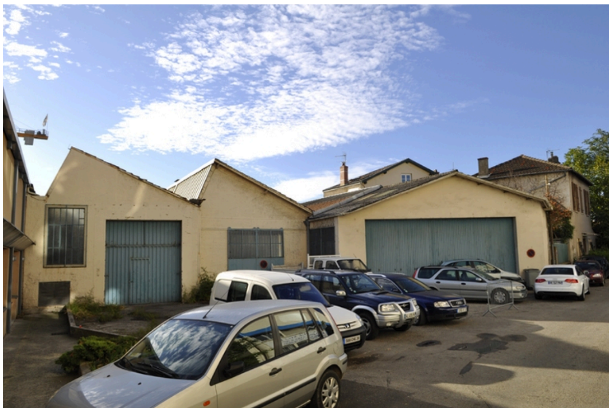
Vue d'ensemble sud