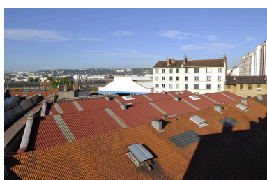
Vue zénithale