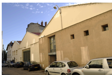
Façade sud IVR82_20106900499NUCA