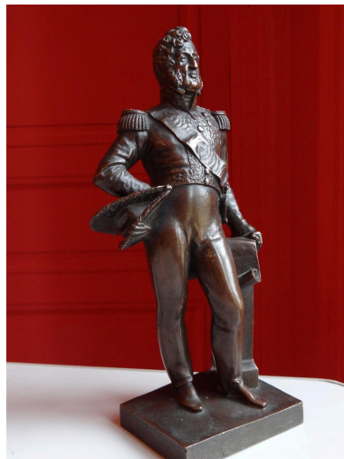
Vue générale de 3/4 IVR84_20216300910NUCA