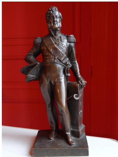
Vue générale de face IVR84_20216300909NUCA