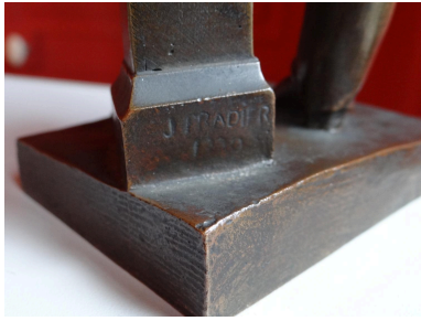
Détail signature IVR84_20216300912NUCA