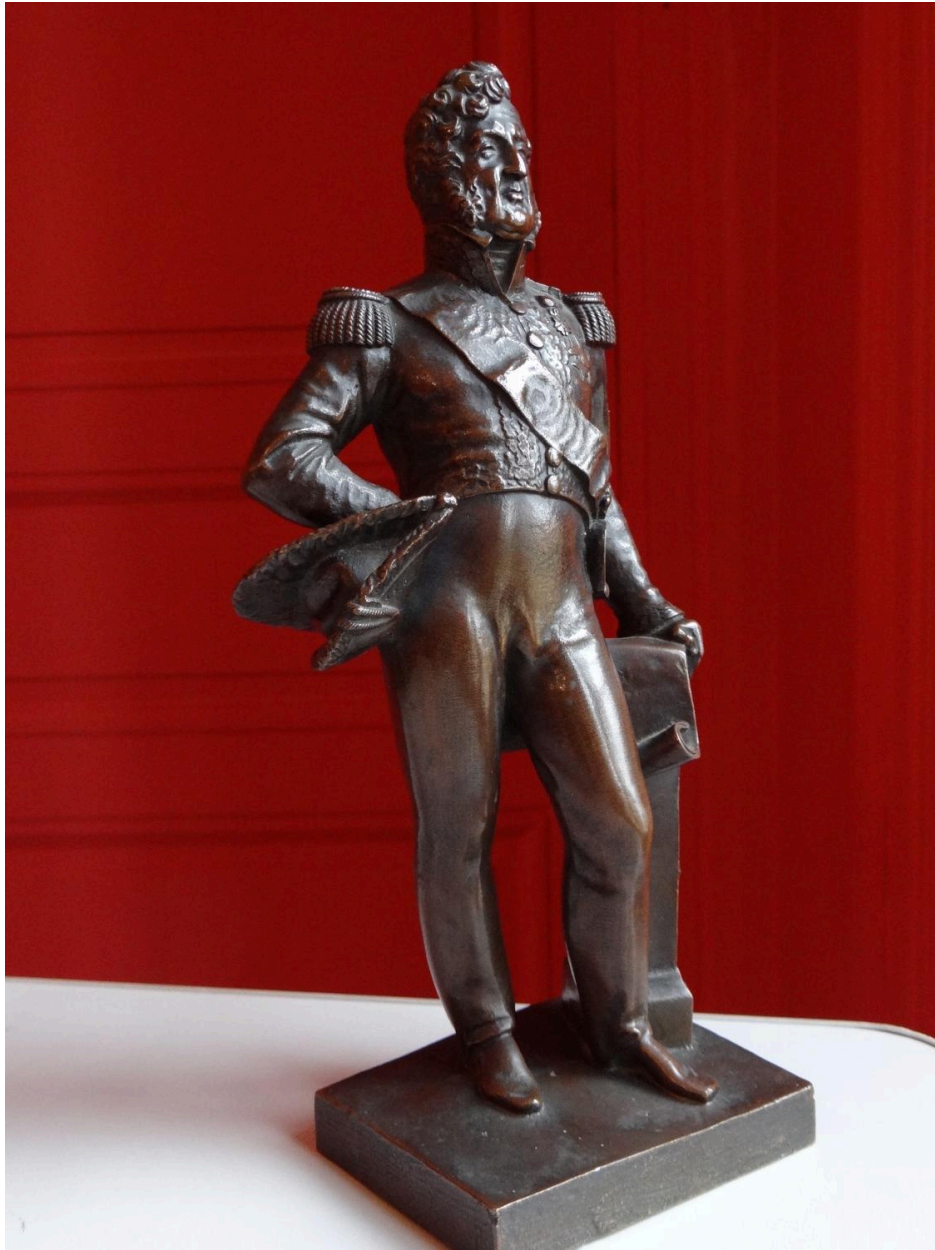
Vue générale de 3/4